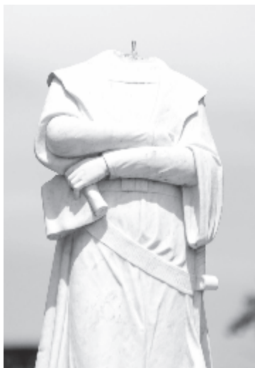
Kolumbusz Kristóf szobrát is meggyalázták

Az Egyesült Államokban az afroamerikai George Floyd rendőri beavatkozás miatti halála óta kirobant tüntetéssorozatok és erőszakos megmozdulások során az amerikai történelem több személyiségének emlékművét, szobrát döntötték le vagy rongálták meg. Köztük azonban nemcsak a rabszolgaság híveiként ismert személyek szobrai voltak, hanem például