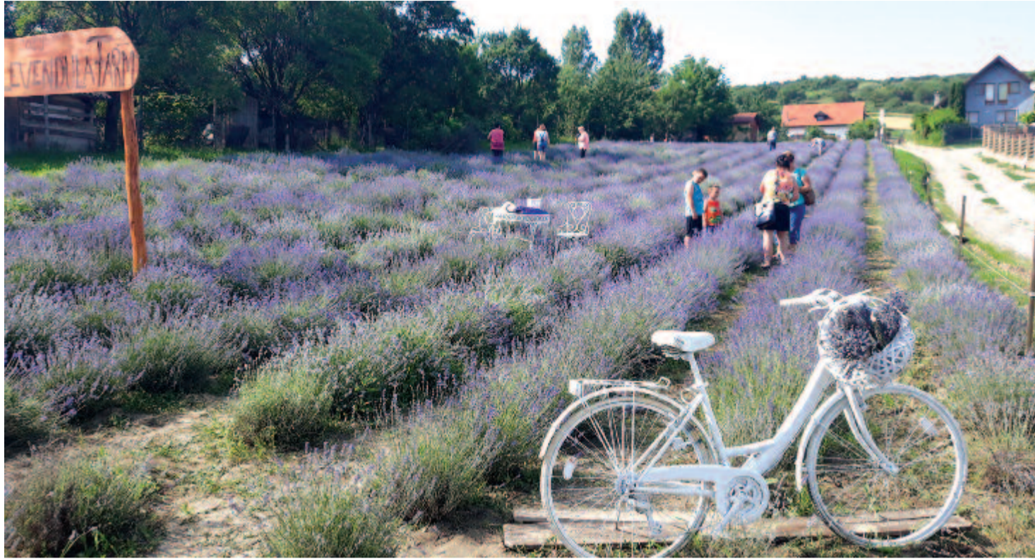
Itt a levendulaszüret ideje, sokan látogatnak el az ültetvényekre friss virágot szedni