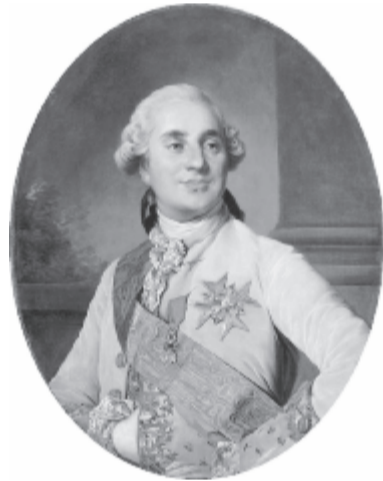
XVI Lajos király 1775-ben

A szakértők szerint a kápolna falai akár 500 kivégzett ember maradványait is rejthetik. (MTI)