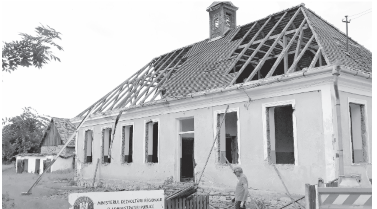
Bontják a jobbágyfalvi régi épületet