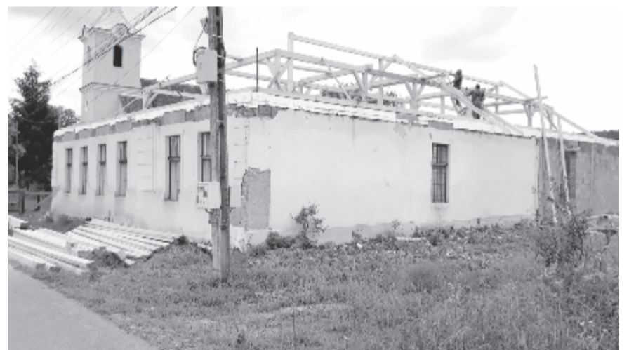
Búzaházán kibővítették az épületet, elkezdték ácsolni az új tetőt

A régi épület lebontása után az udvar hátsó részében egy 230 négyzetméter alapterületű, két-szintes iskolaépület készül, amelyben a földszinten két tanterem, lánymosdó, pedagógusi iroda és mosdó, előtér, lépcsőház, folyosó, az emeleten két tanterem, laboratórium, fiúmosdó és folyosó áll majd az elemi iskolások rendelkezésére. Három éve az elemisták is az óvoda épületébe kényszerültek a jelenlegi épület állaga miatt, de az óvodában szűk volt a hely, egyik óvodatermet osztották kétfelé. Az új beruházás megvalósulásával korszerű, tágas épületben tanulhatnak a gyermekek.