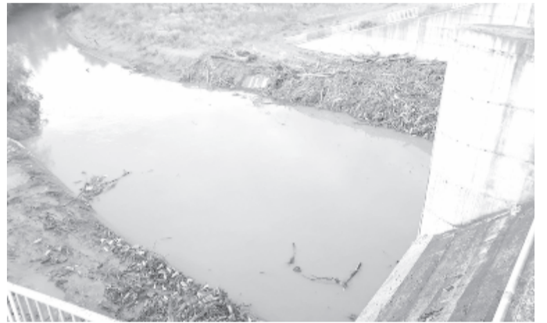
A víz átfolyását lehetővé tették a szeredai gátnál, de még sok szemetet kell eltávolítani