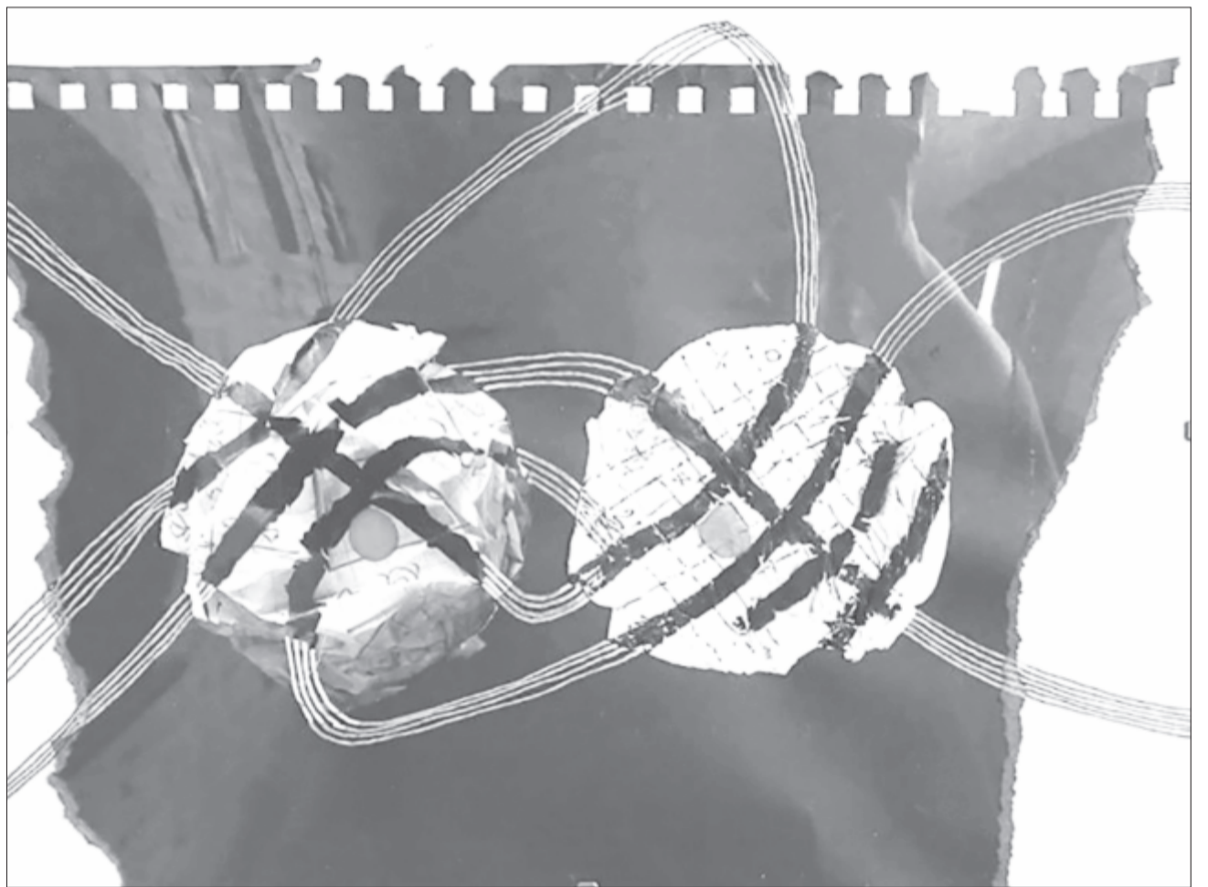
Mana Bucur: NET... Mai mellékletünk grafikái a művésznő vásárhelyi kiállításán láthatók