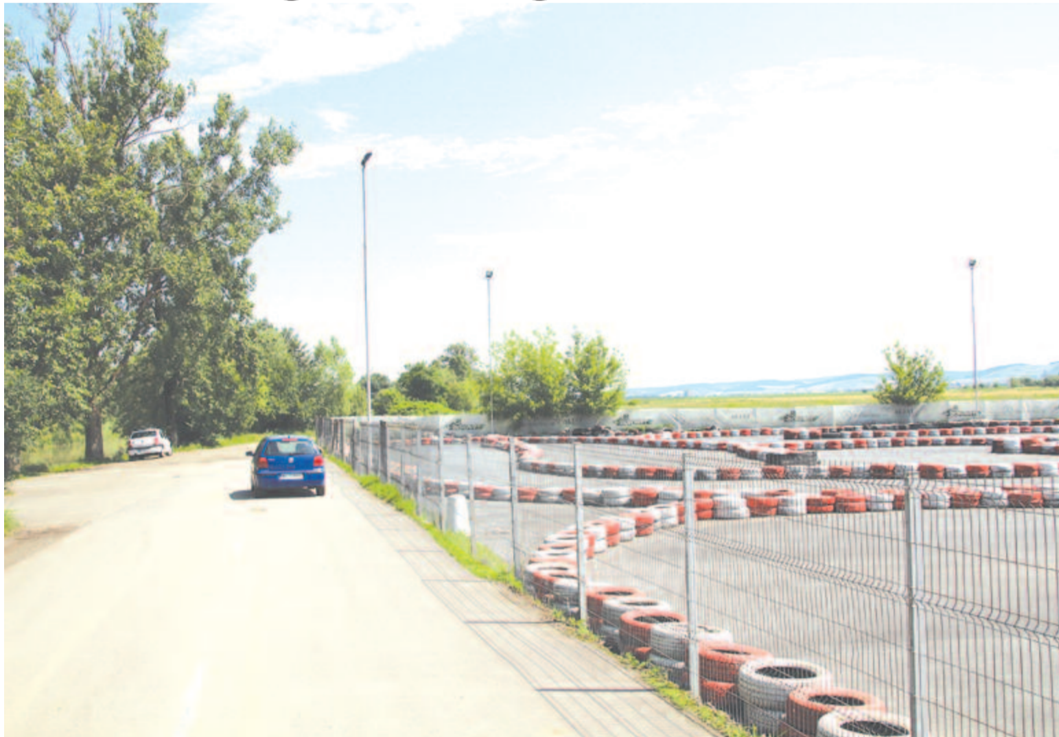
A gokartpálya szomszédságába tervezik a létesítményt