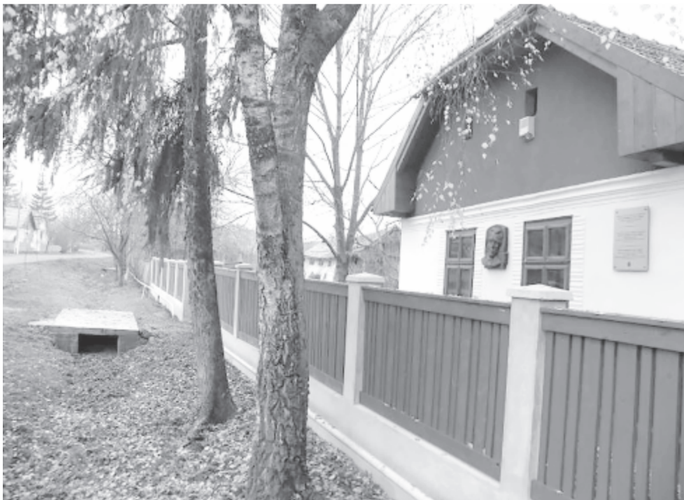
A Sütő András-emlékház Pusztakamaráson

Koszorúzás zárta a rendezvényt. A megemlékezők megkoszorúzták báró Kemény Zsigmond szobrát is a templomkertben. (nk)