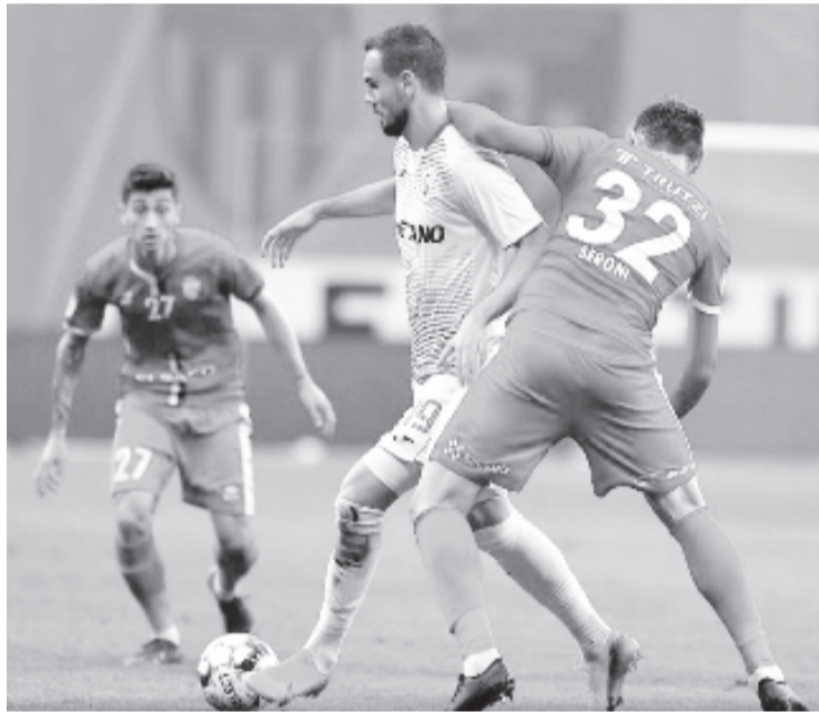
A CSU Craiova begyűjtötte a három pontot a Botoșani elleni, elmaradt mérkőzés pótlása alkalmával, és négy pontra felzárkózott a CFR mögött.

* Német Bundesliga, 32. forduló: Werder Bremen – Bayern München 0-1, Mönchengladbach – Wolfsburg 3-0, Augsburg – Hoffenheim 1-3, RB Leipzig – Fortuna Düsseldorf 2-2, Freiburg – Hertha BSC 2-1, Borussia Dortmund – Mainz 0-2, Eintracht Frankfurt – Schalke 04 2-1, Bayer Leverkusen – 1. FC Köln 3-1, Union Berlin – Paderborn 1-0; 33. forduló: RB Leipzig – Borussia Dortmund 0-2, Hertha BSC – Bayer Leverkusen 2-0, Paderborn – Mönchengladbach 1-3, Schalke 04 – Wolfsburg 1-4, 1. FC Köln – Eintracht Frankfurt 1-1, Mainz – Werder Bremen 3-1, Bayern München – Freiburg 3-1, Fortuna Düsseldorf – Augsburg 1-1, Hoffenheim – Union Berlin 4-0. Az élcsoporthoz: 1. Bayern München 79 pont, 2. Borussia Dortmund 69, 3. RB Leipzig 63.