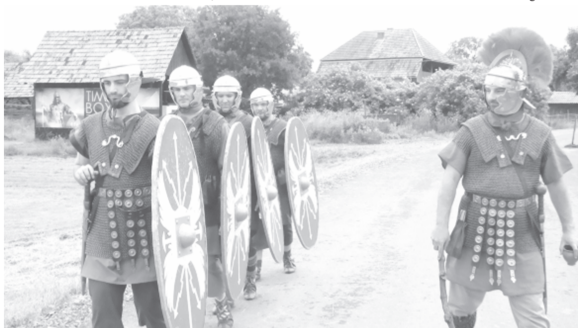
Hagyományörző katonai felvonulás a faluban

Románia arra kötelezte magát, hogy az országban levő római védelmi rendszer maradványait projekt keretében, amelyben tudományos partnerei az oktatók és a hallgatók révén a berlini Humboldt egyetem, a kölni egyetem, a Budapesti Műszaki Egyetem, valamint a pécsi és kolozsvári tudományegyetemek. A múzeum régészeti kutatásait és rendezvényeit a Maros Megyei Tanács finanszírozza, a mikházi munkájukban a nyárádrémetei önkormányzat támogatást is élvezik.