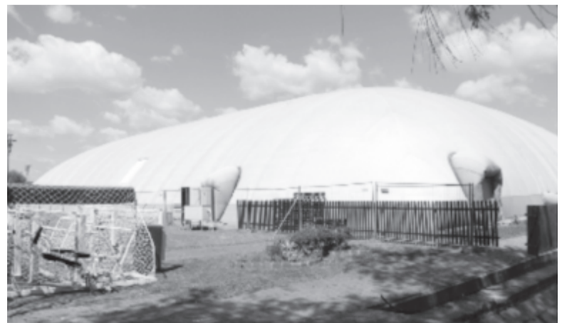
A víkendtelepi úszósátor, mielőtt lebontották

Sz.E. – Én is borúlátó vagyok. Az a véleményem, hogy a járvány miatt elrendelt korlátozó intézkedésekre már nem is emlékszünk majd, amikor a sportolóink még mindig nem kerülnek vissza arra a „fordulatszámra“, amelyen voltak mondjuk egy éve. Arról nem is beszélve, hogy két-három esztendeje milyen jól pörögtek! A politikum a saját játszmáira használja ki a helyzetet, és ilyen adok-kapok alapon intézi majd az ügyet. Ennek viszont a vesztesei egyértelműen a sportolók lesznek – no meg a sportbarát közönség!