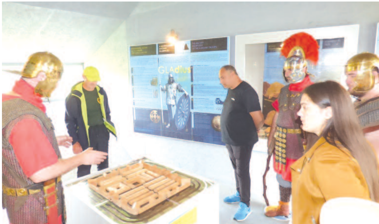
Az idődobozokban a római katonákat és a római életmódot ismerhetjük meg