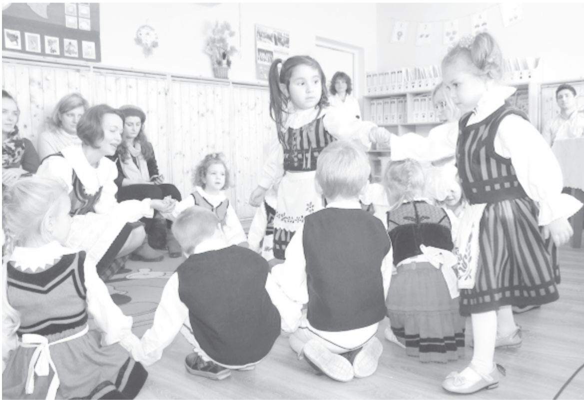
Vajon mikor fognak újra táncolni is?

Kétségtelen, hogy a gyermekek számára lelki traumát, megrázkódást jelent a maszkot viselő idegen felnőttek látványa, különösen azoknak, akik nem az eddig megszokott óvodába fognak járni. Nehéz lesz hozzászoktatni őket a kétméteres távolság betartására is, hiszen eddig az óvoda lényegét a társak, az