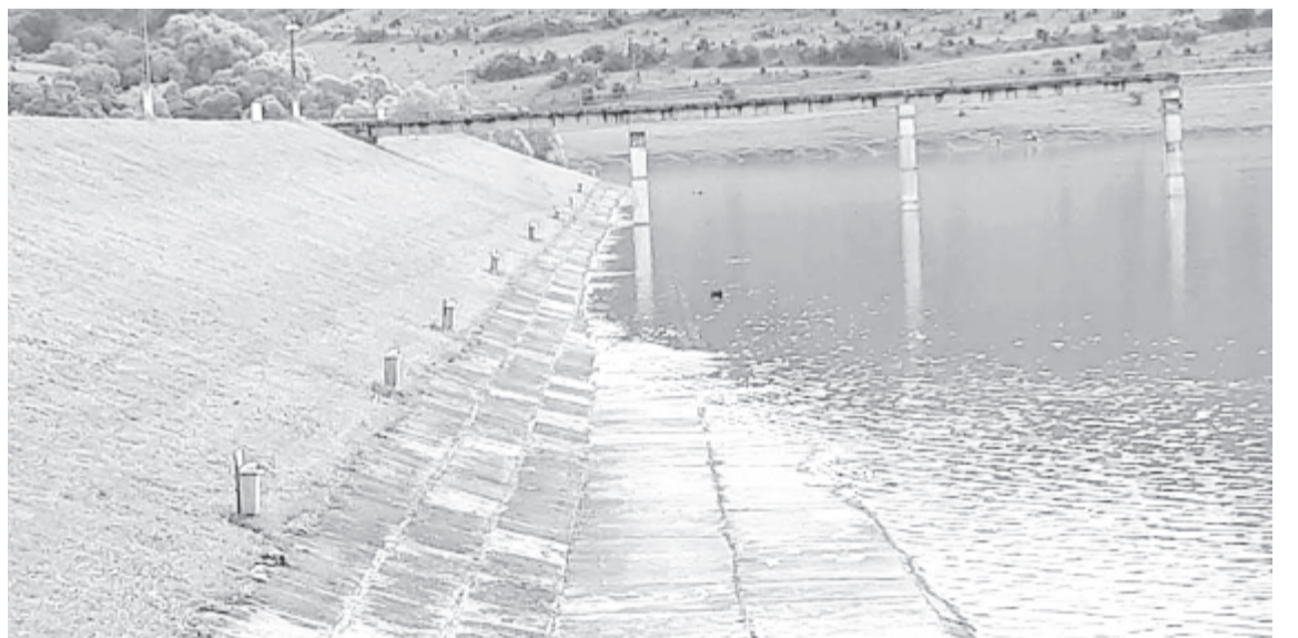
A bözödi gát kedden