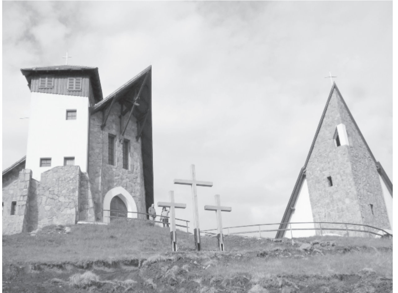
Évente két búcsút szerveznek a hegyen álló kápolnánál