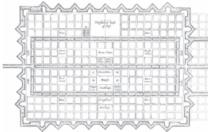
Simon Stevin városterve erődítményrendszerrel és feltölthető vizesárokkal

Igazi hazafi volt. Belátta, hogy az ország csak anyanyelvhasználatlall lesz erős. Tudu-mányos munkáit ezért kizárólag holland nyelven írta. Sőt mi több, ő az egyik holland nyelvújító is – a holland nyelvben addig nem létező tudományos szavakat alkotott. E nyel-vészkedéssel azt is bemutatta, hogy a holland nyelv nemcsak arra képes, hogy kisebb-na-gyobb hangzásbeli változtatással átvegye a latin szavakat, hanem teljesen új szavakat alk-otott a holland nyelv összetevőiből. Így a hollandok nem használják a matematika, fi-zika, kémia, geometria, asztrológia, filozófia szavakat, mert nekik erre saját kifejezésük van.