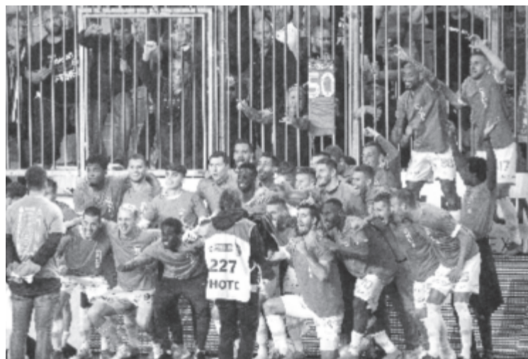
A bajnok Ferencváros játékosai ünnepelnek a labdarúgó OTP Bank Liga 30. fordulójában játszott Budapest Honvéd – Ferencvárosi TC mérkőzés végén az Új Hidegkuti Nándor Stadionban 2020. június 16-án. A Ferencváros 2-0-s győzelmével megvédte bajnoki címét.

Zubkov kihagyott óriási helyzete vezette fel a második játékrészt, majd a 48. percben szöglet után Blazic fejjel juttatta vezetékbe a vendégeket, akik öt perccel később egy kontra végén növelték az előnyüket. A hátralévő időben a házigazdák kezdeményeztek többször, de kevés veszélyt jelentettek Gróf kapujára, így végül még szépíteniük sem sikerült.