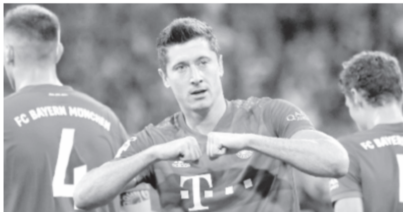
Lewandowski szezonbeli 31. bajnoki gólját, majd az újabb bajnoki címet ünnepelte.

* Spanyol La Liga, 28. forduló: Athletic Bilbao – Atlético Madrid 1-1, Celta Vigo – Villarreal 0-1, Espanyol – Alavés 2-0, Granada – Getafe 2-1, Leganés – Valladolid 1-2, Mallorca – FC Barcelona 0-4, Real Madrid – Eibar 3-1, Real Sociedad – Osasuna 1-1, Sevilla – Betis 2-0, Valencia – Levante 1-1; 29. forduló: FC Barcelona – Leganés 2-0, Betis – Granada 2-2, Getafe – Espanyol 0-0, Levante – Sevilla 1-1, Villarreal – Mallorca 1-0. Az élcsoport: 1. FC Barcelona 64 pont/29 mérkőzés, 2. Real Madrid 59/28, 3. Sevilla 51/29.