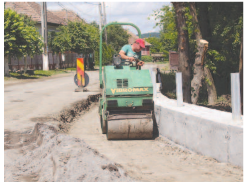
Ottjártunkkor is dolgoztak a megyei úton

A polgármestertől azt is megtudtuk, hogy a községbeliek közül kevesen maradtak a járvány miatt munka nélkül. A karantén időszaka éppen a kukorica vetésével esett egybe, a mezőn folyt a munka, így a vajdaszentiványiak számára egy napra sem állt le az élet.