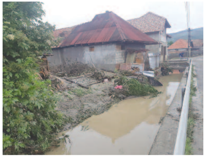
Áll a víz a település beltelkein

lenesen lakhatatlanná tette, 14 megrongálódott, 15 pedig vízzel telt meg). Nagyon megrongált egy egy kilométeres szakaszt a ravai és bordosi utat összekötő községi úton, amelynek aszfaltozását a héten kezdték volna el, így most újra el kell végezni az alapozást. 80 háztáji gazdaságot öntött el az ár, Csöbben zöldségtermesztő fóliasátrat, Ravában több méhészt károsított meg, több tíz méhcsaládot sodort el a víz, megrongálta a méhészaútokat, egy háztartásból öt többmázsás fejőstehenet ragadott el, de sikerült kimenteni őket az éjszaka folyamán. Több gazdaságból több kistraktort, szénasodró és bálázógépeket, takarmánybálákat, még egy, a pásztorok által használt faházat is több száz