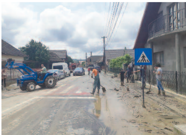
Takarítják az utcát Erdőszentgyörgyön