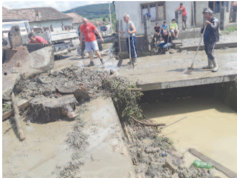
Erdőszentgyörgyön szombat éjszaka, vasárnap és hétfőn is dolgoztak a kárelhárításon