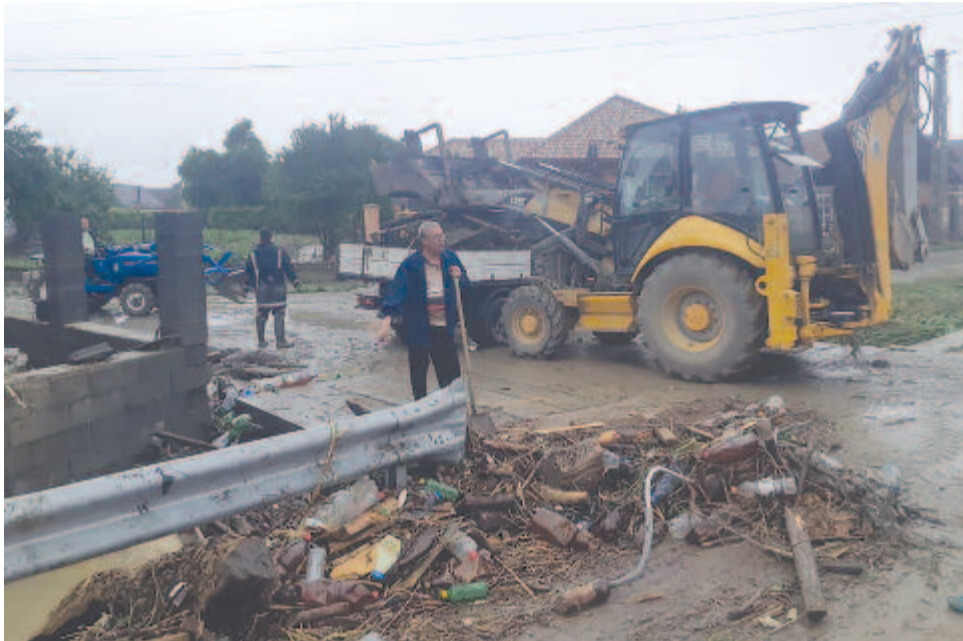
Mentés a kisvárosban

A napok óta tartó csapadékos idő és a hirtelen lezúduló hatalmas vízmennyiség a Felső-Nyárád mentén is okozott kisebb-nagyobb áradásokat, hétfőn Nyárádremetét, Nyárádköszvényest és Mikházát öntötte el a víz. Az esetre holnapi lapszámbunkban visszatérünk.