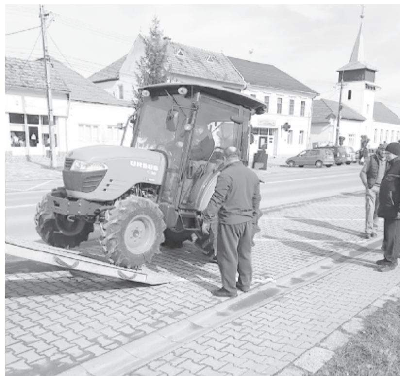
A munkagépek még decemberben megérkeztek

A terv megvalósításához be kellett vállalnia a 87 ezer lejes önrészt is. Ugyancsak saját költségén egy 200