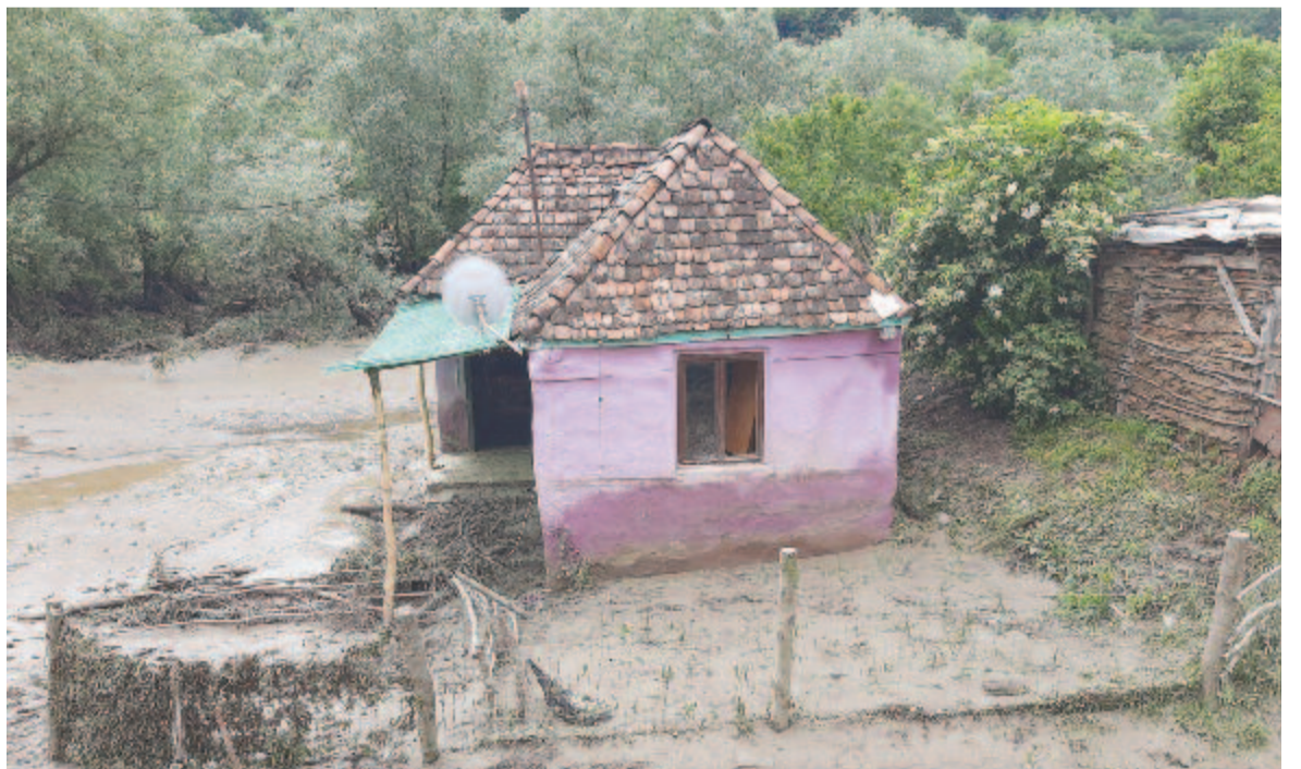
Ravában egy házat lakhatatlanná tett az ár, munkagépeket, állatokat, méhkaptárakat, takarmányt sodort el