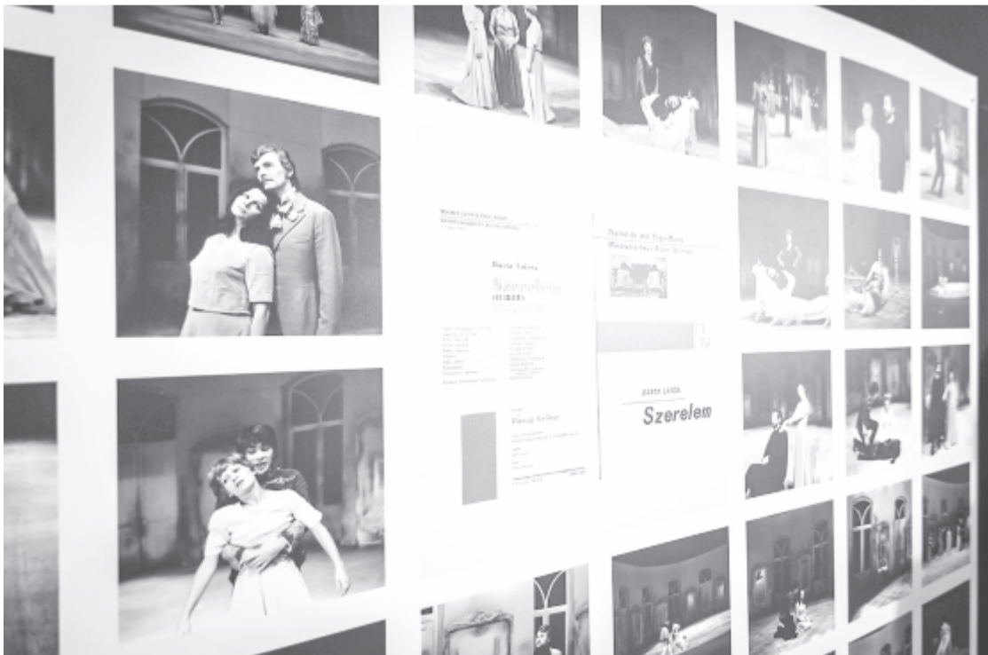
A Szerelem pannója a Marosvásárhelyi Nemzeti Színház előcsarnokában.

A portrészorozat kellő méretben került az érdeklődők elé, a két előadásból kiemelt jelenetek sajnos jóval kisebb formátumban és csoportosítva láthatók, ezért a várhatónál kevésbé érvényesülnek a pannókon, noha kétségtelen, hogy rögzítőjük, a színházi fotósként is remeklő néhai Marx József a sajátos és a lényegit jól ötvözve örökítette meg a produkció szellemét és kísérletezőn újító törekvéseit. A tárlat erre nevesítve nem utalt, de ne feledkezzünk meg róla se az előcsarnok földszintjén ötletesen elhelyezett lát-nivalók között. (N.M.K.)