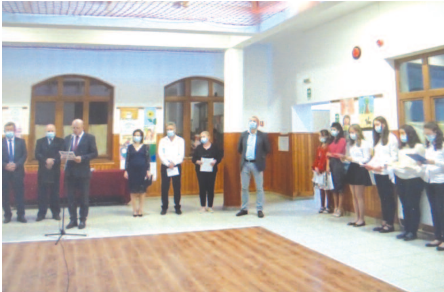
Rendhagyó, eddig elképzelhetetlen módon zárult az idei tanév a végzősök számára