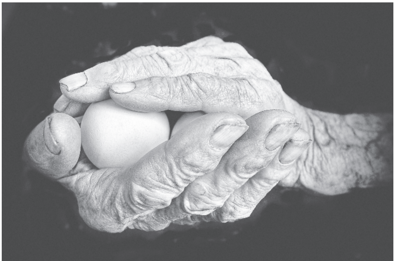
Oltalom... Tordai Ede fotója a Nemzetközi Magyar Fotózalon marosvásárhelyi kiállításán

hogy tudjam, lesz majd új idő tavaszi szomjnak, nyári táncnak, fedetlen arcom szerető, áldott fényedtől lesz bocsánat.