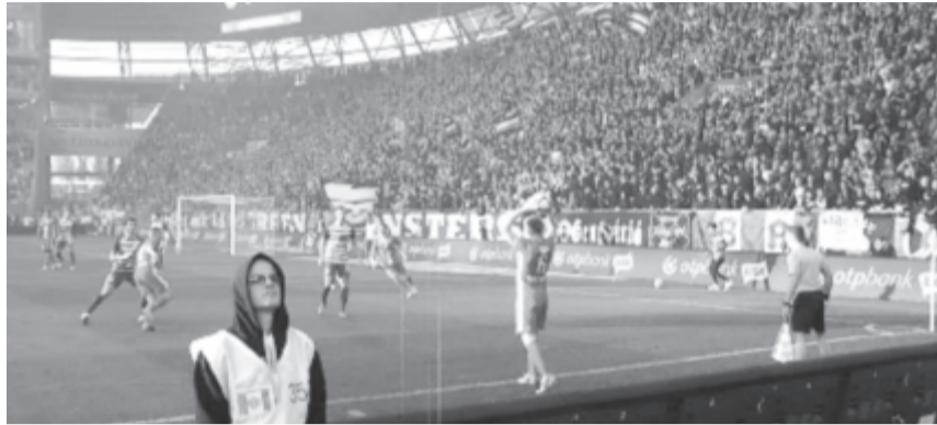
Elsőként a Ferencváros – Debrecen rangadó kerül képernyőre