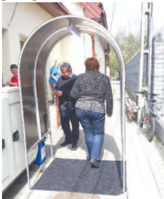
Az udvaron fertőtlenítőkapu is áll, hogy ne juthasson fertőzés az intézménybe