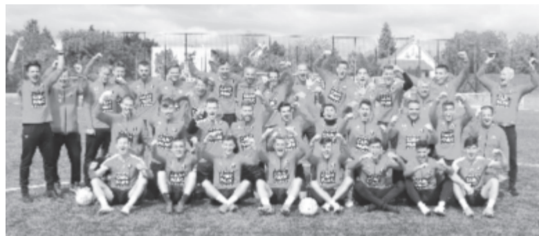
A Budafok feljutást ünneplő együttese: 74 év után szerepelhetnek újra az élvonalban