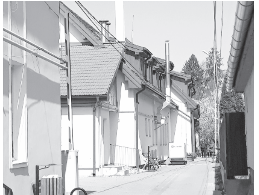
Gyakorlatilag a személyzetet kívül senki sem léphet be az időszobákba

A szigorú lezárás miatt az intézménybe csak bejövő személlyel érkezik bármilyen fertőzés, de ennek kockázatát a lehető legkisebbre próbálják csökkenteni a fizikai érintkezések lehetőség szerinti kizáráásával. Minden beszállító a bejáratnál leteszi a termékeket, távozása után pedig a maszkkal, kesztyűvel ellátott személyzet lefertőtleníti azokat, így kerülnek be az épületbe. A lakók hozzátartozóit megkérték, hogy ha nem szükséges, ne küldjenek semmilyen csomagot, bár vannak olyan betegek, akiknek szükségük van pelenkára vagy egyéb eszközökre, amit be kell juttatni – ezeket is hasonló óvintézkedések mellett