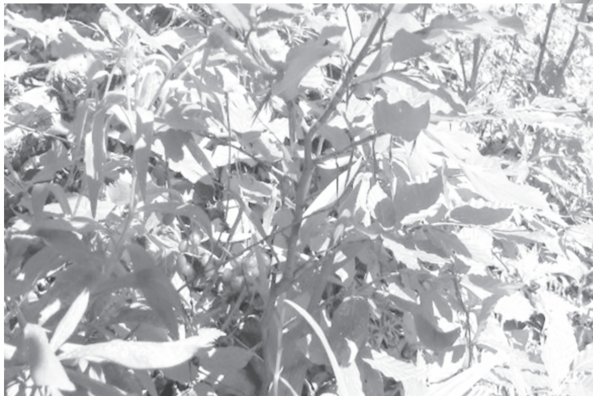
Saját fotó a farkasboroszlán terméséről a Szlovén Alpok lábánál, a Bohinj-tó (527m) közelében

(gyalogborostyán, daphne kneoron ), mely ily nagy mennyiségben sehol a világon nem tenyészik, s midőn májusban virágzik, akkor a biborpirostól minden színben váltakozó szinompában tűnik fel az egész hegy, a légillattárral van eltelve, s kik a természet ily kiváló helyein üdülést találnak, fel is keresik azt most, s felkeresték régen is...”