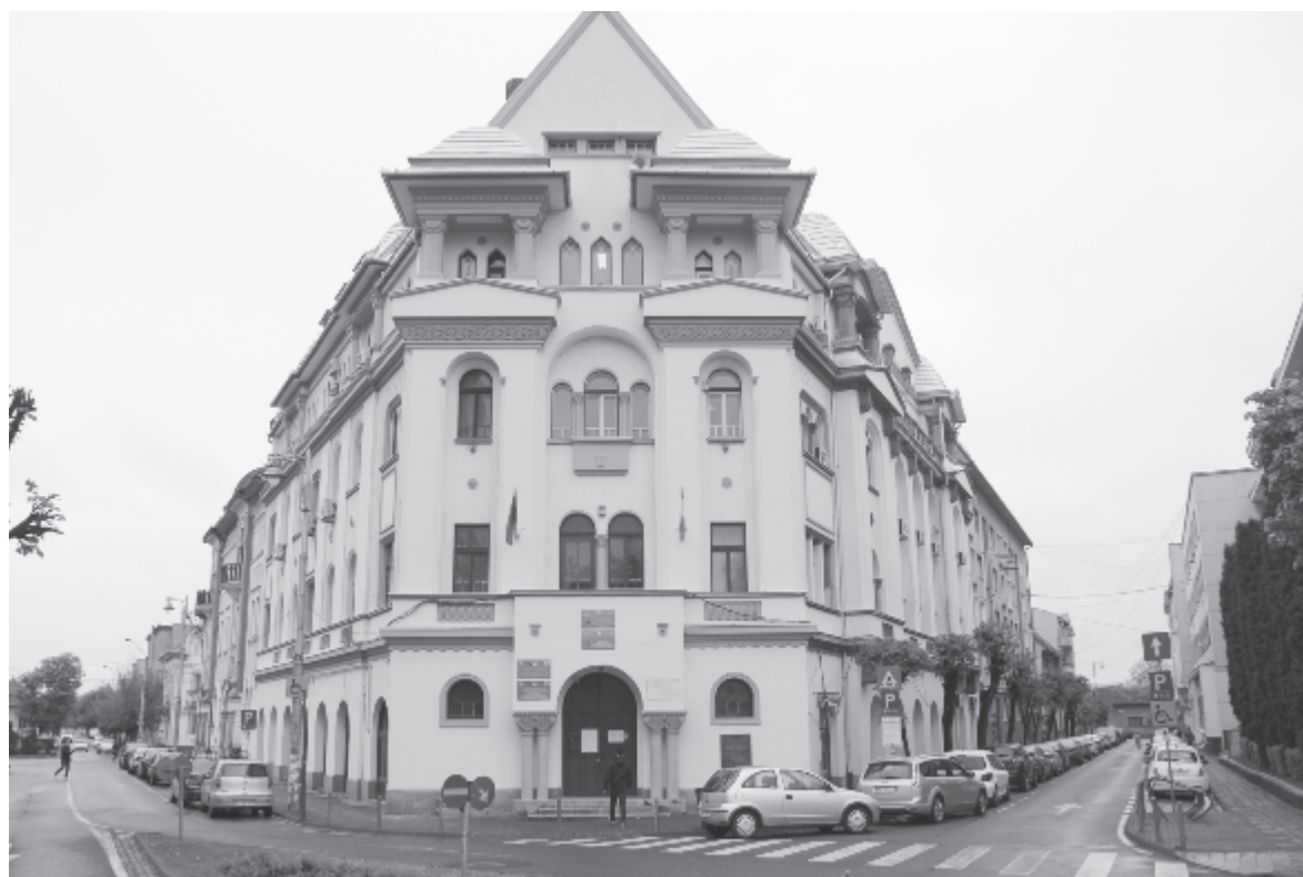
A megyei munkaügyi igazgatóság székhelye

A miniszter szerint a kockázati pótlékot a szükségállapot ideje alatt, azaz két hónapra fizetik. (Agerpres)