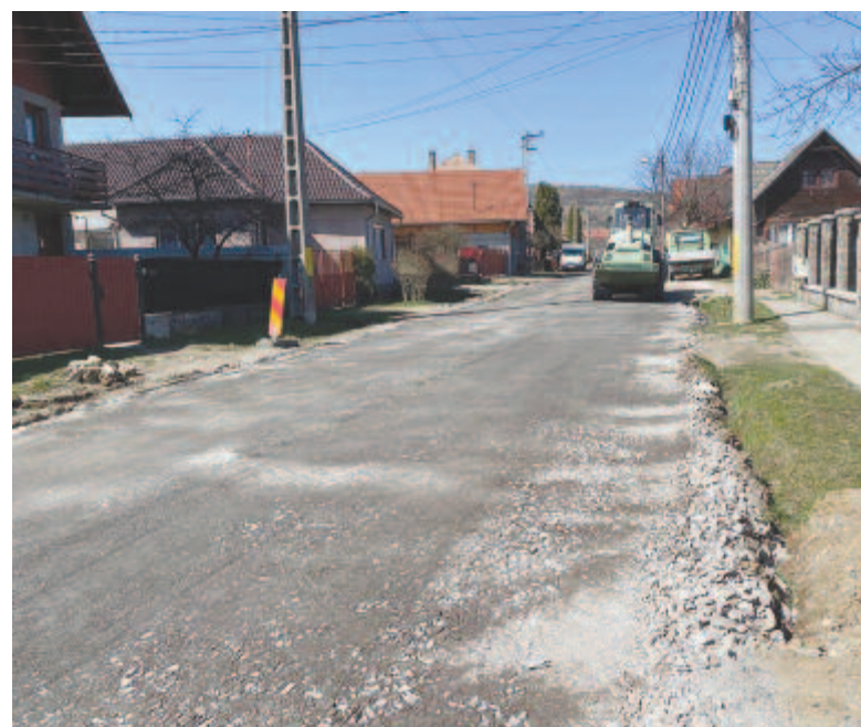
Ha befejeződik a most elkezdett beruházás, a város legtöbb utcája aszfaltozva lesz

Addig is öröndetes tény, hogy már rövidülhet az aszfaltozatlan útszakasz, ugyanis az elmúlt időszakban a Május 1. utca aszfaltozásával egy kilométert korszerűsítettek, a Patakmajor utca is szerepel az idei aszfaltozási projektben hét-nyolc-száz méterrel, így már csak a hátramaradt szakasz marad, az útelágazástól a faluba.