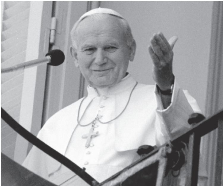
Szent II. János Pál pápa

A bélyegblokk Baticz Barnabás grafikusművész tervei alapján az ANY Biztonsági Nyomdában készült. A fekete sorszámozású alapváltozat mellett piros sorszámosság, zöld sorszámosság speciálisan perforált változat és egy exkluzív