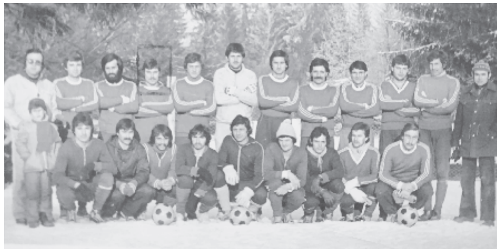
Edzőtáborban az IRA csapattal