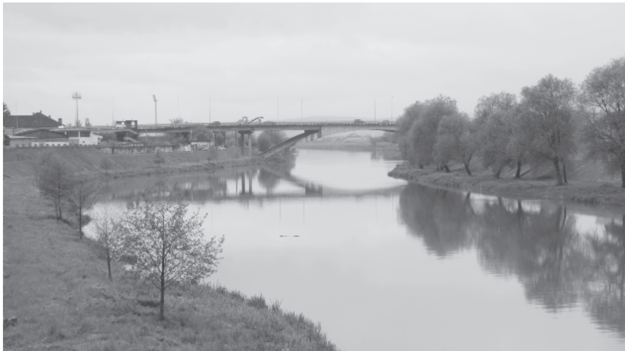
A többnapos eső ellenére csak enyhén nőtt a folyók vízhozama