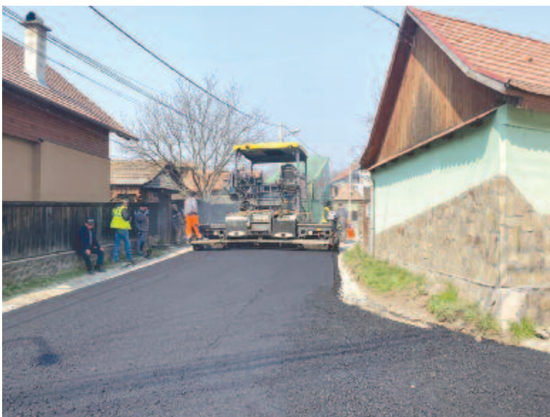
Nem vártak a sült galambra, önerőből is elkezdtek már néhány további utca korszerűsítését

A projekt elbírálása 2017-ben kezdődött el, a támogatási szerződést 2018 decemberében írta alá a városvezetés, a tavaly megtartott versenytárgyalásokat a Geiger cég nyerte meg. A kivitelezőnek nemrég