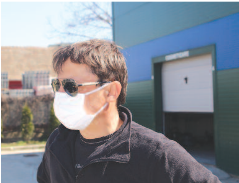
Sokan használnak arcmaszkot, ha kimennek a házból

* A válaszadók egészségügyi érintettsége még nagyon alacsony: • A válaszadók mintegy 3%-a gondolja azt, hogy megfertőződhet a vírussal, voltak erre utaló tünetei (viszont a tesztelési szakaszig nem jutottak el). Csúpan 0,1%-a számolt be arról, hogy pozitív koronavírus-teszt-eredménye van. • 1% alatti azoknak az aránya, akiknek a családjában, közeli ismerősei körében volt bizonyítottan a koronavírus által okozott betegség vagy halálozás.