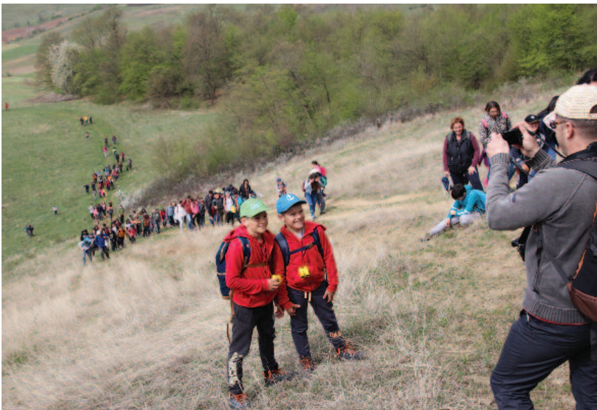
A Só útján

A Fókusz Öko Központ a Só útjának népszerűsítésére 2008-ban szervezett először évadnyitó rendezvényt, majd ezt követően évente megismételte az eseményt, számos iskola diákjaival, tanáraival közösen. A vezetett gyalogtúra a székellybői kultúrotthontól indult, majd mintegy 12 km megtétele után a jobbágyfalvi Tündér Ilona panziónál ért véget, ahol a résztvevők (volt olyan év is, amikor 600-an voltak) szabadidős programokon, vetélkedőkön vettek részt. Az évek során volt néptáncbemutató, dalfesztivál, tudományos-ismeretterjesztő előadás, és elmaradhatatlanok voltak a környezetvédelmi témájú játékok. A túra helyi vendéglátói a Székelybőért Egyesület tagjai voltak, akik minden alkalommal fánkkal fogadták és indították útra a résztvevőket. A Tündér Ilona panziónál gulyással várták a fáradt gyalogtúrázókat, akiknek a biztonságára a Maros megyei speciális barlangi és hegyimentő alakulat tagjai vigyáztak, rendszeres támogatói, résztvevői voltak az Erdélyi Kárpát Egyesület Marosi Osztályának és a Pro Bicyclo Urbo egyesületnek a tagjai is. A népszerűsítésnek köszönhetően a turistaútvonalat év közben is sokan keresik fel. Az út mentén halad a Csíksomlyóra vezető a Mária-zarándokút is. A vírusjárvány miatt várhatóan – a szigorú óvintézkedések fokozatos enyhítését követően – még többen keresik fel az igazán szép és tartalmas élményt kínáló útvonalat. (vajda)