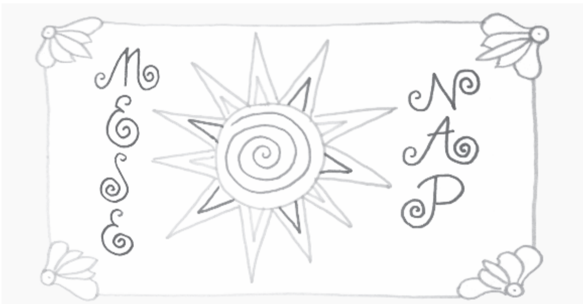
Gyermeknapi ünnepség az Ariel színház és a Divers Egyesület Facebook-oldalán

https://www.facebook.com/hagyomanyokhaza/videos/248716029544069/