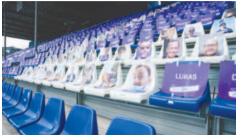
Egyes székekre a szurkolók nevét, másokra az arcképeket is kitétték a darmstadti stadionban.