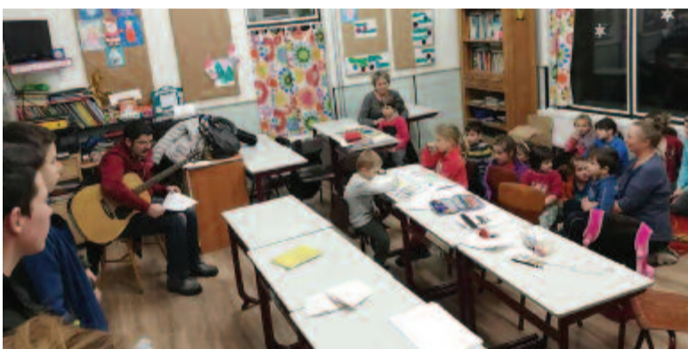
Zenés áhitat gyerekeknek