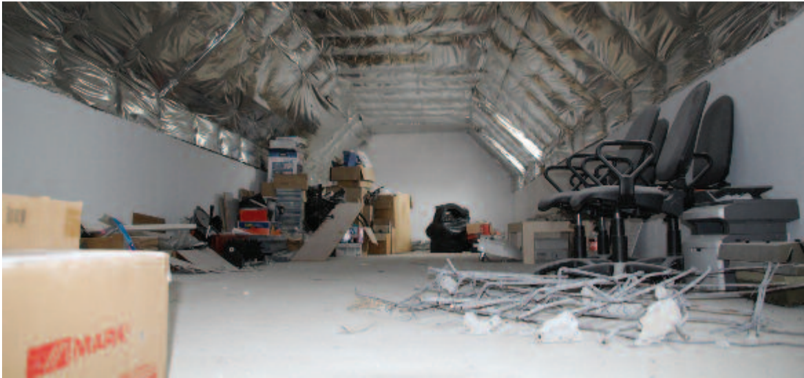
Készül a tanácsterem