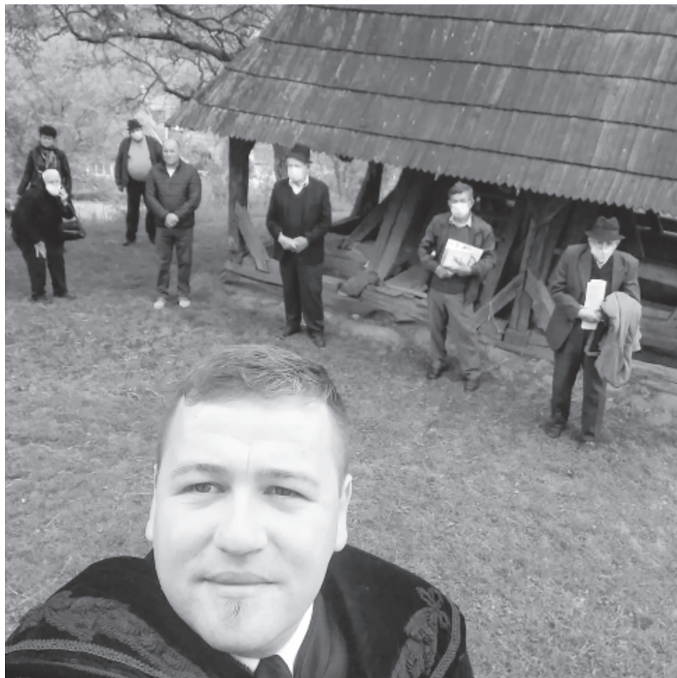
A bekecsalji reformátusok is ott voltak a templomudvaron.

Május 22-én, pénteken délelőtt 11 órakor Erdély-szerte megszólaltak a harangok a református templomokban, ezzel fejezték ki a magyar reformátusok egységét. A generális konvent 2012. évi ülésének zárónyilatkozatában úgy határozott, hogy június 4-ét, a nemzeti összetartozás napját felveszi a reformátusok legjelesebb napjai közé. A Magyarországi Református Egyház zsinati elnökségi tanácsa felkérésének eleget téve, az erdélyi egyházkerület nemrég arra kérte a gyülekezeteket, hogy május 22-én a reformátusok egységére, június 4-én pedig a trianoni békediktátum századik évfordulójára emlékezve harangozzanak.