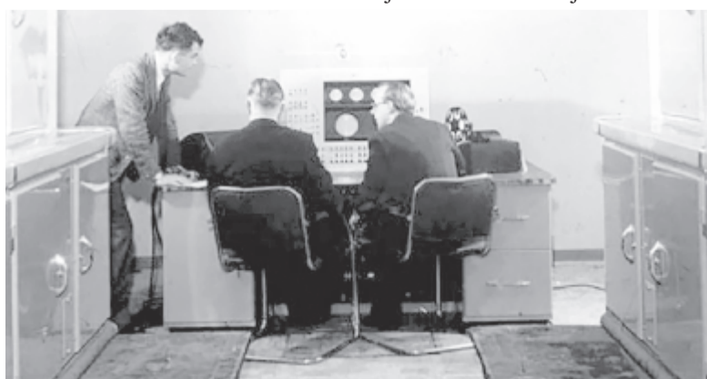
Alan Turing és munkatársai a Mark I. számítógéppel (a szekrények is a számítógéphez tartoznak!)

Alan Turingot valószínűleg saját tudásvágya gyilkolta meg 1954-ben. Otthoni laboratóriumában folyton kísérletezett. Lehetséges, hogy e kísérletek következtében halt meg cianmérgezésben. A 41 éves zseni kódfejtő múltja azonban rejtélyessé – talán megfejthetlenné – tette pusztulását, mert feltételezhető az idegenkezűség is a mérgezésben.