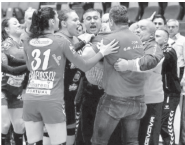
A Bukaresti CSM és a SCM Râmnicu Vâlcea közötti, március 11-ei mérkőzés utolsó pillanatai. A feszült hangulatú találkozót a házigazdák egy góllal nyerték

beszakításakor jegyzett tabellát végeredménynek tekintik, a bajnoki címeket pedig nem osztják ki. A határozat értelmében a Kolozsvári U BT indulhat a férfikosárlabdázók Bajnokok Ligájában, míg Nagyvárad és Nagyszeben az Európa-kupában nevezhet. A nőknél pedig az első helyezett Sepsiszentgyörgy minden bizonnyal helyet kap majd a FIBA EuroCup sorozat mezőnyében.