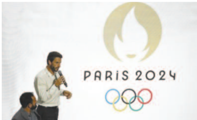
A négy év múlva esedékes ötkarikás játékok főszervezője, Tony Estanguet elképzelhetőnek tartja a költségmegtakarítást, és már azt is tudja, hogyan lehet több millió eurót nem elkölteni

Estanguet kijelentette, a személyszállításban és az elszállásolásban nagy spórolási lehetőség rejlik, ennek kapcsán pedig már egyeztettek is a