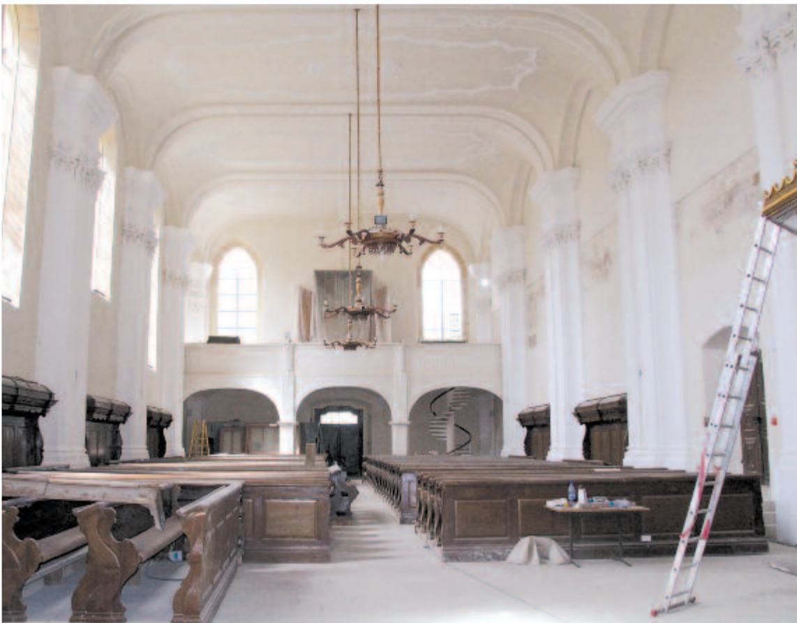
A szószerk javítása még hátravan