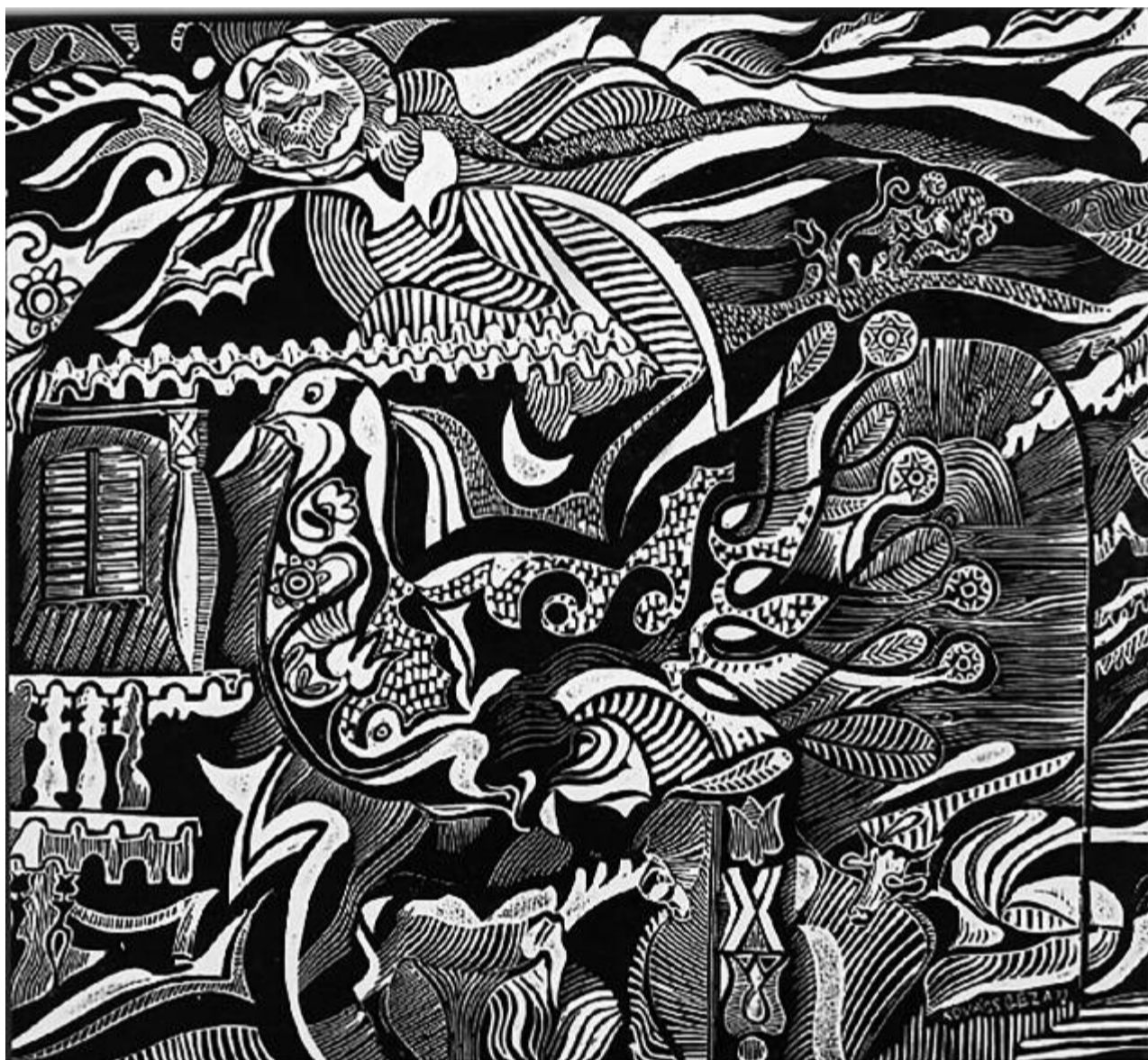
Sz. Kovács Géza: Bölcső és környéke

*1937. május 18-án született a költő, Lászlóffy Aladár. Páskándi Géza ugyanezen a napon 1933-ban jött a világra. A sokoldalú alkotó 25 éve, 1995. május 19-én hunyt el.