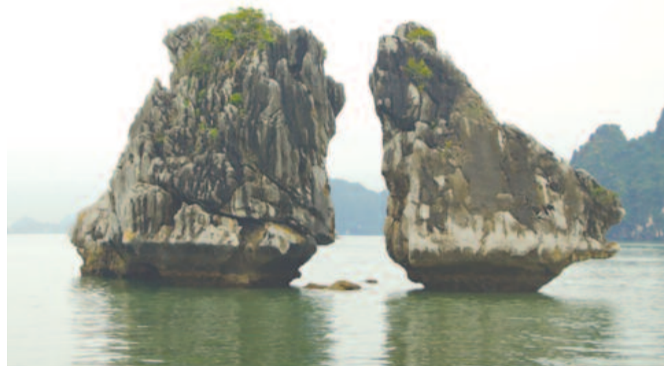
A Veszekedő csirkék

szikla a Veszekedő csirkék elnevezést kapta, még az egyik papírpénzükön is rajta van.