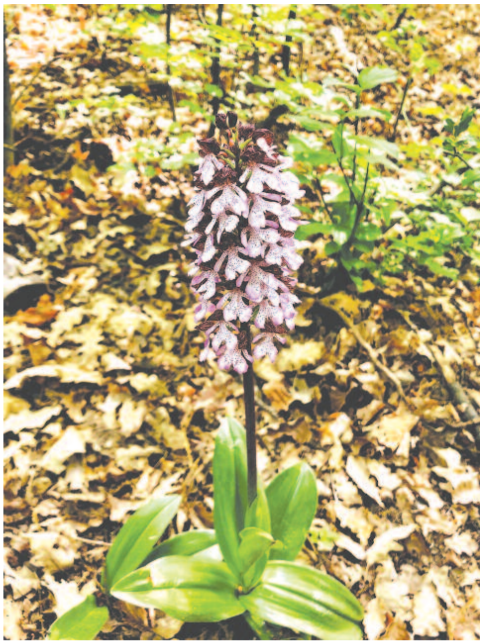
A bíboros kosbor (Orchis purpurea) sem ritka a Marosvásárhely környéki erdőkben