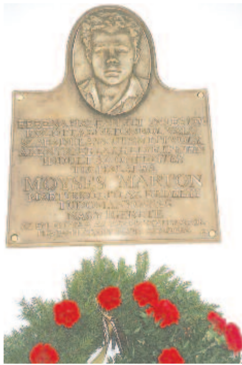
Emléktábla a szülőháznál