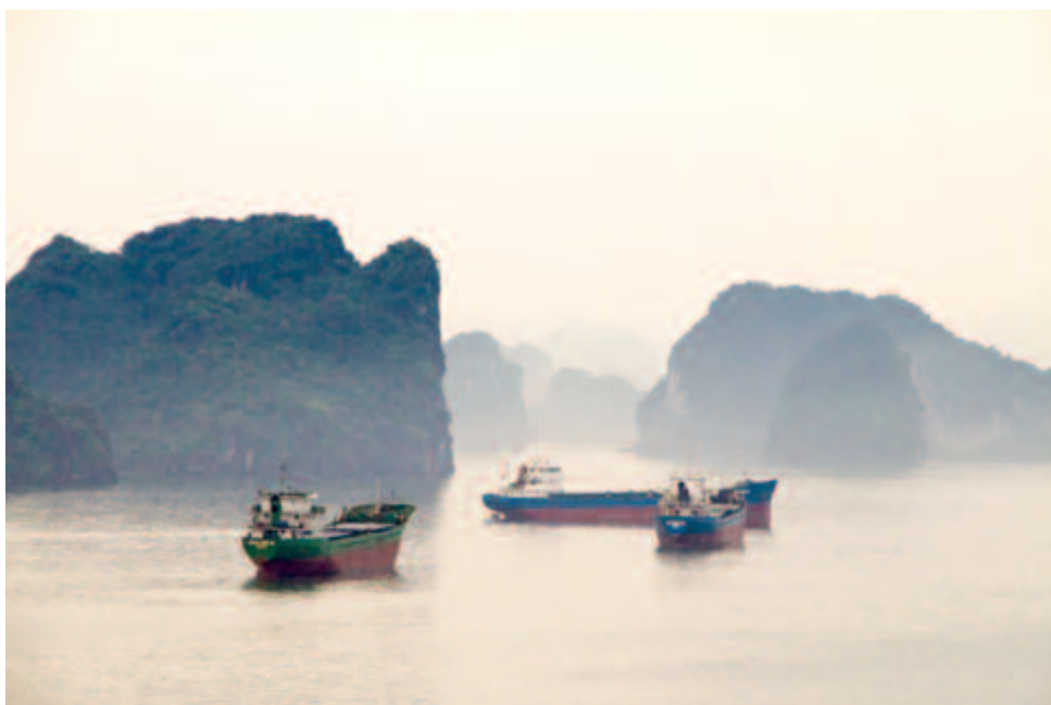
A Ha Long-öböl