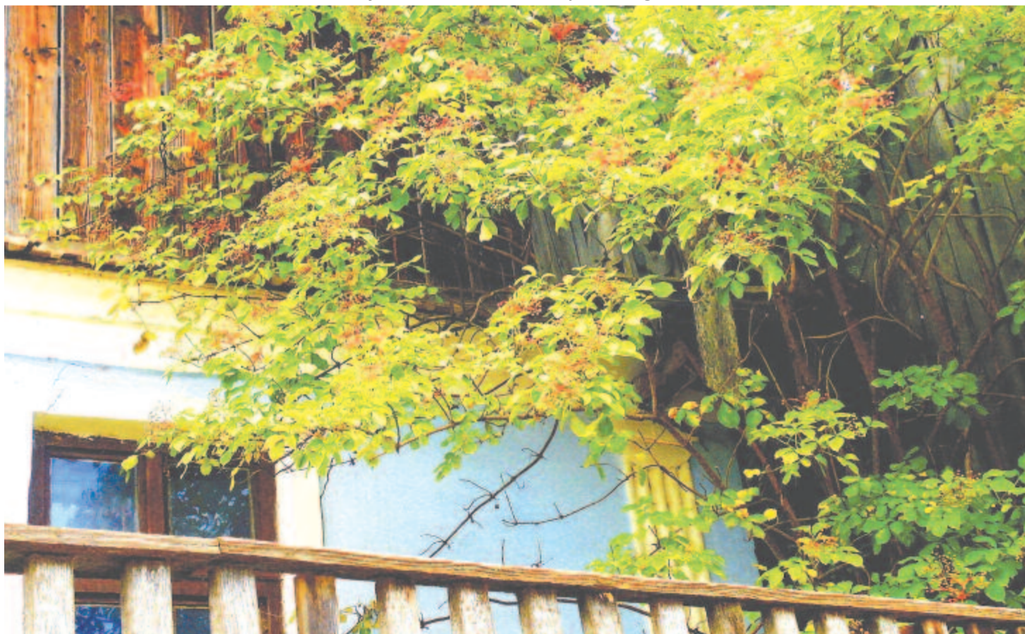
Sem fehér virág, sem fekete bogyó – éretlen bodzafa- (Sambucus nigra) tányérok a mérai tájház előtt