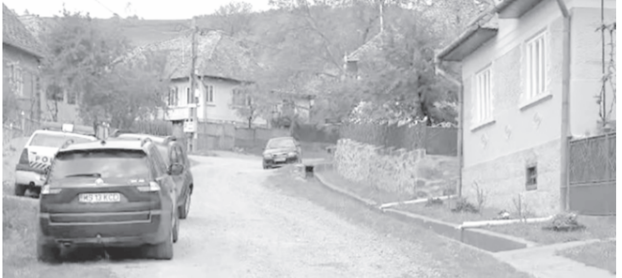
Nem emlékeznek a helyiek ilyen esetre

igazolja, hogy nem baleset folytán került oda, hanem eltervelt szándékkal ugrott bele. A tűzoltók nem tudtak hozzáférni, így vízzel töltötték fel a kutat, majd kiemelték a holttestet, amelyet aztán kórbonctani vizsgálatra szállítottak a megyeszékhelyre – számolt be a részletekről lapunknak az egyik falubeli. Az eset megdöbbentette a falubelieket, egyrészt, mert rendes és istenfélő, templomba járó asszonyként ismerték, másrészt emberemlékezet óta nem történt ilyen öngyilkosság ezen a településen.