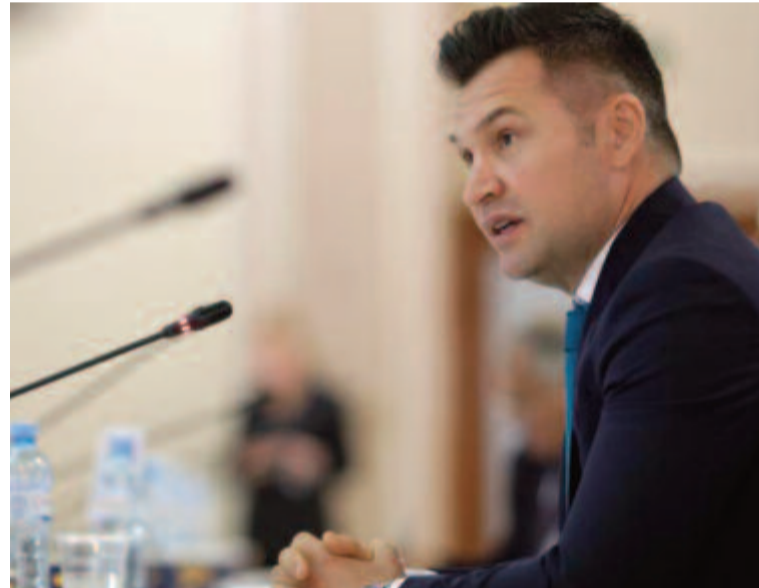
Első látásra is azonnal észrevehető, hogy a sportminiszter által ismertett feltételek teljesítése csak kevés sportoló és csapat esetében lehetséges.

Stroe szerint a sportolók futása és kerékpározása mindenhol engedélyezett lesz, ám egy csoportban nem tartózkodhatnak háromnál többen, míg a felkészülés előtt megnyíló sportbázisokon olyan feltételeket kell teljesíteni, amelyek komoly logisztikai kihívás elé állítják a klubokat és sportszövetségeket. Ennek érdekében a minisztérium egy rendeletet is kibocsátott a részletes feltételekkel.