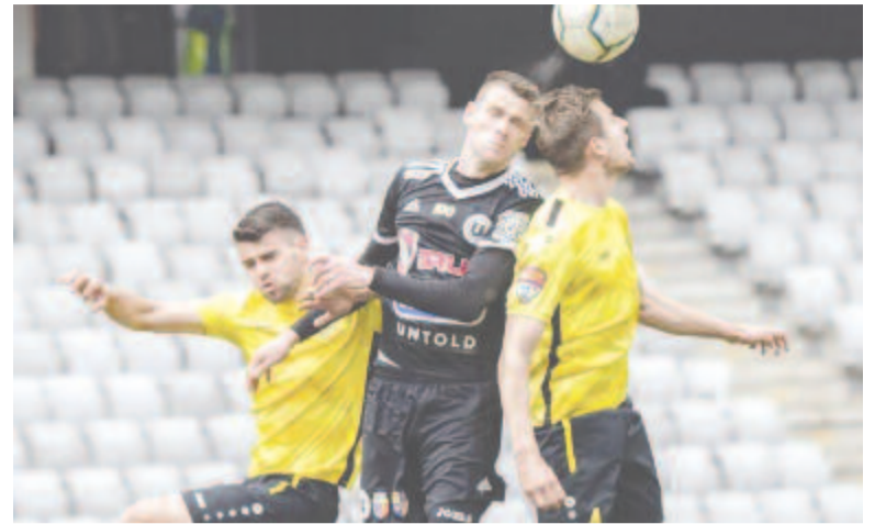
Meglepetésre a Kolozsvári U is egyike azoknak a kluboknak, amelyek a bajnokság azonnali lezárásában lennének érdekeltek.

A Román Labdarúgó-szövetség vezetői és a 2. ligás klubok képviselői közötti videokonferencia után mindössze négy sportszervezet (az UTA, a Rapid, a Turris Turnu Măgurele és a Petrolul) jelezte, hogy nyitott az edzések újraindítása tekintetében, az Egészségügyi Minisztérium és az Ifjúsági és Sportminisztérium által ajánlott protokoll alapján, számolt be a Pro Sport című lap.