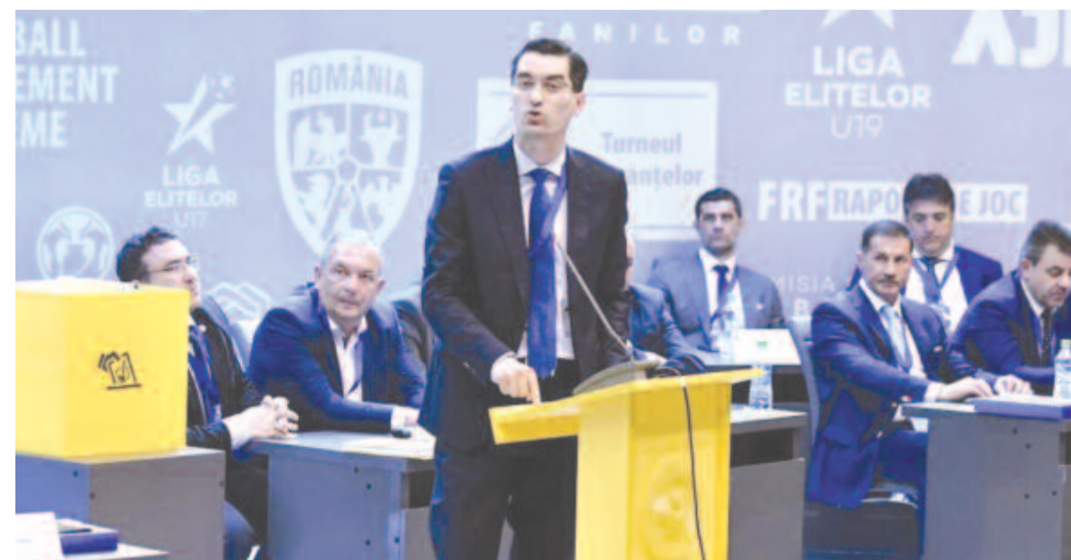
A Román Labdarúgó-szövetség elnöke, Răzvan Burleanu kikérte a 2. és 3. ligás klubok véleményét a kérdésben.

Egy ilyen módosításban még reménykednek néhány megyében, ahol be szeretnék fejezni a pályán a 4. ligás pontvadászatot. A Maros megyei egyesület – a minisztérium döntése alapján – a honlapján egyelőre csak a gyerek- és ifjúsági bajnokságok berekesztését jelentette be.