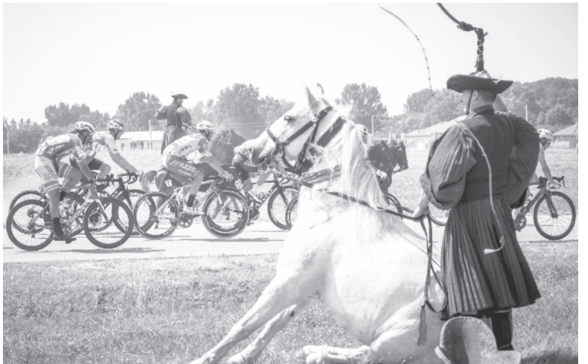
A május 20-ig megjelenő teljes naptárban kedvező őszi időpontot kaphat a kényszerűségből elhalasztott magyar kerékpáros körverseny.

A legnagyobb egynapos futamokból négyre októberben kerülne sor, a kivételt a Milánó – Sanremo jelenti, amely a mostani tervek szerint augusztus 8-án lenne. A Liege – Bastogne – Liege október 4-re, a flandriai körverseny október 18-ra, a Párizs – Roubaix október 25-re, a lombardiai körverseny pedig október 31-re került. A világbajnokság időpontját nem változtatták meg, így arra szeptember 20. és 27. között kerül sor Svájcban.