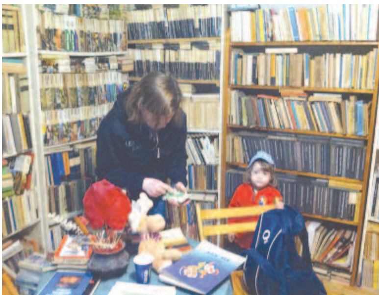
Karantén előtt a Garabontzia könyvesboltban

– Ez az amúgy sem egyszerű feladat, küldetés vagy hivatás – ki minnek érzi – bonyolult, sokösszetevős függvény, sokismeretlenes egyenlet. A nagy kiadó-konferenciák – gondolok itt a Libri és a Lira csoportra – tudnak piacutatást végezni egy-egy kiadvány esetében. Mi, erdélyi kiadók, erre a feladatra (sem) tudunk humán erőforrást biztosítani, mert az anyagi keretek végesek. Eddig is egyéves tervekben gondolkodtunk, és hónapról hónapra számoltuk ki a kiadások és eladások függvényét, beleértve a támogatásokat. Jelen helyzetben napi költségeket számolunk, a kiadások és a bevétel aránya ugyanis felborult. Április közepén érkezett meg a nyomdából a legfrissebb kiadványunk, és – csak hogy érzékeltessem a helyzet súlyát – a nyomdászámólap napokon belül ki kell egyenlíteni, azonban a boltok csak 15–20%-os hatékonysággal működnek. 2014-től – amikor a jogokat és a brandet a néhai Mentor