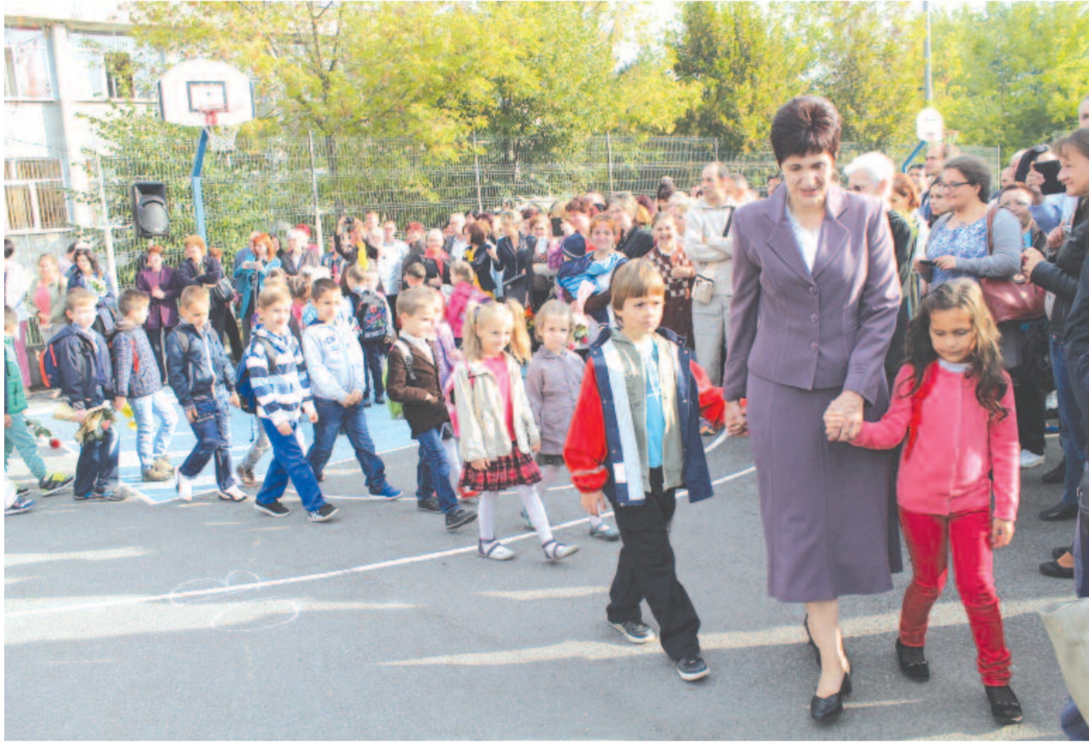
Tavaly még felhőtlen volt az iskolakezdés

Az ősszel előkészítő osztályt kezdő gyermekek beiskolázása idén március 4-én kezdődött, pontosan egy héttel később, 11-én azonban a koronavírus-járvány megfékezése érdekében bezártak a tanintézetek. Az interneten természetesen folytatódott a beiratkozás – ez a lehetőség már évek óta adott –, egyes családok számára azonban ez nem jelent kézzelfogható megoldást.