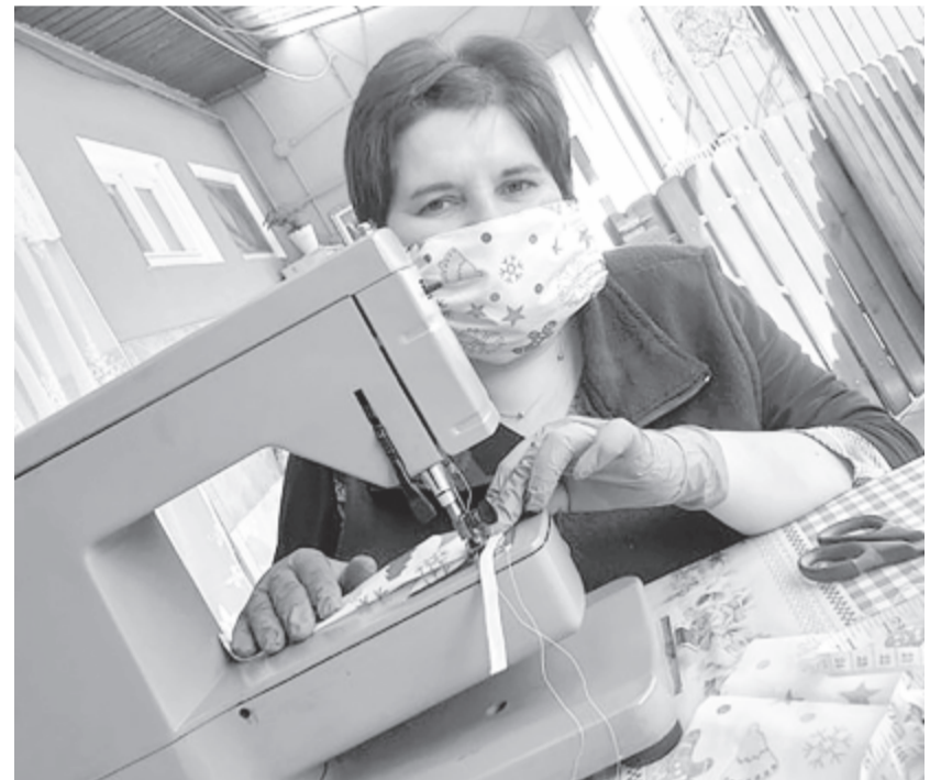
Hat nő varrja szorgosan a maszkokat Kenden

Mivel a hasonló példák még eléggé ritkák, addig, amíg a lakosság számára ismét kapható lesz a védőmaszk, mindenképp érdemes akár házilag is készíteni hasonló darabokat, vagy vásárolni azoktól, akik ilyent varrnak, és néhány lejért, legtöbbször előállítási áron kínálják internetes hirdetésekben, de már üzletekben is. Nem annyira hatásos, mint az orvosi maszk, de mindenképpen egyfajta védelmet nyújt a fertőzés terjedése ellen.