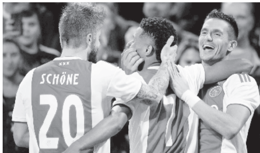
Az Ajax szívesebben vette volna, ha az idény befejeződik a jelenlegi állással

A terv az, hogy a klubok május 15-én térjenek vissza az edzéshez, kezdetben kis csoportokban. Az egész csapat, együtt, május 29-én kezdheti el az edzést. Ha a bajnokság a tervek szerint június 19-én folytatódik, akkor a szezon várhatóan július végére fejeződik be. Ebben az esetben augusztus harmadik hetében kezdődne a 2020–2021-es szezon, amelynek lennének mérkőzései a karácsonyi időszakban is, hogy behozzák a csúszást.