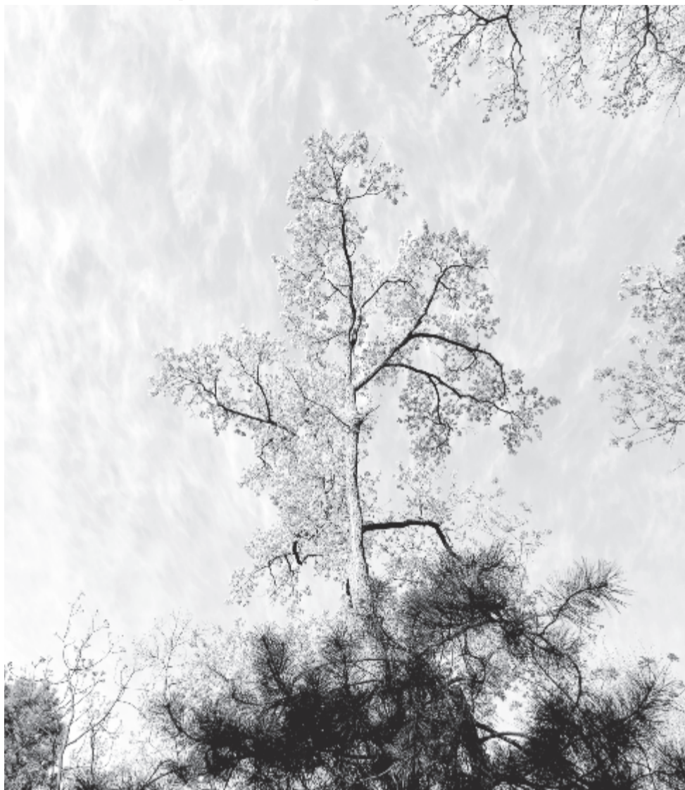
Diana udvarát megint látogatni, ernyős sátoriban mint regvel mulatni

A méhek és a többi beporzó rovar túlélésének hatékony támogatása közös, globális feladat. Mi azt szeretnénk, ha ez a kezdeményezés Magyarországról indulna el. Nálunk