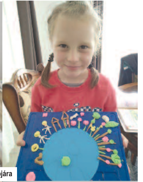
A Föld Napjára