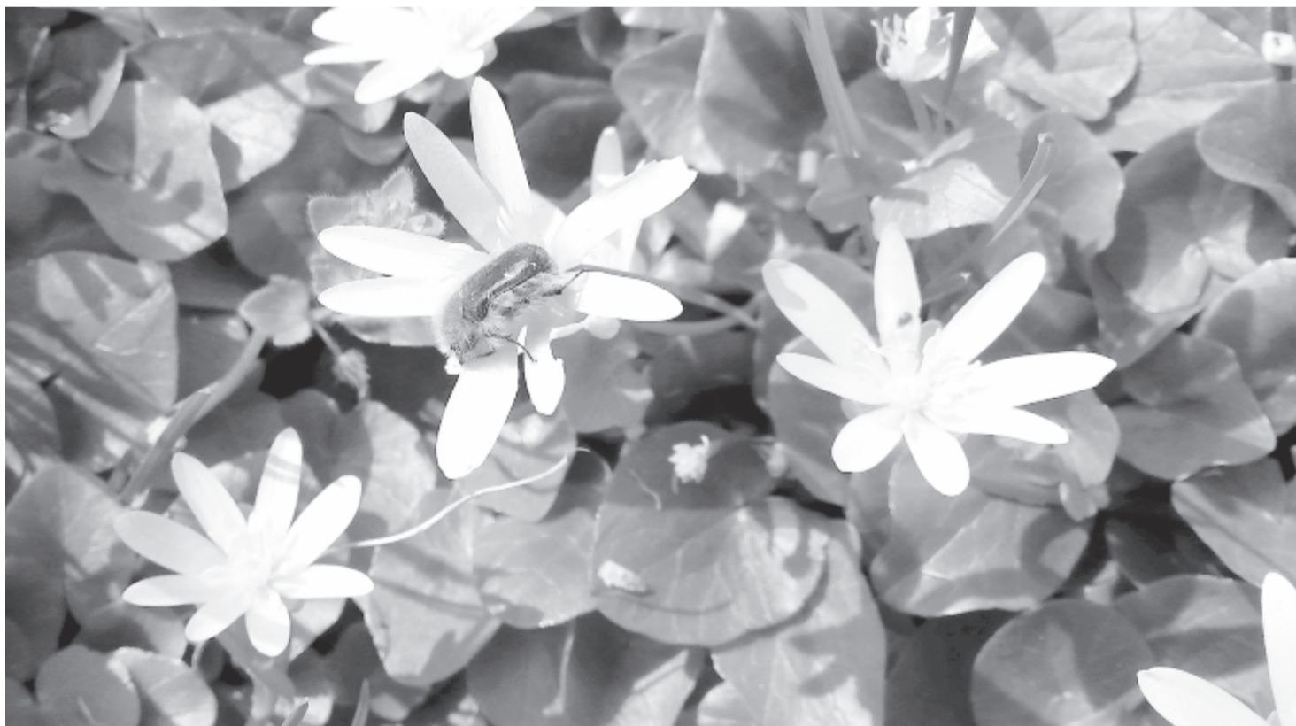
Bundásbogár salátaboglárka-pollent lakmározik