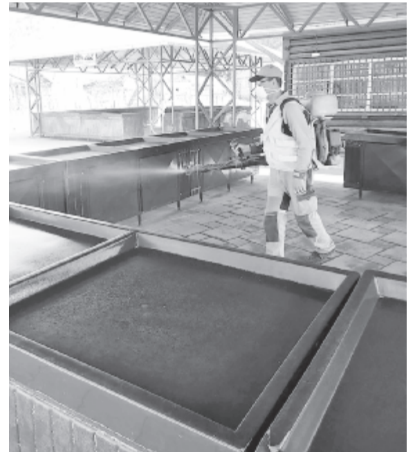
Szováta rendszeresen fertőtlenítették a piacokat, mégis felfüggesztik a működésüket

A szovátaai piacbezárás indoklásából nem derül ki, hogy mely település(ke)n megjelent koronavírus-fertőzésre gondoltak. A Bekecsalján csupán Nyárádmagyaróson bizonyított a fertőzés megjelenése, ahol múlt héten egy idős személy elhunyt, a vele egy háztartásban levő fiánál és unokájánál is kimutatták a fertőzést, ezért a napokban kórházba szállították őket. Olvasói jelzés érkezett arról, hogy néhány helyi személy nem tudott eljutni munkahelyére, mivel a falut lezárták a hatóságok. Ér-