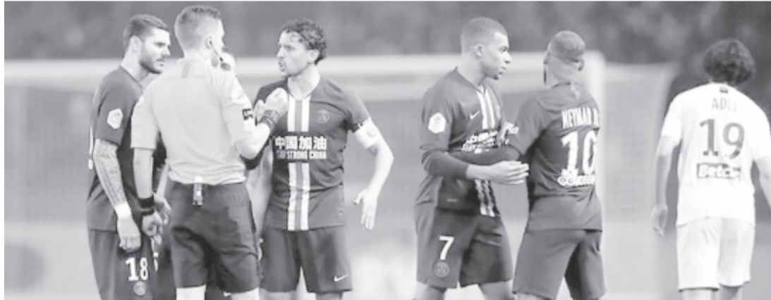
Teljes az értetlenség a 12 pontos előnnyel élvonalas Paris Saint-Germain háza táján: nem tudják elképzelni, hogyan vehetik fel majd a harcot azokkal a csapatokkal, amelyek folytathatják a bajnokságot, és játékban lesznek