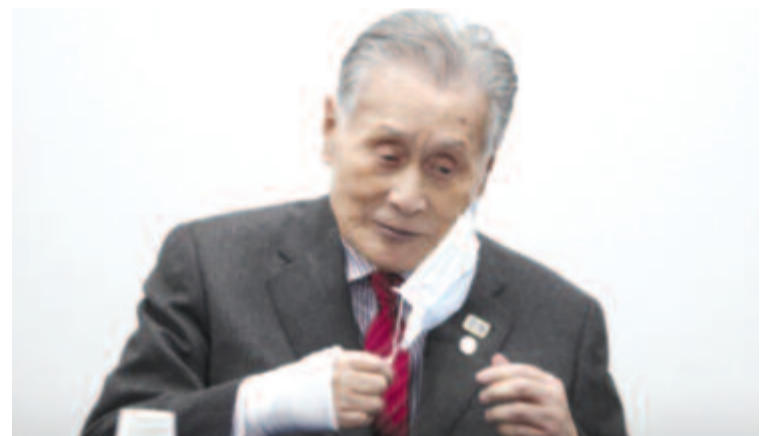
A szervezőbizottság elnöke szerint technikailag nehéz lenne megoldani, hogy csak 2022-ben legyen olimpia.

Az ötkarikás játékokat jövőre július 23. és augusztus 8., a paralimpiát pedig augusztus 24. és szeptember 5. között rendezik meg.