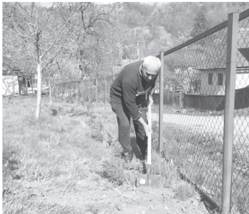
Negyven tujacsemetét és néhány gyümölcsfát ültettek el a templomkertben

Egyedi módon szeretne emlékezni és a következő nemzedékeket is emlékeztetni az idején koronavírus-járványra a székelyabodi közösség: fákat ültettek a templomkertben. Az ötlet Marton