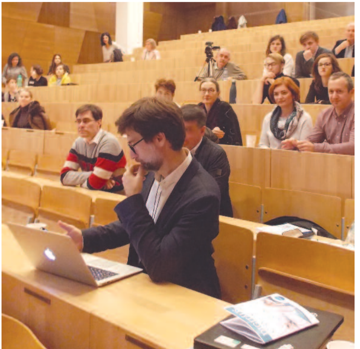
A marosvásárhelyi konferencián

A személyre szabott kezelés eddig elért eredményei figyelemre méltóak. A közeljövőben a kutatások további, célzottan ható, új, modern rákgyógyszerek kifejlesztését teszik lehetővé.