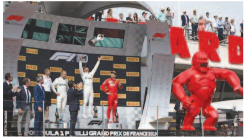
A verseny tavalyi díjazási ünnepségén a futamgyőztes Lewis Hamilton levegőbe dobja a serlegét.

A Nemzetközi Automobil-szövetséget vezető Jean Todt hétfőn azt mondta: bízik abban, hogy még ebben az évben nézők előtt rendezhetnek Forma-1-es futamot. Eközben a nemzetközi sajtó valószínűsíti, hogy ha nyáron tényleg el tud indulni a vb, legalább az első két versenyt zárt kapuk mögött rendezik.