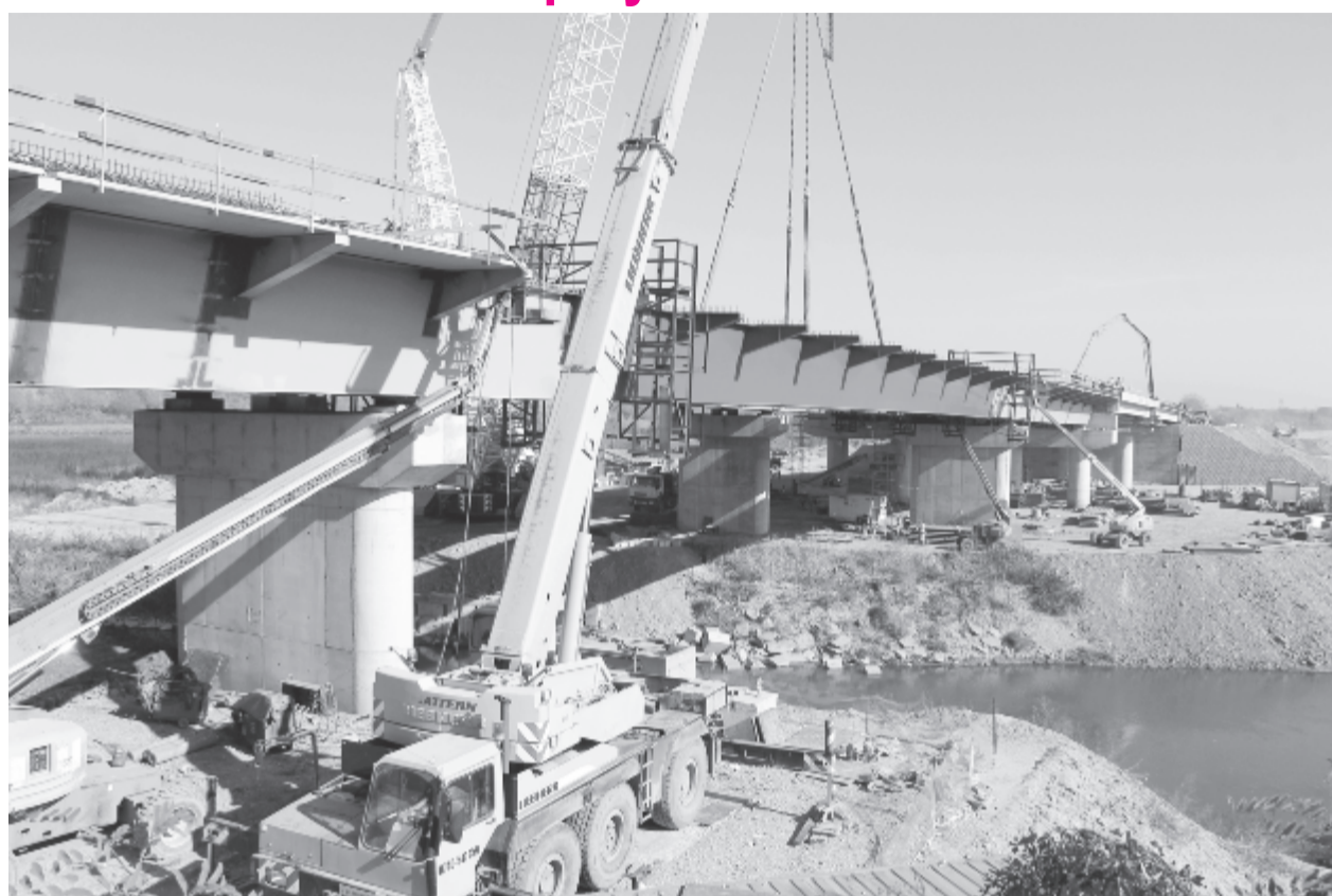
Marosbogátnál az autópálya része lesz a Maroson átívelő hid.

Nagy Tibor felvétele 2019 októberében készült