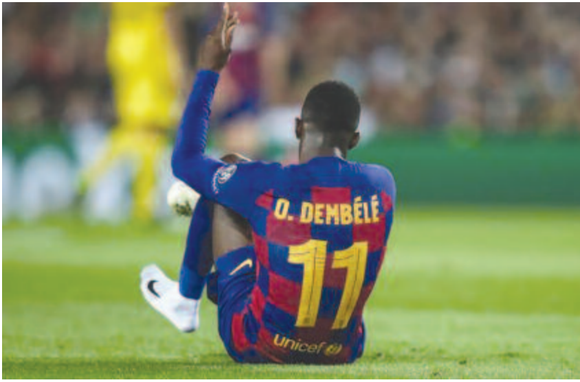
Sérülékenysége miatt sokallják az árát.

A 2017-ben szerződött világbajnok Dembélé helyzete azután vált ingataggyá a Barcánál, hogy az amúgy villámgyors és remekül cselező játékosnál egyik sérülést szinte azonnal követte a másik, többször műtötték, hosszú hónapokra kidőlt, és nem tudott klubja számára huzamosabb időn át hasznossá válni.