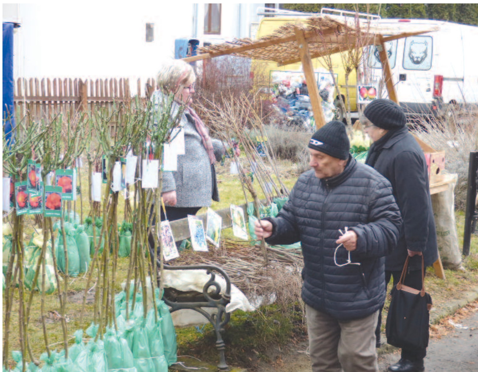
Az egyik legsikeresebb kertészvásár volt a szombati