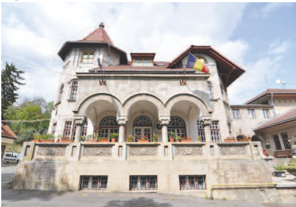
A Marosvásárhelyi Rádió épülete

– Szembeállítva az akkori helyzettel, az akkori körülményekkel, milyen ma a Székelyföld hangja, 62 év után?