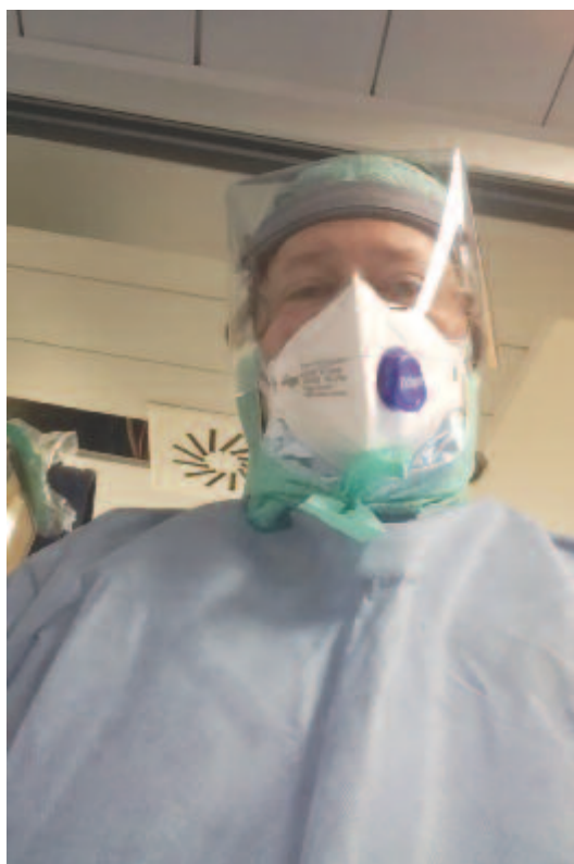
Védőruhában dolgoznak az egészségügyiek

A témára való tekintettel, a megszólaltatottak kérésére az érintettek nevének kezdőbetűit használtuk a riportban.