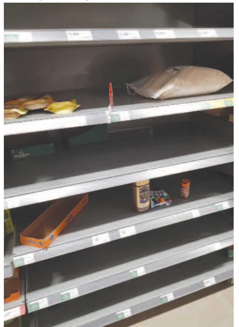
Londonban is kiürültek a polcok