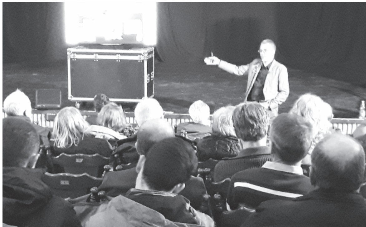
Az előadásokon sok érdekes információ hangzott el

meghatározott mellett egy köztes árat kell találni. Ugyanakkor szeretnék megtanítani a méhészeket a fajtamézokról és a méz gyógyhatásairól is beszélni a vásárlóknak, továbbá pályázatokból tájékoztató anyagokat készítenének, amit osztogatni lehetne a fogyasztóknak. Az alakuló erdélyi egyesület fiatalokat szeretne kijuttatni Szlovéniába tapasztalatszerzésre, hogy az ottani méhészek harmincéves munkájának eredményét szemrevételezzék, hogy itthon is elérhessék azt a szintet – tette hozzá az elnök.