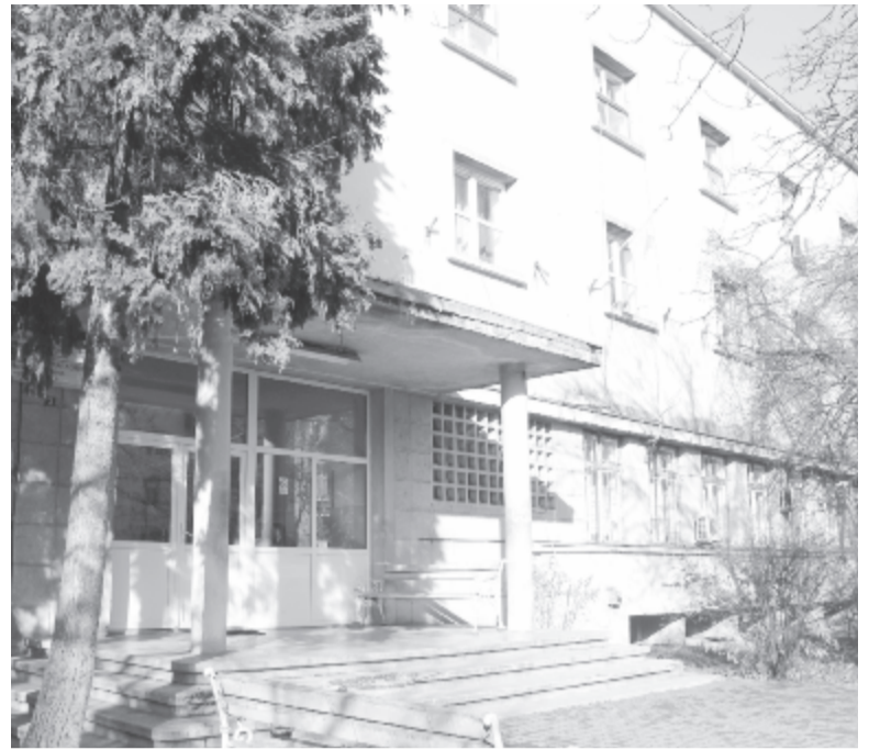
Remélhetőleg, mire a marosvásárhelyi onkológiai klinika bővítése és felújítása elkészül, a betegellátás körülményei is megközelítik a javaslatcsomag előírásait.

A szakértők javaslata szerint Európa-szerte meghonosításra várnak azok a szemléletmódok és bevált egészségügyi-szervezési gyakorlatok, amelyekkel Nyugat-Európában jó eredményeket értek el. Olyan integrált egészségügyi rendszerekre lenne szükség, amelyek szerves egységben képzelik el a járó- és fekvőbeteg-ellátást, illetve általában