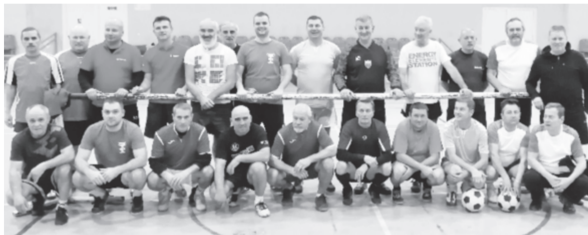
Az első bajnokság mezőnye