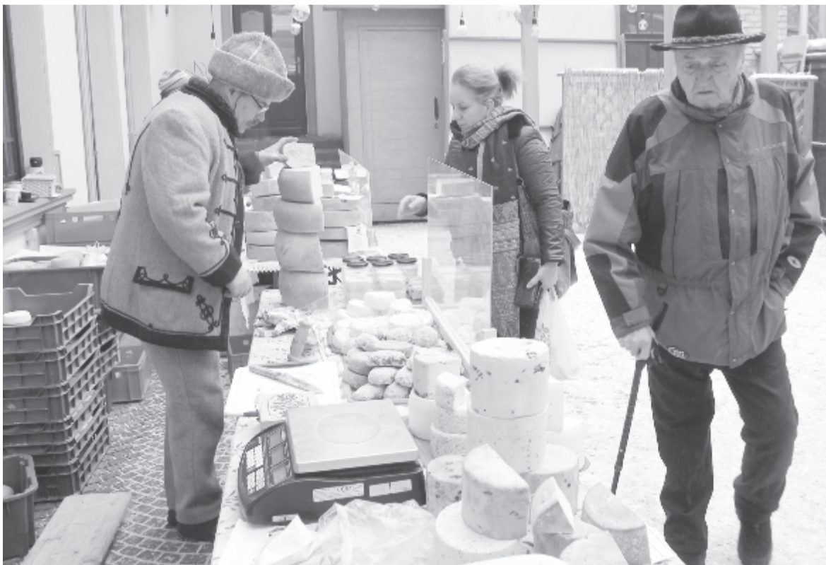
A helyi termékek vásárán

Mint a fogyasztóvédők szerdai közleményükben rámutatnak, a koronavírus-járvány és az emiatt kihirdetett szükségállapot nyomán jelentősen megnőtt a kereslet bizonyos típusú termékek iránt, miközben a kínálat a megszokott keretek között van vagy éppen kisebb. Ezért azt javasolják, hogy szabjanak meg egy maximális árat, így előzve meg a nem korrekt vagy törvénytelen kereskedelmi praktikákat, vagyis a hirtelen drágítást. A szakhatóság ugyanakkor úgy véli, a kiskereskedelmi egységeknek méltányos határt kellene szabniuk, hogy egy bizonyos termékből mekkora mennyiséget vásárolhat egyetlen vásárló, így biztosítva, hogy minden fogyasztó számára elérhetővé váljon az illető termék, és megelőzhetővé váljon a fennakadás az ellátásban. (Mediafax)