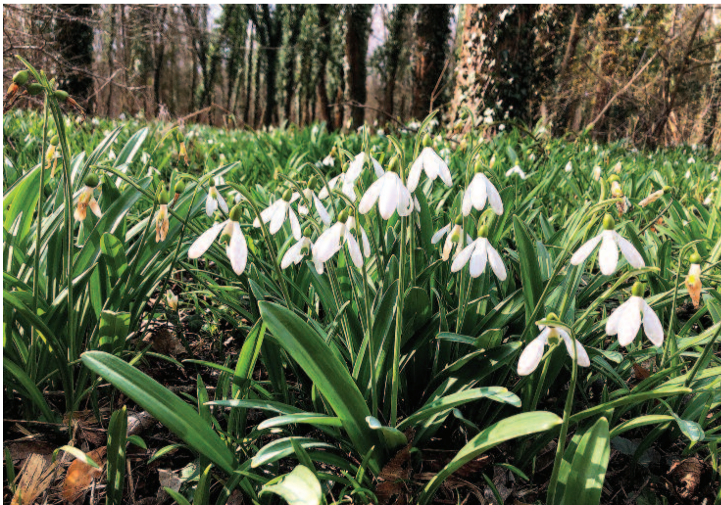
Hóvirághadsereg március idusán

E sorok igazságával búcsúzom ma tőled, kedves Olvasóm. Maradok kiváló tisztelettel. Kelt 2020-ban, két nappal március idusát előzve, holdtölte és utolsó negyed között félidőben