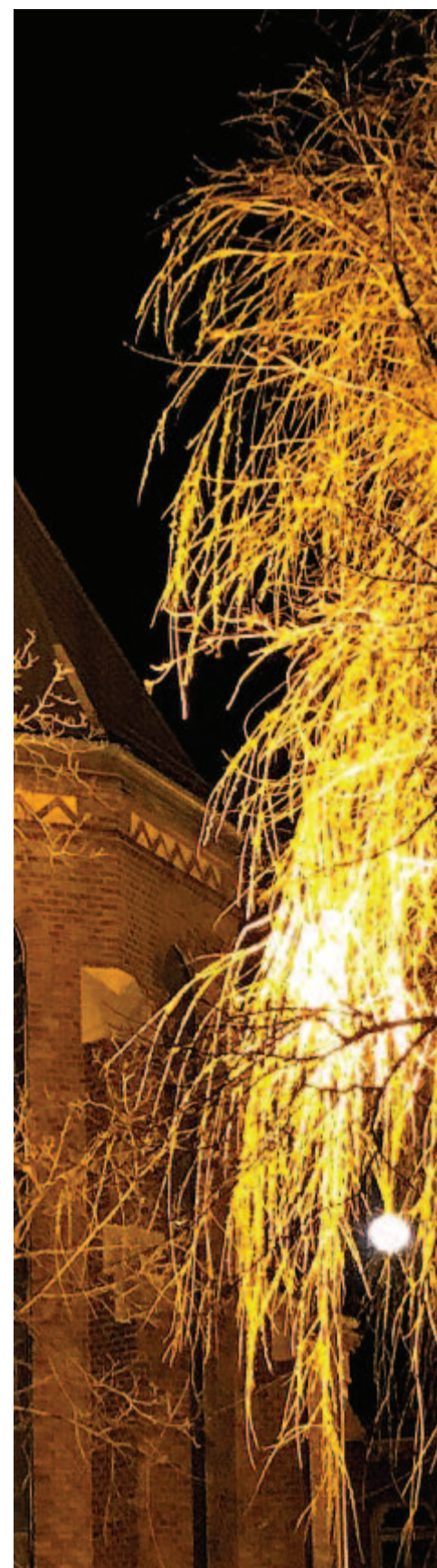
Szökül a fűz

A vizek zabolázhatatlan erejét Petőfi is megénekelte, ő a tengerről beszélt. Wass Albert a Gátakban a folyóvizekről. S nem csupán a vizekről.