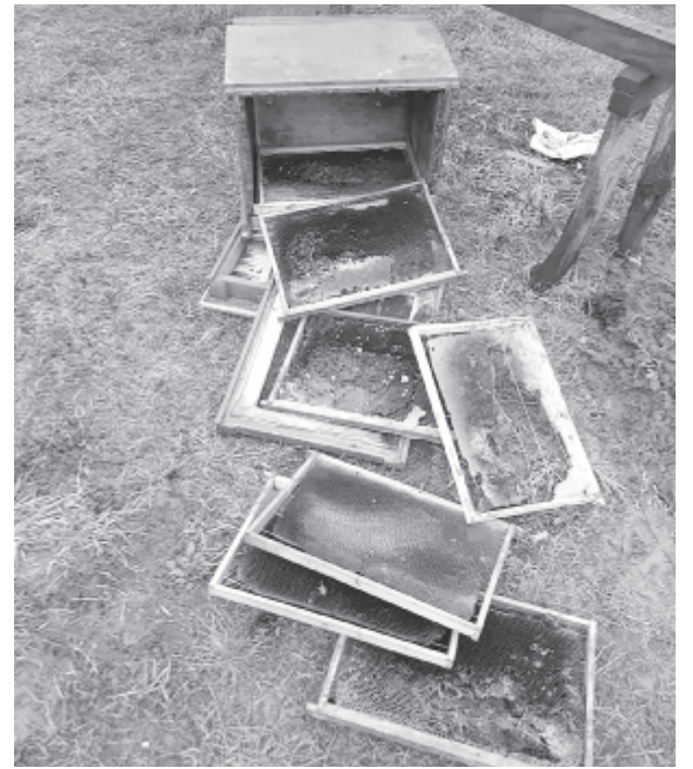
A medvék már nem csak az úton sétálnak, hanem a gazdaságokban is garázdálkodnak

A tél folyamán elhúzódtott medvék mintegy tíz napja jelentek meg a településen, akkor csak messziről észlelték őket a határban és a bodoni erdőben, de a múlt hét vége óta rendszeresen garázdálkodnak. Egy nagyobb példányt a községközpont Székelybós felőli részén észlelték, ez az állat vasárnapra virradóra a falu végén egy új lakás udvarára hatolt be, szétverte a ketreceket, és mintegy tíz dísztyúkot és kacsát falt fel. Másnap éjszaka visszatért, akkor viszont már nem tudott megölni semmit, de ismét randalírozott a gazdaságban. A falu másik oldalán, a bodoni erdőből egy fiatal anyamedve és két jókora bocs kezdett az utóbbi napokban rendszeresen bemerészkedni nemcsak az E60-as főúttig, hanem a faluközpontba is, ahol éjszaka térfelügyelő kamerák vételezték, amint az utcákon sétál. Egy autóval is szembeállt a nőstény, de végül bocsáival együtt elkergették az Új utcában. Nem sokáig iszkolhatott, mert tíz perc múlva már visszatért, és egy gazdaságban ismét mintegy tíz szárnyas esett áldozatul.