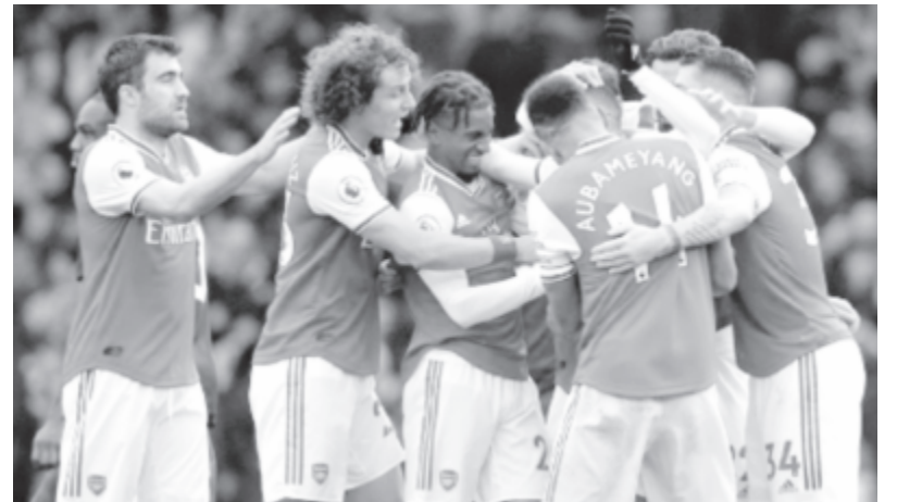
Elhalasztották az angol labdarúgó-bajnokság érvonalában tegnapra kitűzött Manchester City – Arsenal mérkőzést, mert előzőleg a londoni klub több játékos kapcsolata került az Olimpikosz görög csapat tulajdonosával, aki megfertőződött az újfajta koronavírussal. Az Arsenal február végén Londonban játszott az Európa-ligában az Olimpikoszszal, amelynek tulajdonosa az angol csapat több játékosával és stábjtagjával is találkozott. Ez az első mérkőzés a Premier League-ben, amelyet a decemberben Kínából indult koronavírus-járvány miatt nem rendeznek meg.

* Francia Ligue 1, 28. forduló: St. Etienne – Bordeaux 1-1, Dijon – Toulouse 2-1, Metz – Nimes 2-1, Nice – AS Monaco 2-1, Olympique Marseille – Amiens SC 2-2, Lille – Lyon 1-0, Angers – Nantes 2-0, Reims – Brest 1-0, Stade Rennes – Montpellier HSC 5-0. Az élcsoport: 1. Paris St. Germain 68 pont, 2. Olympique Marseille 56, 3. Stade Rennes 50.