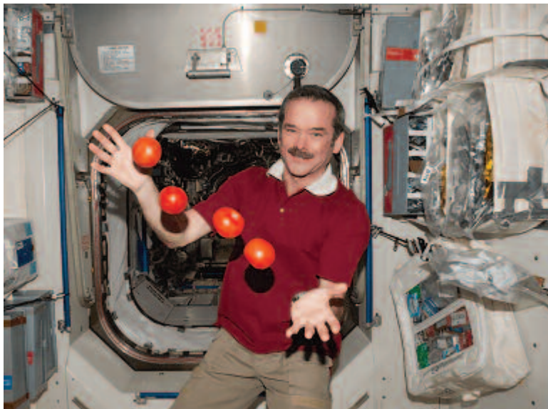
Az űrben könnyű zonglörködni

Társadalmunk betegsége, hogy nem becsüljük kellőképpen a fizikai munkát végző embereket. Egy hibás beidegződés eredménye, hogy csak azok végeznek fizikai munkát, akik nem tudtak tanulni. Jó példa erre a szakiskolák visszaállítására körrüli okoskodások sora – mintha istencsapása lenne bármilyen munka, úgy tekintünk rá. A takarító meg kellene érdemelje a tiszteletet azért, mert az általunk produkált koszt el-tünteti. Az építőmunkás, aki nap-hosszat birkózik a betonnal, a téglával, a tikkasztó meleggél, ő is tiszteletet érdemel, mert végső soron ő váltja valóra azt, amit valaki egy irodában lerajzolt. A szobafestő, aki saját ízlésünk szerint teszi széppé a lakásunkat, nem lehet lekezelendő munkás. Ugyanígy megnyilvánulásainkkal egyetlen emberbe sem rúghatunk bele, mert „ezért fizetik”. Vagy az engem ért sérelmen csak úgy tudok elégtételt venni, ha tisztességtelenül bánok egy másik emberrel? „Munkánk során hazánk minden lakosát képvi-