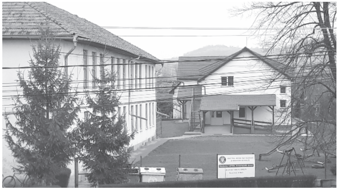
Szerdán már üresek voltak az iskola- és óvodaudvarok. Mi lesz, ha a kényszerszünetet is meghosszabbítják?