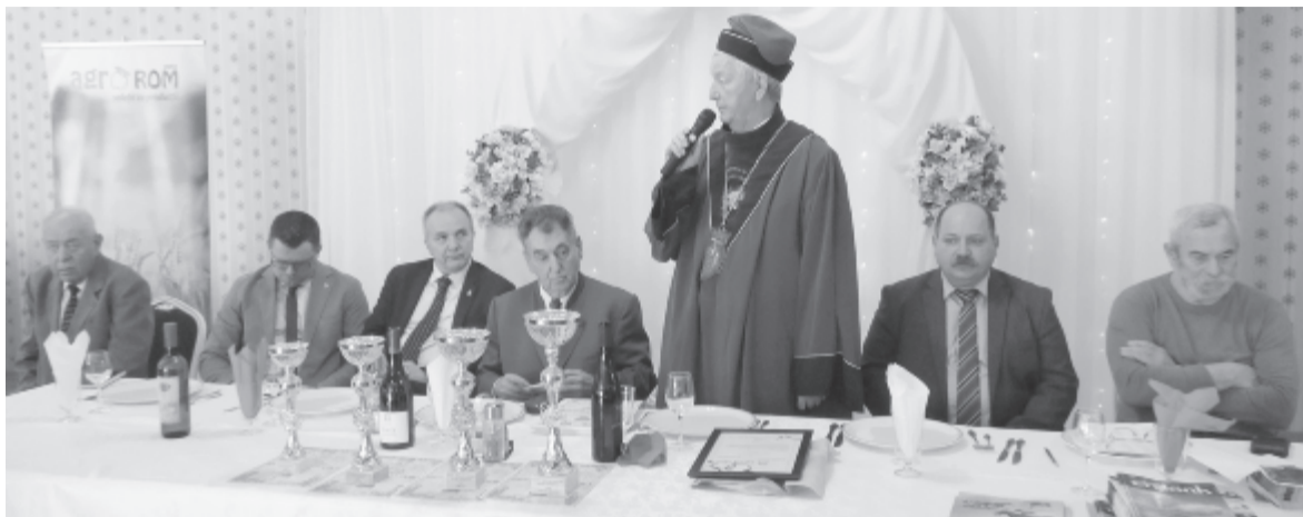
A szakemberek szerint a világ bármely versenyén megállnák a helyüket az itt bemutatott borok