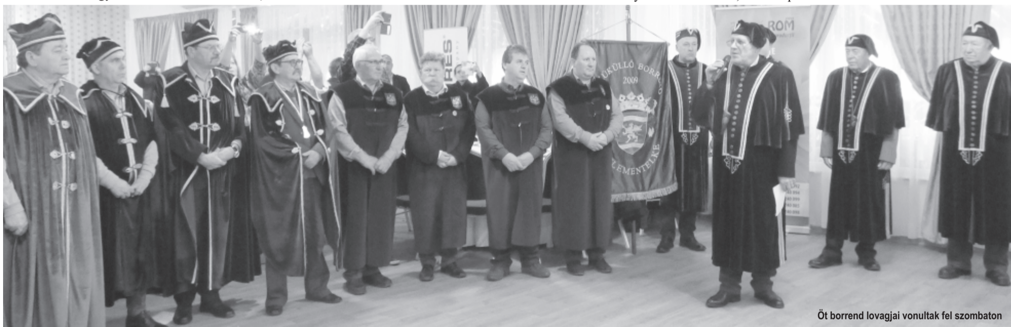
Öt borrend lovagjai vonultak fel szombaton