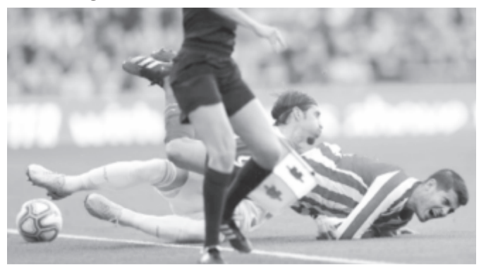
lzmósrülést szenvedett a jobb lábán Alvaro Morata, az Atlético Madrid labdarúgója. A 27 éves támadót a Real Madrid elleni, szombati rangadó 50. percében le kellett cserélni. Helyére Thomas Lemar állt be, csapata 1-0-ra elvesztette a mérkőzést. Az Atlético Madrid részéről nem közölték, mikorra várható a válogatott futballista visszatérése, de a hét végi bajnoki forduló minden bizonnyal kihagyja

* Francia Ligue 1, 22. forduló: Dijon – Brest 3-0, Metz – St. Etienne 3-1, Bordeaux – Olympique Marseille 0-0, Nice – Lyon 2-1, Nimes – AS Monaco 3-1, Paris St. Germain – Montpellier HSC 5-0, Strasbourg – Lille 1-2, Amiens SC – Toulouse 0-0, Angers – Reims 1-4, Stade Rennes – Nantes 3-2; 23. forduló: AS Monaco – Angers 1-0, Nantes – Paris St. Germain 1-2, Lille – Stade Rennes 1-0. Az élcsoport: 1. Paris St. Germain 58 pont, 2. Olympique Marseille 43, 3. Stade Rennes 40.