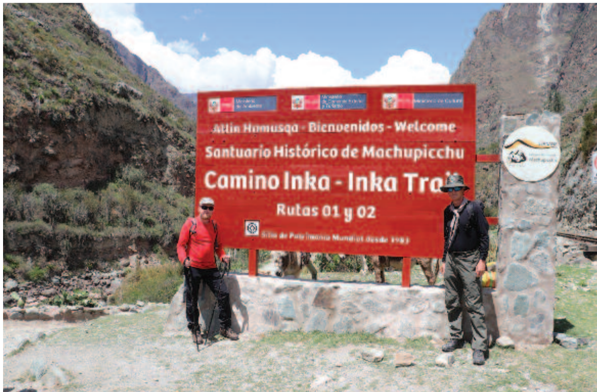
Az Inka ösvény bejáratánál