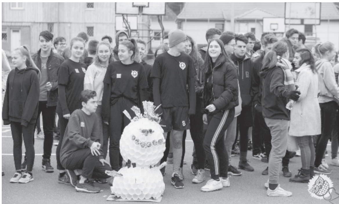
A bobszalom résztvevői

– Nagyságrendileg mennyi pénz kellett ehhez az eseményhez?