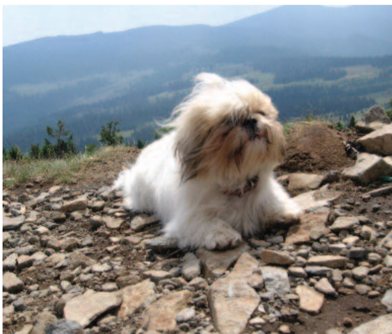
Kucika a Hargitán

A törvényhozók szerint a különleges fizikai jellemzők mögött állatkínzés húzódik meg, ugyanis az állatnak születésétől élete végéig nehézségeket kell leküzdenie. A mopsz például azt, hogy nem jut rendszeresen levegőhöz. Az úgynevezett genetikailag szelektált állatok iránt az utóbbi években megnőtt a kereslet, épp a megszokottól eltérő tulajdonságaik miatt, annak ellenére, hogy gondozásuk nagyobb költséggel jár. A tervezet listáján a mopszon kívül az angol és francia buldog, a skót lekonyuló fülű, valamint a munchkin macska is szerepel. Utóbbiak szintén amiatt, mert valamilyen genetikai problémájukból adódóan nem élnek túl egészséges életet, legalábbis a törvényhozók szerint. A törvényter-