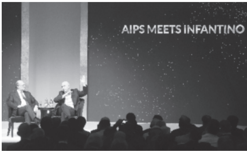
Gianni Merlo, a Nemzetközi Sportújságíró-szövetség (AIPS) elnökének (b) és Gianni Infantino, a Nemzetközi Labdarúgó-szövetség (FIFA) elnökének pódiumbeszélgetése az AIPS budapesti kongresszusán a Corinthia hotelben 2020. február 3-án

Kiemelte, az előző világbajnokság negyedöntőjében hat európai és két dél-amerikai csapat szerepelt, ám ezen szeretnének változtatni. „Olyan tornákat szeretnénk szervezni, amelyekben mindenkinek jut sikerélmény, ahol mindenki tud fejlődni, mert most a különbség folyamatosan nő az európaiak és a világ többi része között” – fogalmazott a sportdiplomata. Az a vágya – mondta –, hogy legalább tizenöt ország válogatottja esélyes legyen a világbajnoki aranyéremre, és legyen ötven olyan kiváló klubcsapat, amely egy szinten van. „Ebből persze legalább húsz