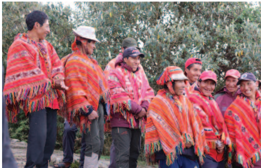
Kecsua indiánok csoportja

a csapattal életem egyik legszebb kalandjának, az Inka ösvény meghódításának. Mert az inkák nem csak az épületek, hanem az utak építésének is nagymesterei voltak. Virágkorában az Inka Birodalom Bolíviától Chile déli részéig tartott, és sikerének egyik titka éppen abban rejlett, hogy több tízezer kilométernyi úthálózatot hoztak létre. Ezeken az utakon gyorsan eljuthattak a birodalom legtávolabbi részéig, futárok segítségével könnyebben terjeszthették a híreket, a parancsokat, könnyebben mozgósíthatták a katonákat is. Nocsak, hát egy olyan prekolumbián kultúrában is fontosnak tartották az utak építését, amelyben még a kereket sem ismerték! Akkor – elmélkedtem – hazánk kétezer éves kultúrája kései sarjainak miért nem első rangú fontosságú az utak és autópályák építése a gyorsaság századában? Na, de ezen nem érdemes tépelődni, inkább annak örvendtem, hogy mi kerék nélkül kapaszkodhattunk az inka utak egyik leghíresebb és leglátványosabb szakaszán.