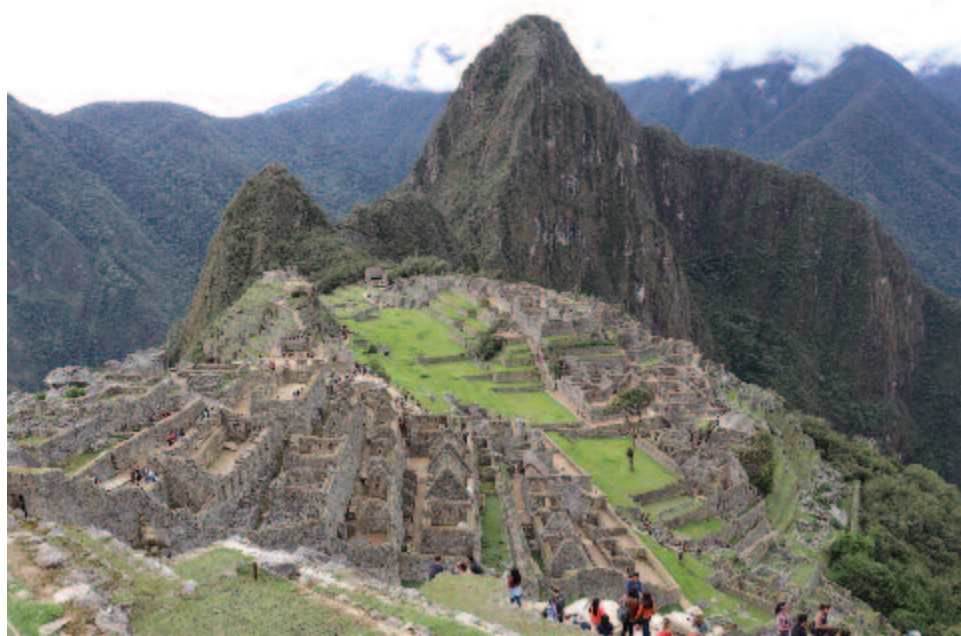
A Machu Picchu (Öreg csúcs) és háttérben a Huayna Picchu (Fiatal csúcs)