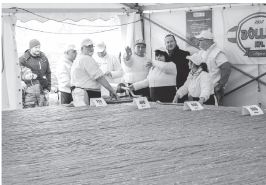
Az idén 2732 méteres kolbászszállal állították fel új világrekordot

A hagyományörzés céljával indított gasztronómiai rendezvényen pálinka-, pogácsasütő és disznótoros ételek versenye is zajlik. Az idén öt saját nevelésű disznót szánt erre az önkormányzat: a leölt és feldar-