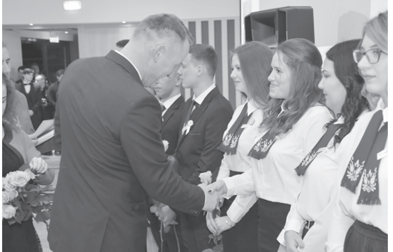
A végzős osztályok diákjait az iskola és a város vezetői köszöntötték