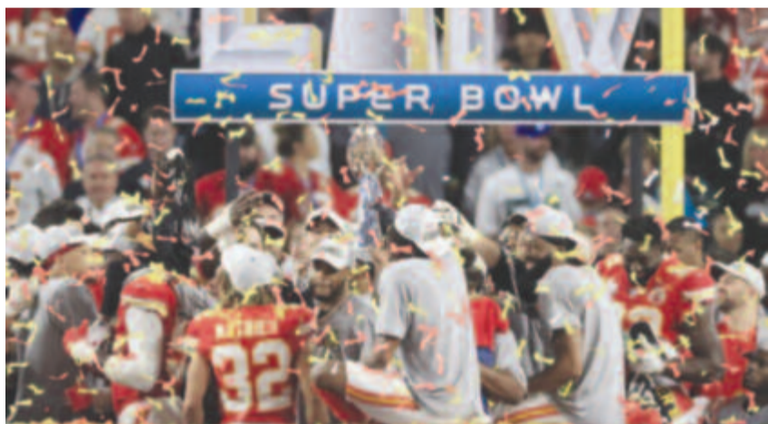
A Kansas City Chiefs játékosai a Vince Lombardi Tróféával az 54. Super Bowl után

A Miamiában rendezett összecsapáson az Amerikai Főcsoport (AFC) bajnoka 31-20-ra győzte le a Nemzeti Főcsoport (NFC) legjobbját, a San Francisco 49ers együttesét. A Kansas City története második bajnoki címét szerezte, 1970 után, azaz ötven év elteltével ért újra a csúcsra.