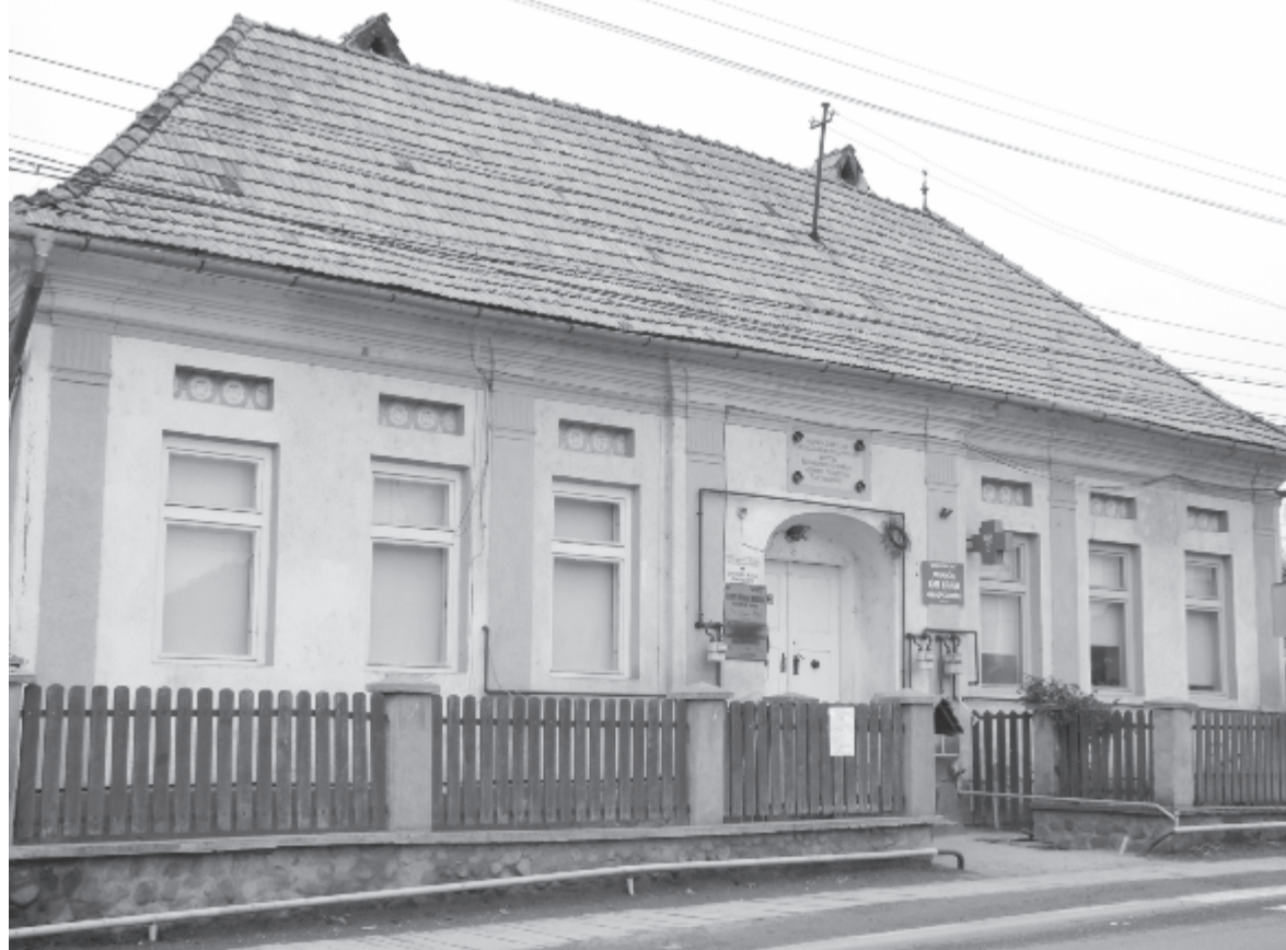
A hányatott sorsú Wesselényi-iskola a székely nemzet szellemi felemelkedéséért épült