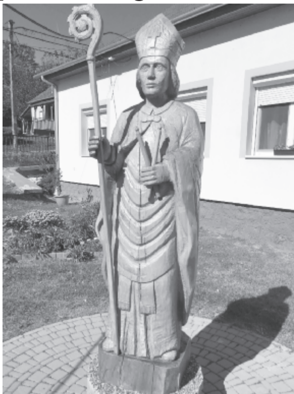
Zalazentbalázs évadó szobra

A harmadik században élt Szent Balázst – aki orvos és püspök volt – legendái alapján mindenfajta torokbetegség gyógyítójának tartották. Innen ered az a február 3-ai szokás, hogy a pap a gyermek álla alá két gyertyát tett keresztbe, és imát mondott. Ez a Balázsolás vagy balázsolás. Almát is szenteltek ilyenkor, hogy torokfájás elleni gyógyszer váljék belőle. A Dunántúlon, az Ipoly és Nyitra környéki falvakban, a Csallóközben szokás volt a Balázs-járás. Maskarába öltözött gyermekcsoportok jártak házról házra. Egyikük Balázs püspököt személyesítette meg – fején papírsüveggel, a többiek papírcsákó volt, oldalukon pedig fakard. Nyársat is vittek magukkal, hogy a háziak arra tűzhessék adományait: a kolbászt és a szalonnát. A Balázs-járás, akárcsak a március 12-i Gergely-járás, a soványpenzü tanítók jövedelem-kiegészítését jelentette, amit gyakran díjlevelükbe is belefoglaltak. A háziaktól kapott ételeket, a babot, zsírt, szalonnát, tojást a gyerekek elvitték a tanítóknak, akik azután megvendégelték őket. A színjátékszerű formák-