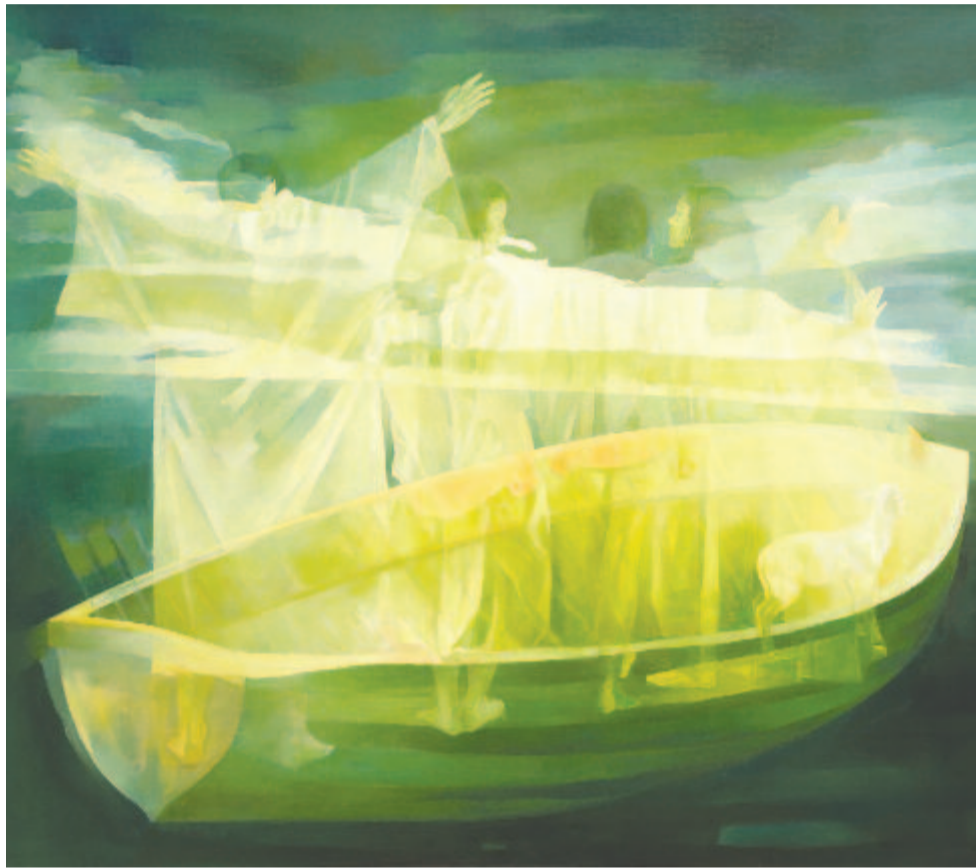
Xantus Géza: Bárka

szintű művészi kiteljesedését tükrözi. Xantus újabb dimenziót tár a nézők elé, egy láthatatlant, mégis létezőt. Festményein mint álombeli vízióban, kissé valószerűtlenül, mégis magától adódó természetességgel tevődik egymásra, fonódik össze, olvad eggyé a reális és a virtuális világ, válik jelenné a múlt, örök érvényűvé az éppen megélt pillanat. A lélek, a szellem, az emlékezés festői dimenziója ez a varázslatosan kiteljesedett, áttűnő látványvilág, ahol a hajdanvoltak – néma árnyéklényként, de jól érzékelhetőn – együtt élnek, lélegeznek a maiakkal, és minden bi-