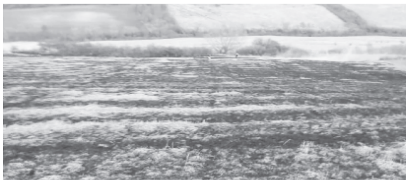
Mintegy negyvenhektáros területet perzselte fel a tűz szerdán Nyomát határában