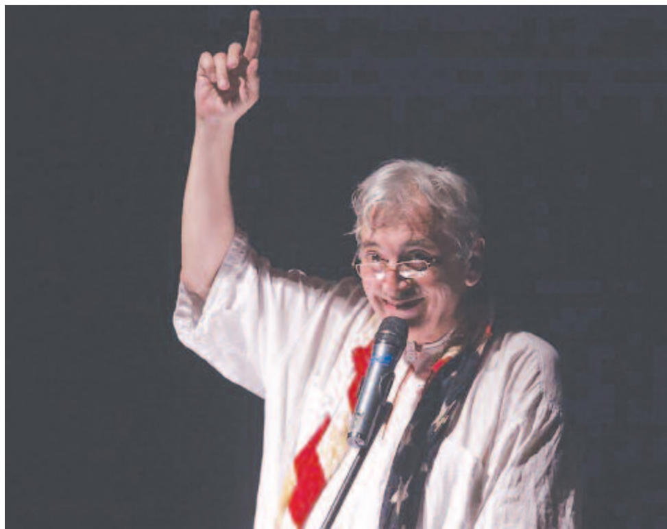
Színházi pódiumon a költő