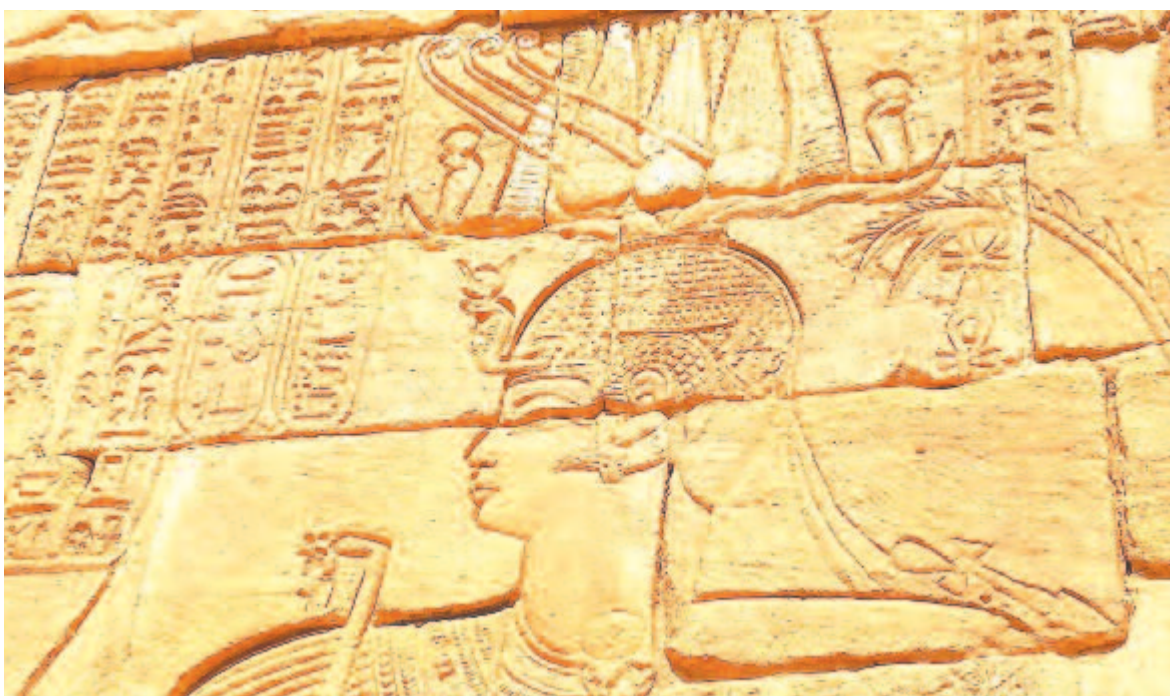
A fáraó portréja

A Kerma-kor virágzásának az Új-birodalom fáraóinak hódítása vetett véget, akik i. e. 1550-től fo-