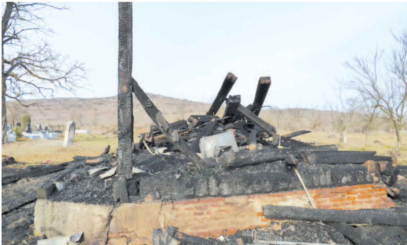
Csak üszkös gerendák maradtak a falu jelképének számító építményből