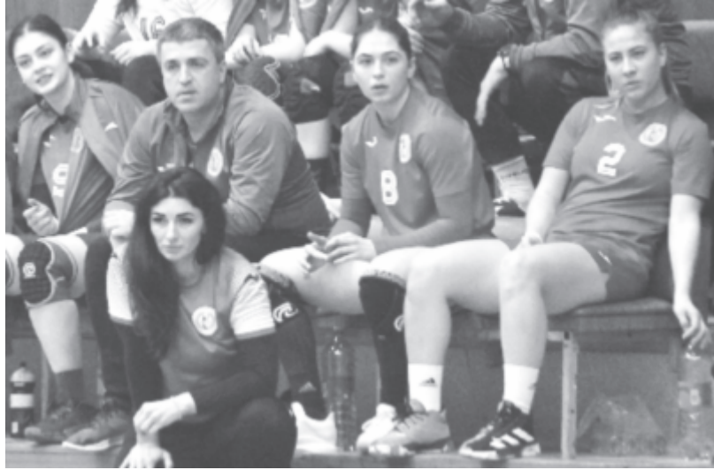
Meglepo döntéseket hozott a marosvásárhelyi kispad, a vereségben ezek is szerepet játszottak

Ennek ellenére a házigazda csapatnak jó esélye lett volna a győzelemre, ha kicsit jobban összpontosít a kulcsmomentumokban. Azonban mindkét félidő azonos időszakában (a 17. és 26. perc között) elfelejtettek gólt dobni Mihaela Evi tanítványai. Dicsérhetjük