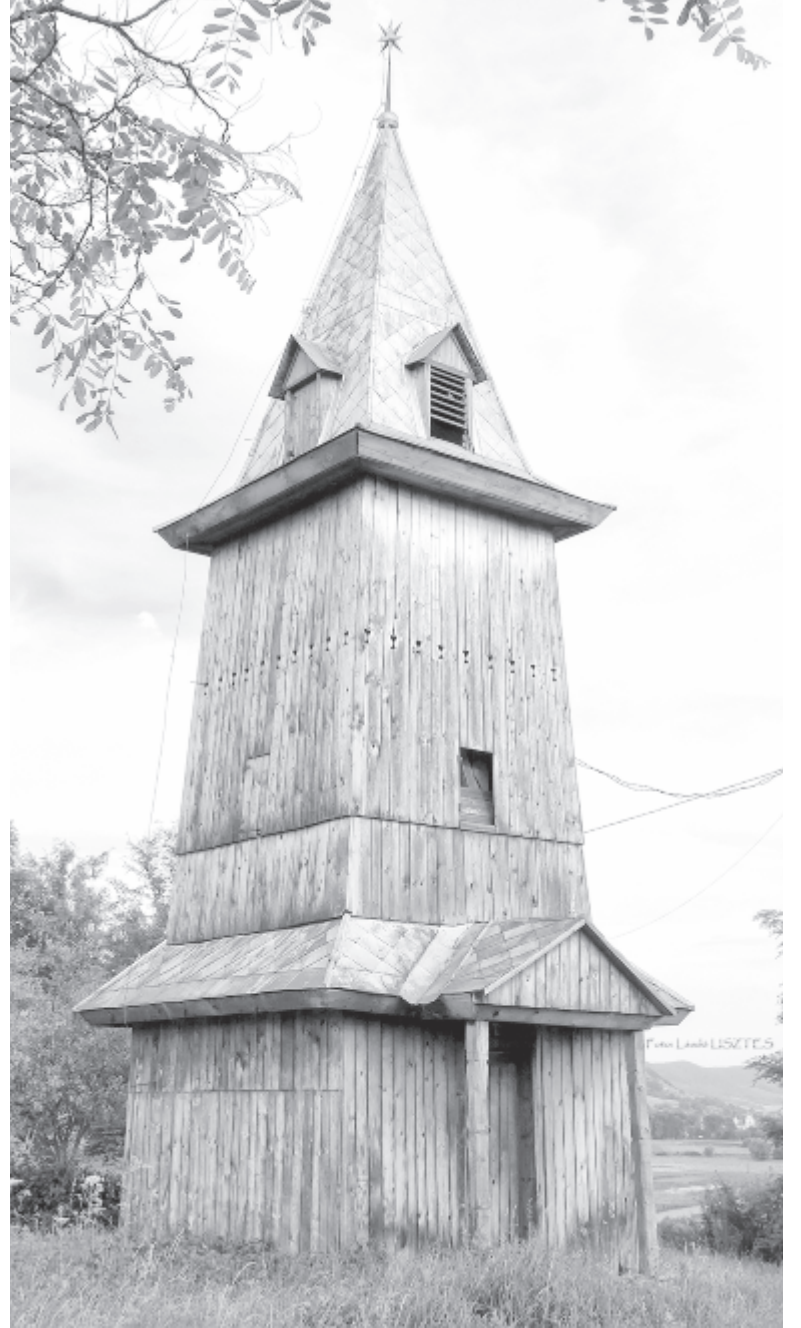
Igy nézett ki a harangláb