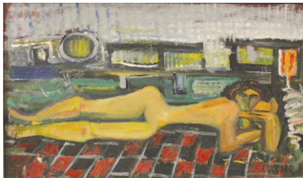
Akt kockás pléden

példája ennek Kedei Zoltán. De a sors másképp intézte. Noha már 43 éve eltávozott, Kulcsár Béla örök fiatal maradt. És nem csak azért, mert 47 évesen hunyt el. Nagyon sokan azok közül, akik itt vagyunk, tanúi lehetünk a munkásságának, a marosvásárhelyi művészeti élet hatvanas-hetvenes-nyolcvanas évekbeli felfutásának, és tudjuk, hogy egy 47 éves ember milyen fiatal. Ám az ő munkái őrzik is azt a fiatalos szellemet, amely az egész pályáját jellemezte. Bárme-lyik alkotását nézzük, elsősorban a szobrokat, de a festményeket is, mindenütt azt látjuk, hogy az újítás, a kísérletezés, a modernség híve volt, és úgy igyekezett a gyökerekhez, a szülőföldi témákhoz nyúl- ni, hogy közben európaiként a világ modern művészeteire tekintett. Bob József, a tárlat kurátora nagyon érdekesen helyezte el a munkákat, megtalálta a módját, hogy miként hozza közös nevezőre ezeket az alkotásokat – mind modern szobrokat látunk, holott a szocreál korszakban a művészek nagyon ne-