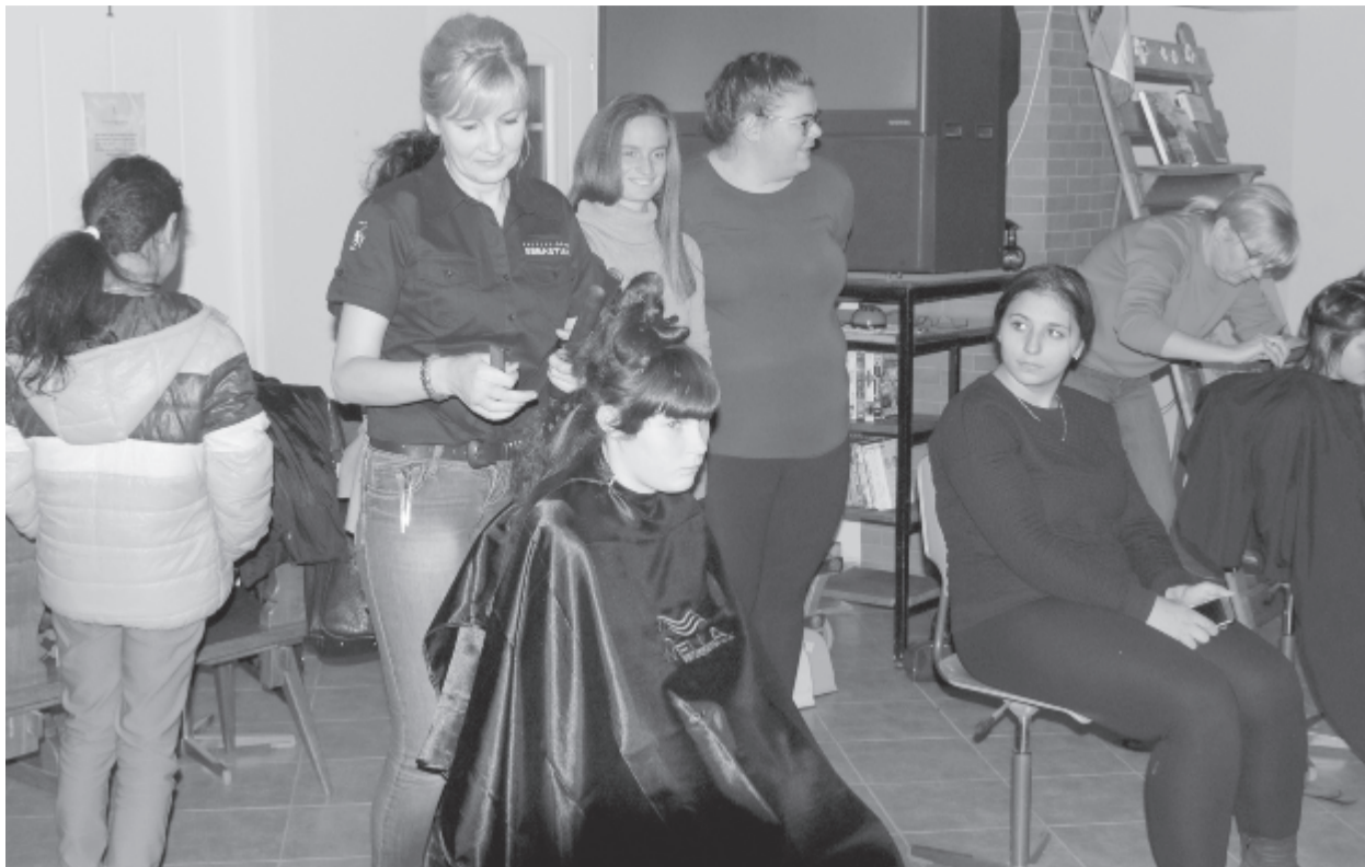
Szívesen dolgoztak a fodrásznők, a gyerekek is örültek az új frizuráknak

A hét folyamán több adventi jótegyokonyági megmozdulást is szerveztek Szovátán a rászorulóknak érdekében.