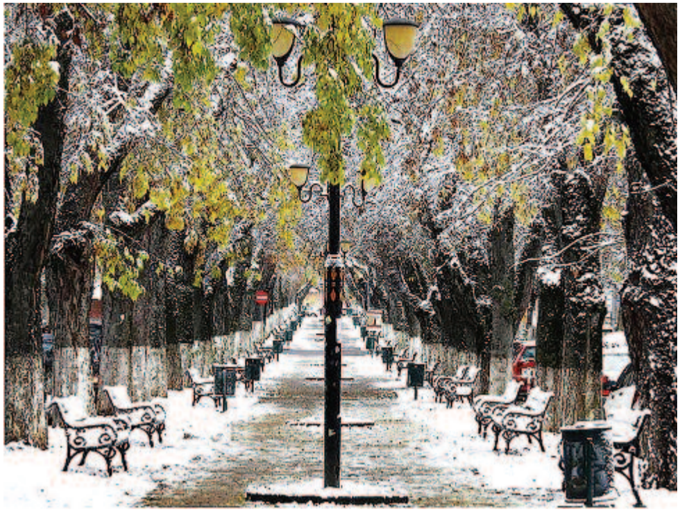
A csönd halkán dalol – a Bulevárd 2017 decemberében

A csönd halkán dalol. December bús szele Alszik ma valahol.