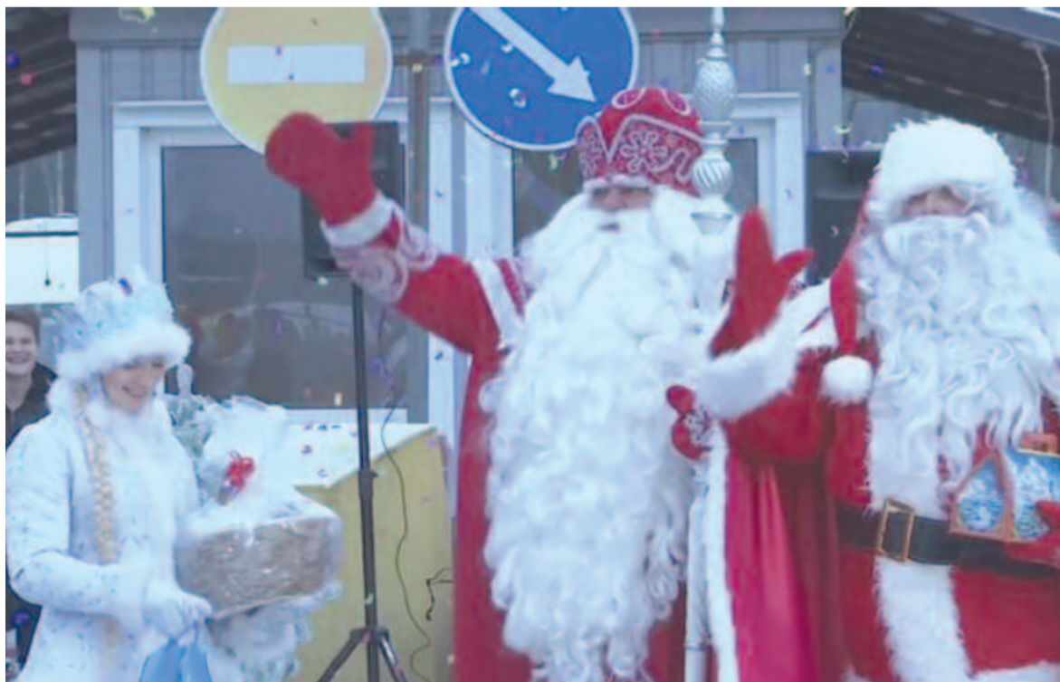
Finn és orosz Mikulás ajándékosztás közben

ügyet, és szabadon bocsátotta a vádlottakat.