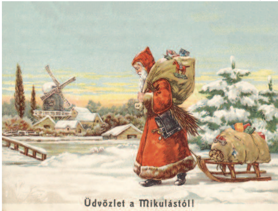
Üdvözlő a Mikulástól

Múlt század eleji, Mikulás-képeslap