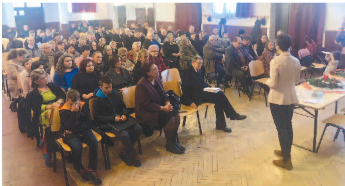
Meglepően szép számban jelentek meg a helyiek az ünnepségen