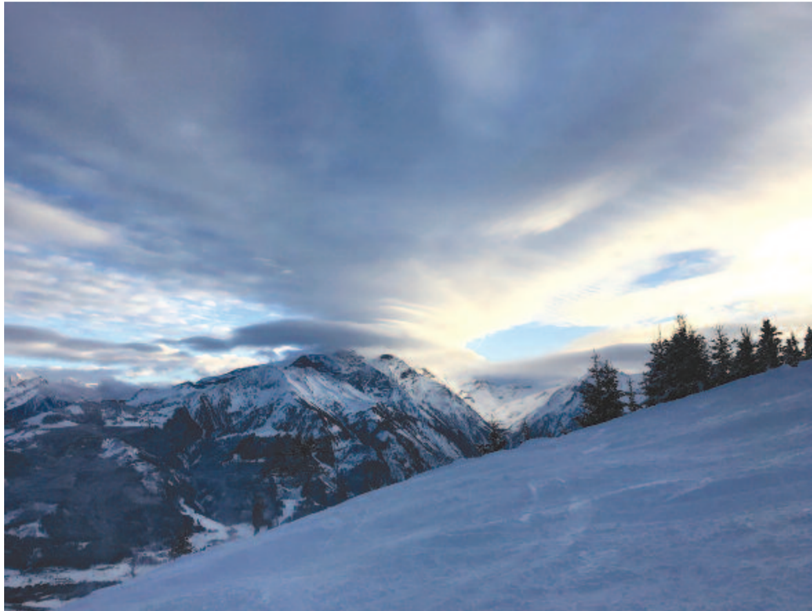
Nem én robotgam, a tél rohant felém

JÓZAN MIKLÓS (Torda, 1869. dec. 6. – Tordatúr, 1946. jan. 7.): unitárius püspök, egyházi író. Kolozsvárott végezte a teológiát, utána az oxfordi egyetemen bölcsészetet és filológiát hallgatott. 1896-ban Torockón, 1899-ben Bp.-en unitárius lelkes. 1920-ban püspöki vikáriussá választották. 1922-ben megalapította és hosszú időn át szerkesztette az Unitárius Értésítőt. Az erdélyi unitárius egyházak közügyi igazgatója volt. 1927-ben a felsőház tagja lett. 1941-46-ban unitárius püspök Kolozsvár székhellyel. Írt költeményeket, foglalkozott zeneszerzéssel és műfordítással is.