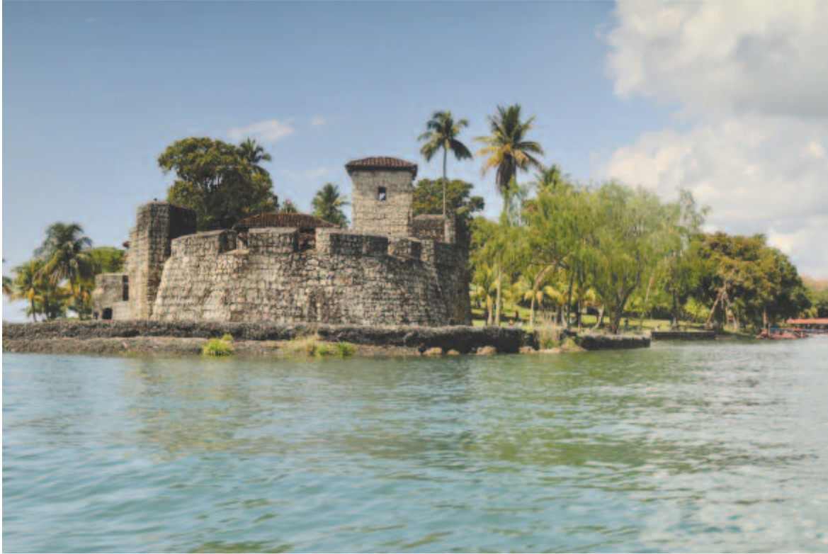
A San Felipe-erődítmény

Reggel, amikor kinézek a balkonra, látom: vendégünk – vagy potyautasunk – van. Egy madárka ül a széken, és várja, hogy kikössünk, hogy kevesebbet kelljen repülnie. A kikötő tele van konténerekkel, de nagy mozgás nincs, lehet, mert vasárnap van. Buszunk már vár, úti célunk, a Rio Dolce legalább egyórai út. Útikalauzunk jól beszél angolul, és érti is a dolgát. Ha nem is a legszebb, de legalább valósnak tűnő sztorit mesél Guatemaláról. Szegény ország, ezt megállapítottuk 2-3 éve, mikor a nyugati parton – Porto Quetzal, Antigua – jártunk. Ahogy haladunk, egy-egy ház tűnik fel, nagy részük szerény, igénytelen. Deszkából és hullámlemezről épültek, s a háztáj s a tisztaság hagy kívánnivalót maga után. A táj szubtrópusi, pálma meg sok ismer-