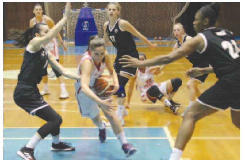
Egyedülként a női kosárlabdázók szerepelnek élvonalban ebben az idényben