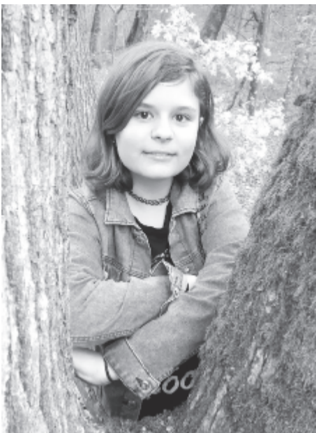
Álma, hogy verseskötete jelenjen meg.

Az iskolában kitűnő tanuló, köteleseit komolyan veszi. Tevékenységeiben nagyon sok segítséget kap tanáraitól, osztályfőnökétől, barátaitól és szüleitől.