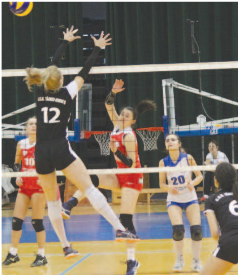
A női röplabdacsapat visszatért az anyaklubhoz, és CSU Medicina néven a másodosztályban folytatta

Hogy a városi támogatás megmaradjon, 2017 őszén az RMDSZ néhány tanácsosa városi sportklub létrehozását javasolta, és ezt a tanács meg is szavazta. A bürokrácia miatt a szervezet létrehozása 2018 nyarára fejeződött be, és a struktúra mindjárt a szárnya alá gyűjtötte a városban működő összes csapatot, sőt újakat is, mint például a vízilabda, tejjel-mézrel folyó kánaánt ígérve. Többen már akkor megfogalmazták az aggodalmukat, hogy a város nem fogja tudni valamennyi szakosztály működését magas szinten biztosítani, azonban ezeket a figyelmeztetéseket nem