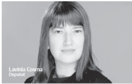
Lavinia Cosma Deputat

Együttműködve megváltoztathatjuk Romániát.