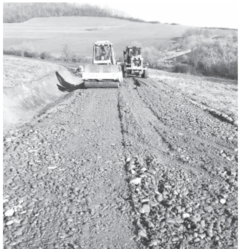
Javában zajlanak az előkészítő földmunkák

nitrittel való szennyezésének megakadályozása érdekében ki-ki a saját gazdaságában betonlizzalattal, -fallal és -medencével ellátott tárolót építsen, és ott raktározza az istállótrágyát. A terv szerint azonban a gazdák közösségi trágyatárolót fognak használni, amit egyébként megenged a törvény: ide szállítják