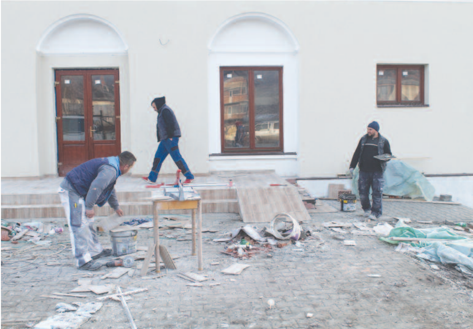
Makfalvi összeállításunk a 6. oldalon