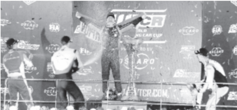
A WTCR által közzétett fotón Michelisz Norbert, a Hyundai versenyzője ünnepel a bajnoki tróféával a túraautó-világkupa (WTCR) idenyzáró malajziai futama után a sebangi pályán 2019. december 15-én. A 34 éves versenyző 370 ponttal megnyerte a szezon. Michelisz a versenysorozat első magyar bajnoka. Fotó: MTI/WTCR/DPPI Media/Florent Gooden

„Egészen hihetetlen, hogy megcsináltuk, pedig ez a malajziai záró hétvége nagyon trükkös volt a három futammal, a változó időjárási körülményekkel, és mindennel, ami a pályán történt – nyilatkozta a verseny után a WTCR új bajnoka, Michelisz Norbert. – Ez a siker a csapaté, a családomé, a barátaimé és az összes magyar szurkolóé, aki az elmúlt több mint tíz évben mögöttem állt.”