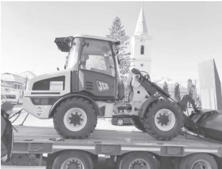
A kis géppark első eszköze már meg is érkezett Szeredába

A terv szerint a Kerekérdő és a víztározó tartályok közelében, a székelytompai legelő aljában épül meg a mintegy 800 négyzetméter alapfelületű fedetlen tároló 2 méter magas falakkal. Az építkezés mellett egy, a kezeléshez szükséges kis géppark kialakítását is támogatja a projekt, így rendelkeznünk fognak majd új traktorral, pótkocsival, a trágyatömeg mozgatását szolgáló rakodógéppel, trágyaszóróval, vala-