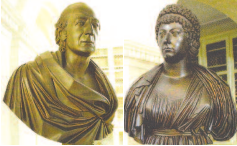
Teleki Sámuel és Bethlen Zsuzsanna bronzszobra a Teleki Tékában

grófi család címerével és a házastársak jelmondatával: Az Úr gondot visel.