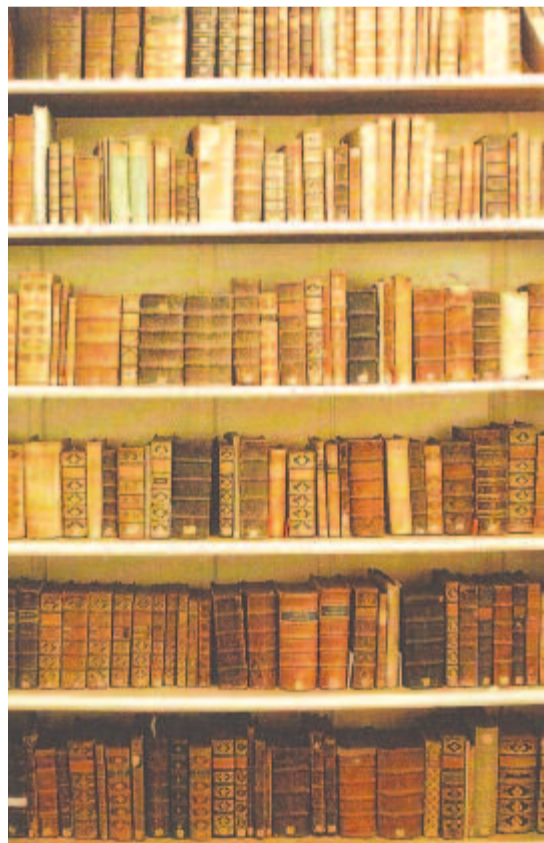
Bethlen Zsuzsanna könyvgyűjteménye