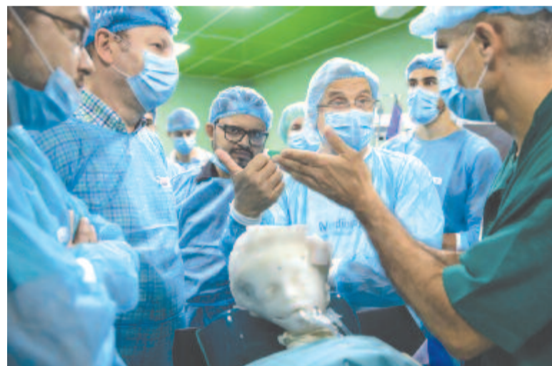
A műtétre készülve