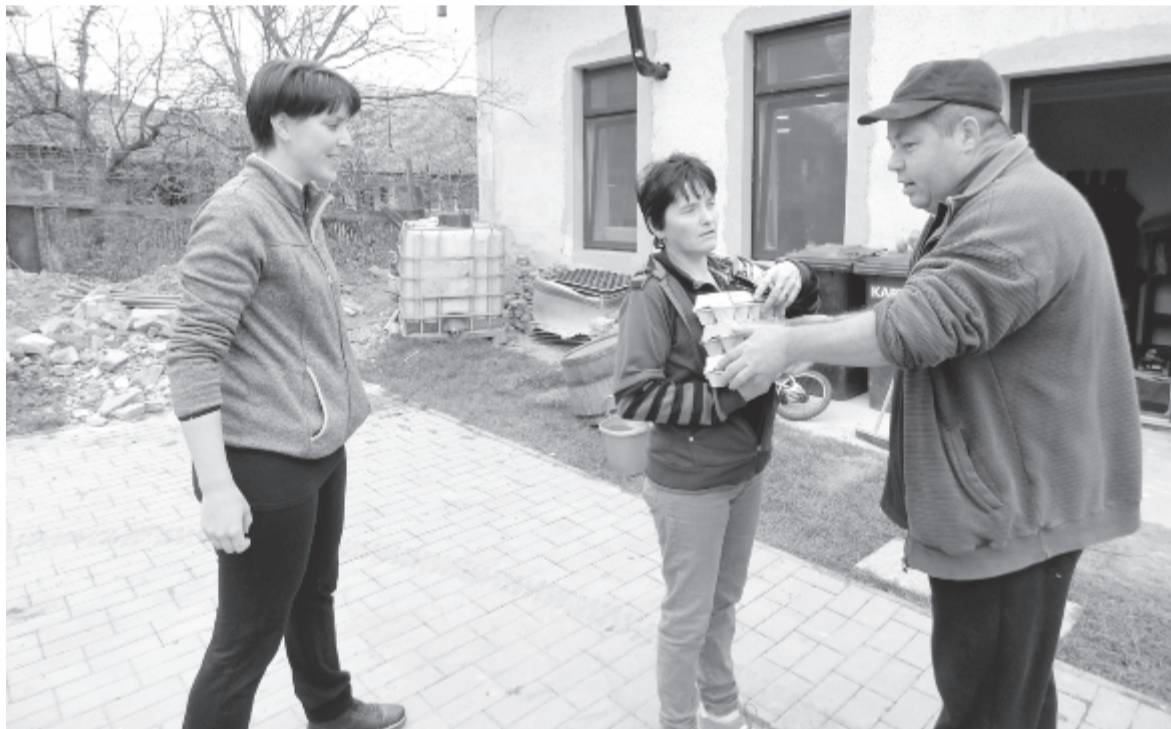
A disznó mellett helyi terményeket is vásároltak a konyhára