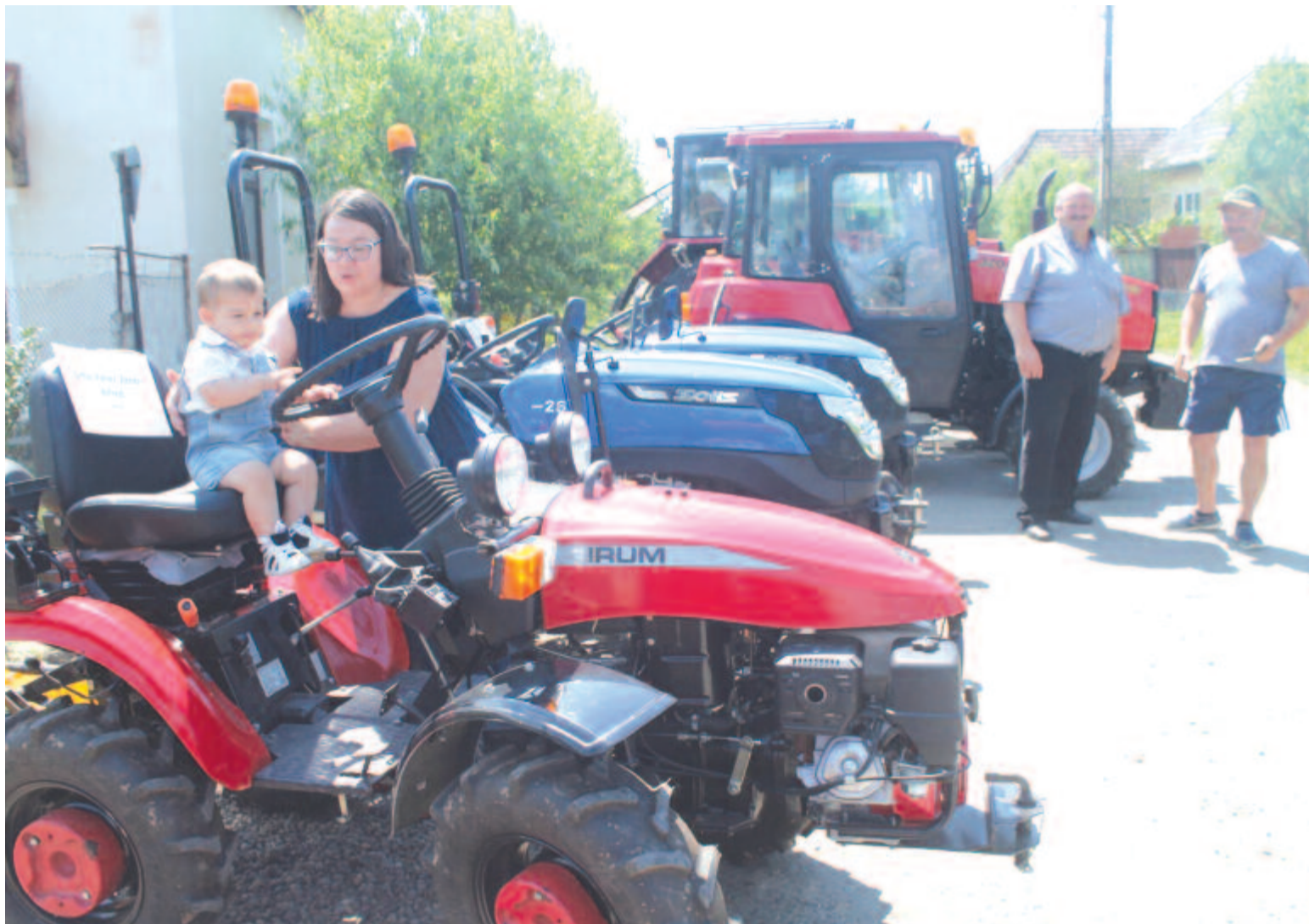
A mezőgazdák már korábban kaptak támogatásokat