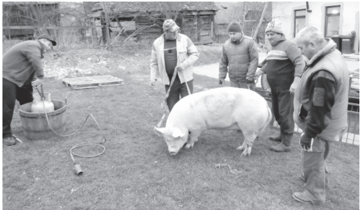
A lovagrend erdélyi tagjai egy disznóval ajándékozták meg az abodi otthont