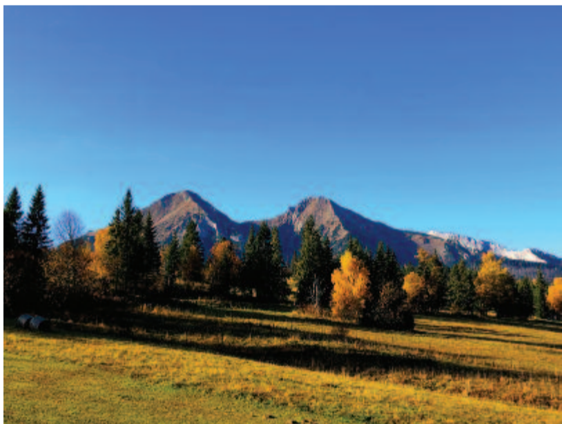
Kolompol az ős kolompja

Az advent első vasárnapját megelőző vasárnapon, most 24-én, köszönti a katolikus egyház Krisztus király ünnepét. Megünneplése viszonylag új keletű, XI. Piusz pápa rendelte el a megemlékezést 1925-ben. A gondolat maga nagyon régi. Pál egy őskeresztény himnuszt idéz a kolosszei hívek bátorítá-