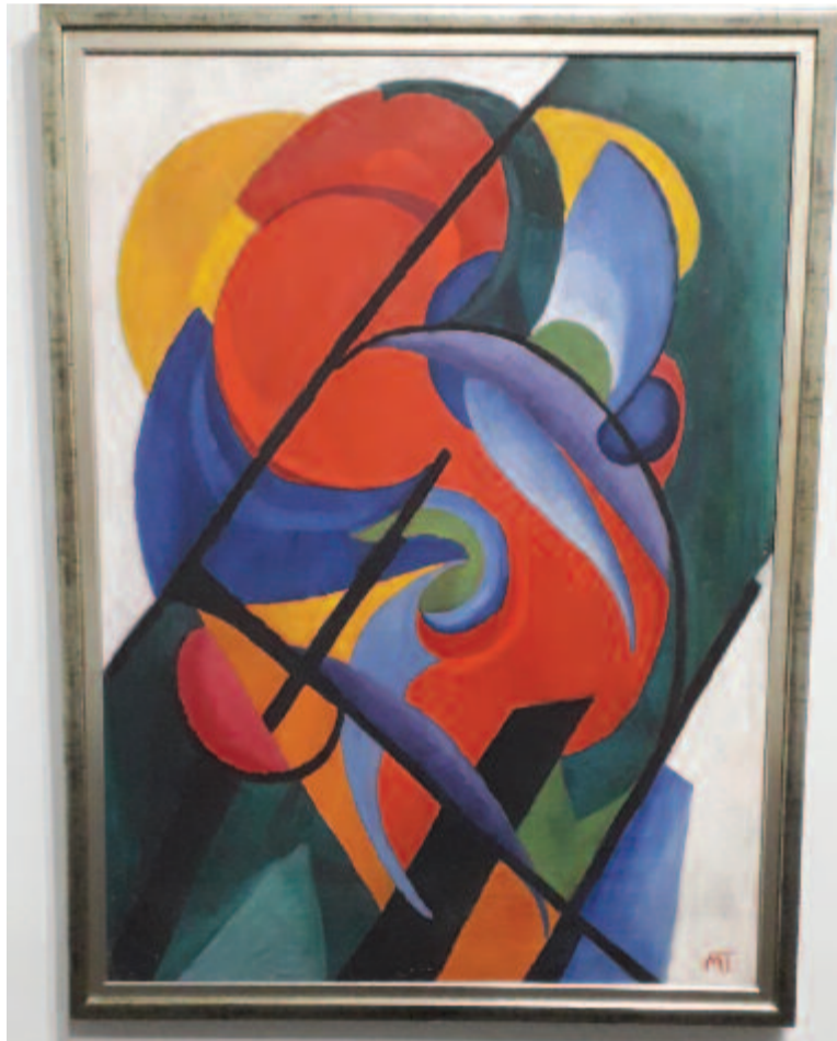
Hans Mattis Teutsch: Kompozíció

– A kolozsvári iskola, a kolozsvári festők. Nagyjából ismertem őket, de most ők adtak fontos eleményt számomra. És persze a szász festészetet jobban meg szeretném ismerni. Ugyanakkor Ferenczy Károlyról szeretnék egy rendes monográfiát írni, csak sajnos mindig mást csinállok. A marosvásárhelyi képtár Bernády-gyűjteményében most újra örömmel láthattam viszont Ferenczy két nagyszerű festményét, amiket ki is állítottunk. Hátha ez is ösztönzést ad a további munkámra.