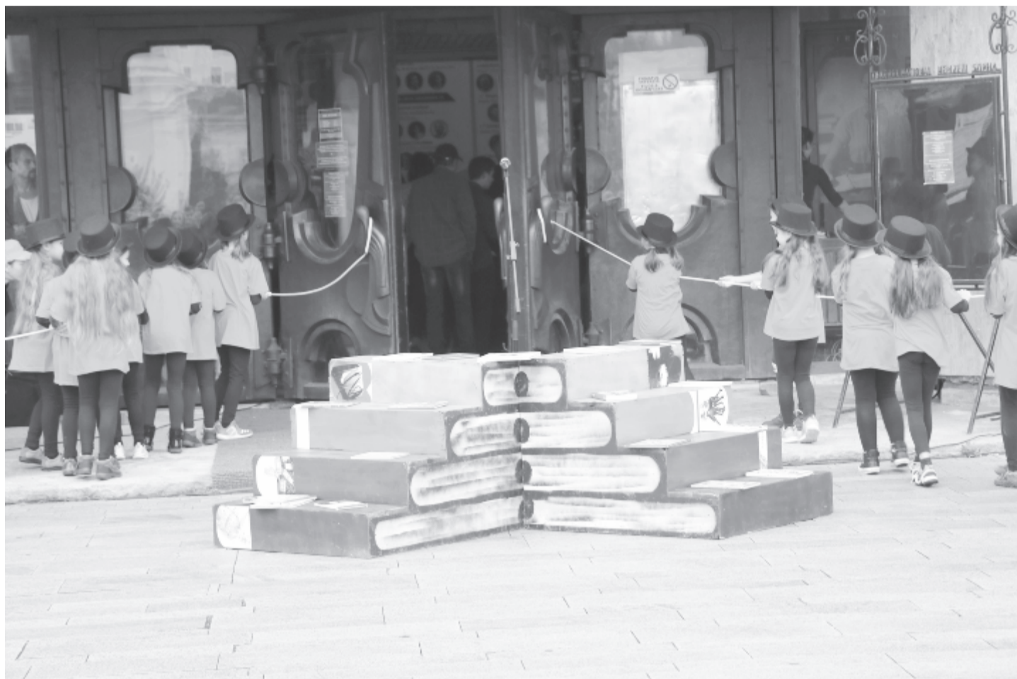
Kapunyítás a 25. Marosvásárhelyi Nemzetközi Könyvvásáron

*1914. november 13-án született, 2006. november 27-én hunyt el a költő