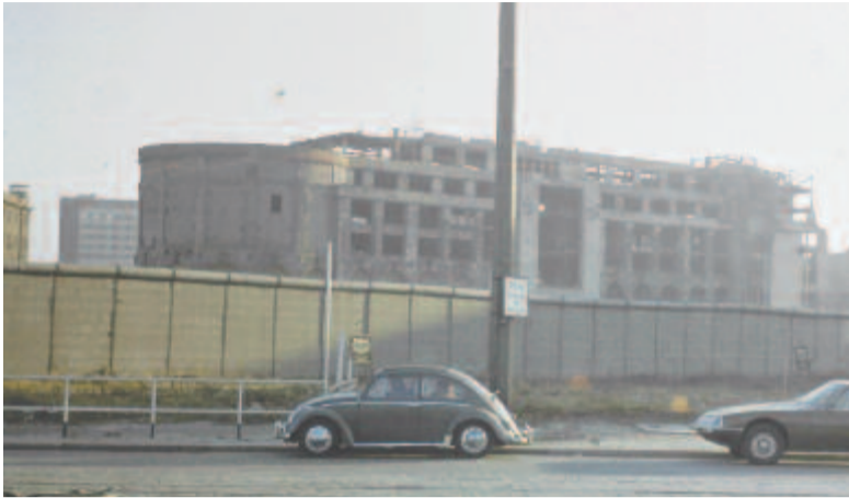
A berlini fal a '70-es években

1961. augusztus elsején kétórás telefonbeszélgetést folytatott Hruscov szovjet és Ulbricht keletnémet pártvezető. A hosszas eszmecsere, amelyet a pártvezetők maguk között őszintén lefolytattak, Ulbricht minden szépítés nélkül a „szocialista segélynyújtás” reményében vázolta fel az NDK katasztrofális élelmiszer-ellátását és az ebből fakadó, robbanással fenyegető általános elégedetlenséget. Ezzel közvetve a „mezőgazdaság szocialista átalakításának”, magyarul (vagy inkább oroszosan) a kolhozosításnak a kudarcát is elismerte. Két év katasztrofális terméseredményei után az alapvető élelmiszernek számító burgonya és vaj alig volt már a piacon, a fejőteheneket takarmányhiány tizedelte. De Ulbrichtnak nemcsak az időjárásal gyűlt meg a baja, a tehetős parasztság „fasisztoid” magatartását és a Nyugat bomlasztó szabotázását is felemlítette. Azzal sem nagyon dicsekedett, hogy az NDK-állampolgárok lábba való szavazata felerősödött. 1949 és 1960 között az NDK 17 millió lakosából 2,6 millió telepedett át a Szövetségi Köztársaságba, hogy 1961-ben már napi 1500–1900 főt regisztráljanak a nyugat-berlini me-