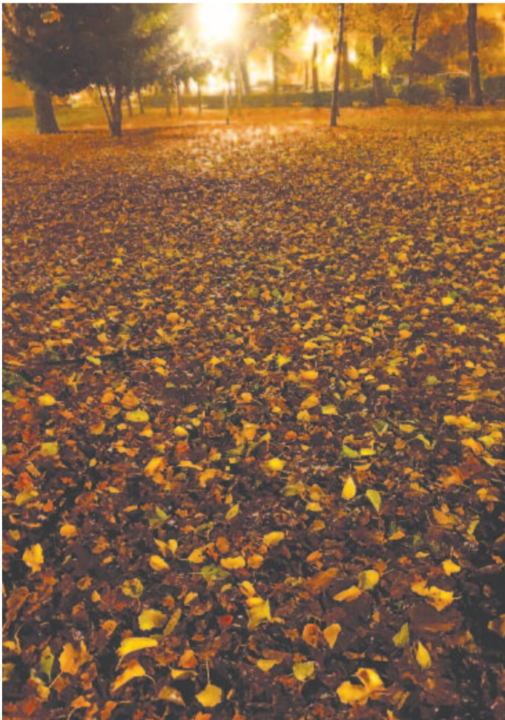
Sárguló levelek asznak s ködöt pipálnak