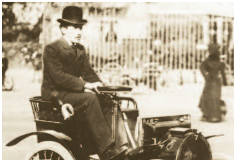
Louis Renault kiskocsiján

A napjainkban nemzetközi nagyvállalként működő Renault Csoport a világ negyedik legnagyobb autógyártója, stratégiai szövetségben a japán Nissan és Mitsubishi autógyártó cégekkel. 128 országban van jelen, ahol személyautókat és haszongépjárműveket terveznek, gyártanak és értékesítenek több márkanév (Renault, Dacia, RSM) alatt. (MTI)