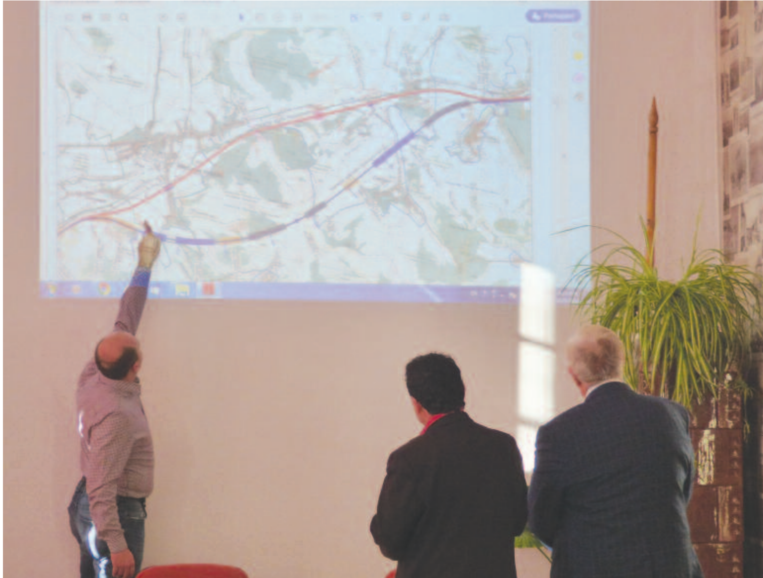
Polgármesterek vizsgálják a tervezett nyomvonalat – talán a módosított változat kevesebb rosszat hozna a nyárádmontiek számára