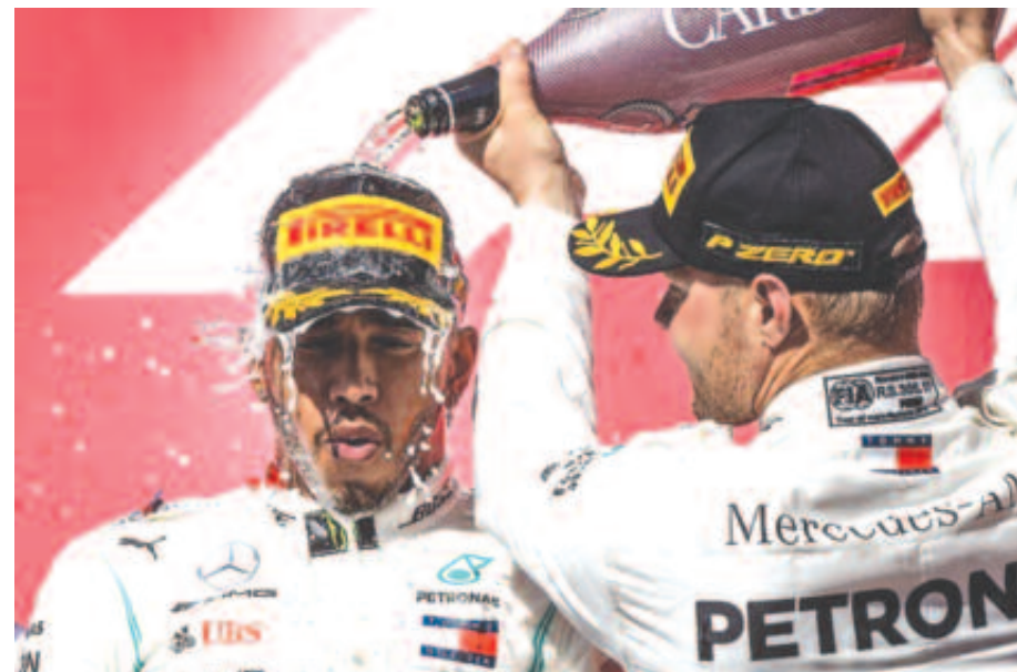
A futamgyőztes Bottas világbajnok csapattársát ünnepli.

S hogy mi akadályozta meg abban, hogy futamgyőzelemmel ünnepelje az újabb vb-címet? Austinban jól indult a verseny, az ötö-