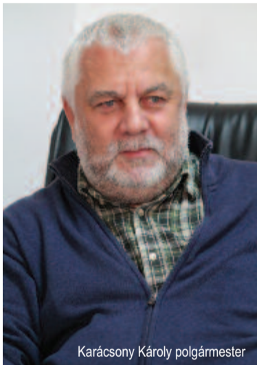
Karácsony Károly polgármester

Amint a polgármester hangsúlyozta, nincs rá igény, naponta két-három utasról lenne szó, annyira nem lehetne ezen változtatni? – kérdeztük.