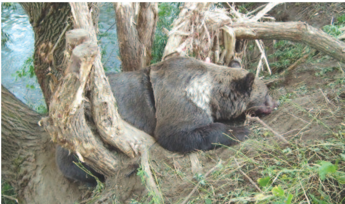
Medve vadászóhurokban, elaltatva

Ami pedig a kvótamegállapítást illeti, ez is lutri. Mivel nem tudjuk pontosan, hogy mennyi a medvék létszáma Romániában, nem lehet meghatározni azt a minimális létszámot (kvótát), amely kilőhető. Tudomásom szerint Romániában mintegy 700 olyan vadászterület van, ahol medve is él. Ha – mondjuk, sarkítva – vadászterületenként egy évben kettő kilövését engedélyezik, akkor ez 1400 medvét jelent, ami nem lenne jó. Ez hosszú távon biztosan a kipusztulás veszélyébe sodorná