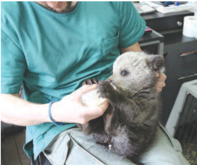
Árva medvebocs ideiglenes gondozása

– Ez részben igaz, de a jogszabály csapdahelyzetbe hozza az országot. Több európai országgal szemben, ahol a medvéket és a farkasokat kiirtották, nálunk bőven van belőlük. Ezzel azonban úgy állunk, hogy nem igazán tudjuk, miről beszélünk. Vannak ugyan hivatalos számok a romániai állományról, de eddig nem mérték fel tudományos módszerekkel a teljes létszámot. Nem tudjuk, hogy hány medve születik vagy pusztul el évente. Amint említettem, nagy a vándorlásuk, nem tudjuk igazából, mit esznek, és egyedenként mekkora területet használnak. Ezért a medveügy kezelésének első lépése kellene legyen több – nálunk végzett – hasonló kutatási program elindítása, finanszírozása, amivel elsősorban tudományos módszerekkel fel lehetne mérni az állományt, és így egy sor olyan kérdésre kapnánk pontos választ, amit eddig csak találgattunk. Ahhoz, hogy megállapítsuk egy adott természetes élőhely eltartóképességét, olyan kutatásra van szükség, amely mindezekről pontos képet ad. Túlszaporodásról beszélünk, de nem tudjuk, hogy mihez képest. Mint ahogy azt sem tudjuk meghatározni, hogy átlagban alomként hány bocs születik vagy pusztul el a természetes szelekció során. Az említettek miatt így azt sem tudjuk felmérni, hogyan hat a vadászat az állománycsökkentésre, a szaporulatra, milyen hosszú távú következményei lehetnek egy adott terület természetes egyensúlyára.