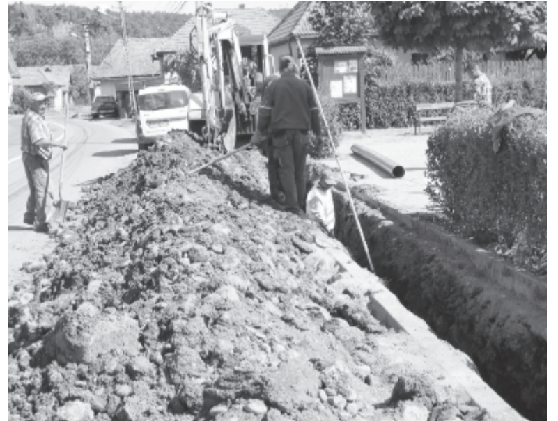
Két szakaszban, viszonylag gond nélkül épül a községi csatornahálózat

beruházási alaphoz, amely hosszú lejáratú kölcsönt biztosít, ennek kamatját átvállalja az állam. Szeretnék egy sportcsarnok létesítését is megpályázni az országos beruházási társaságnál, a sportpálya mellett építenék fel. Támogatást nyert az önkormányzat és néhány szomszédos község azon pályázata, amely a vidék turisztikai adottságait aknázná ki közös projektben. Ennek keretében Vármezőben az egykori kisvasút megállójában egy, az osztrák-magyar monarchia idejéből való bakterházat is felépítenének.