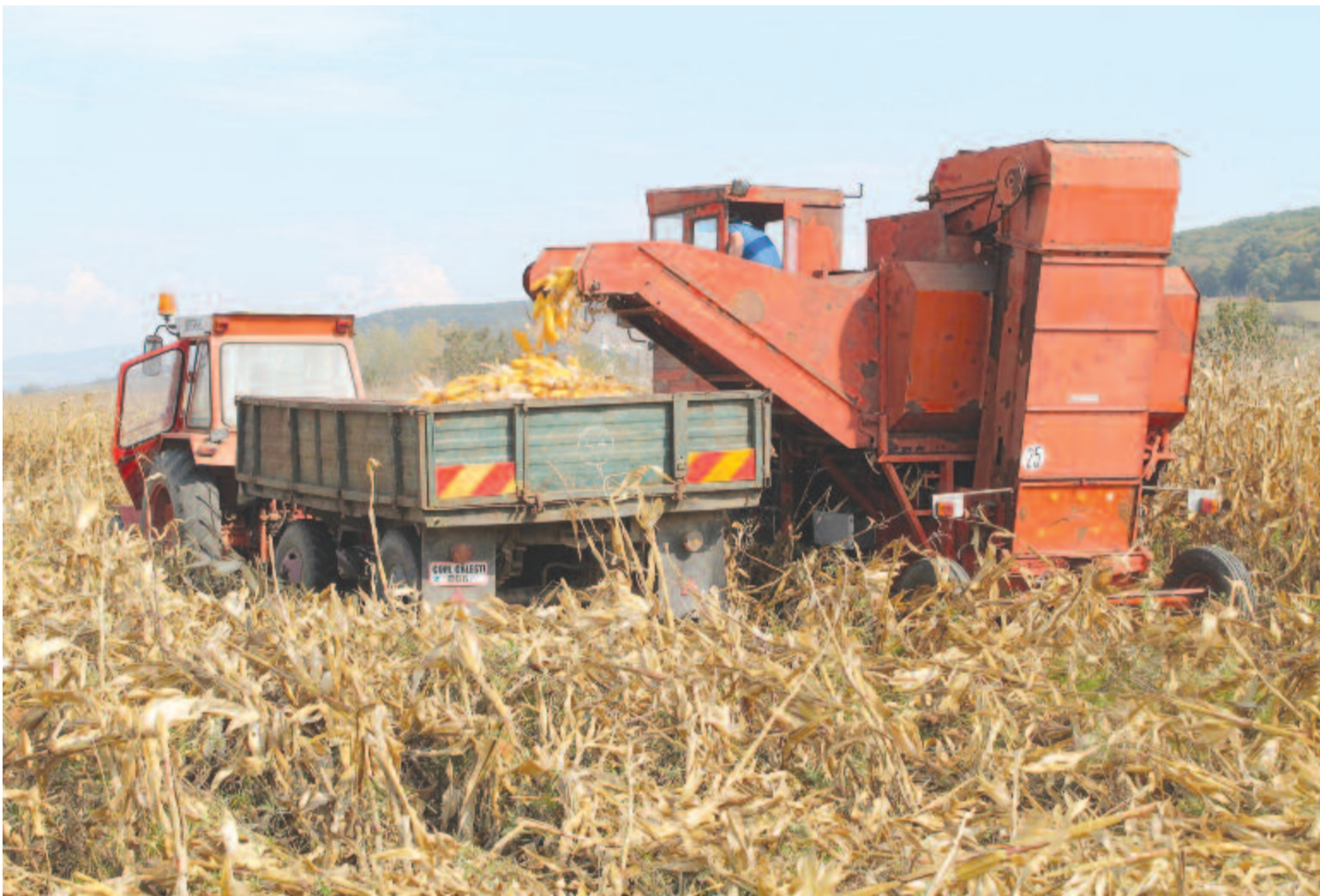
Nyárádgálfalvi vendégoldalunk a 6. oldalon