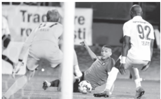
A konstancai klub közösségi oldala

* Merkantil Bank Liga NB II, 10. forduló: BFC Siófok – Soroksár SC 1-1, Budafoki MTE – Kazincbarcika 2-2, Aquavit FC Csákvár – WKW ETO FC Győr 3-2, Gyirmót FC Győr – Békéscsaba 1912 Előre 2-0, Szombathelyi Haladás – FC Ajka 2-4, Szeged-Csanád Grosics – Dorogi FC 1-0, Szolnoki MÁV FC – Budaörs 2-0, Vác FC – Vasas FC 0-4, MTK Budapest – Nyíregyháza Spartacus FC 2-1. A Tiszakécske szabadnapos volt. Az állás: 1. MTK 21 pont, 2. ETO FC Győr 20 (16-7), 3. Siófok 20 (15-7)