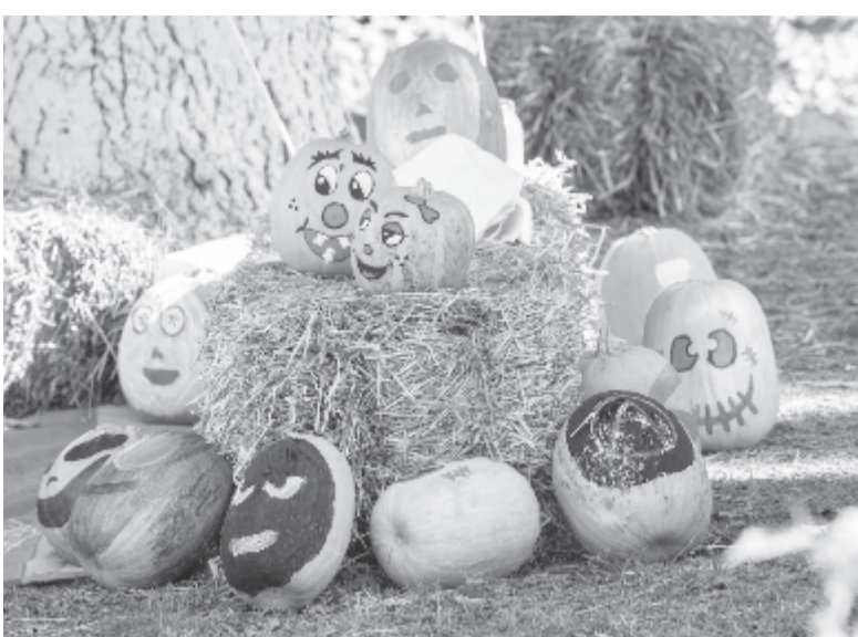
Csak a képzelet szabott határt a színes, ötletgazdag díszítésnek, tökkompozícióknak

Hatodik kiadásán van túl a szovátai tökfesztivál, a fürdőváros idei utolsó nagy tömegrendezvénye. Az ötlet a fürdőtelepi vendéglátóegységek egyesületétől származik, amely évekként elvezette, hogy a nyári idény után is pezsgést kell vinni a szovátai őszebe, ezért az idényre jellemző tökre esett a választásuk, amelyre rendezvényt lehet(ett) felfűzni. A cél, hogy a városba minél több vendéget, látogatót vonzzanak, akiknek színvonalas szolgáltatásokat tudnak majd nyújtani, mert mindezeknek gazdasági haszna is lesz. Így szervezték meg az első kis rendezvényt a vendéglátósok, a saját zsebükből összeadva a pénzt. Négy éve az önkormányzat vette át a főszervezői szerepet, természetesen a turisztikai egyesülettel és a turisztikai népszerűsítő és tájékoztató irodával közösen dol-