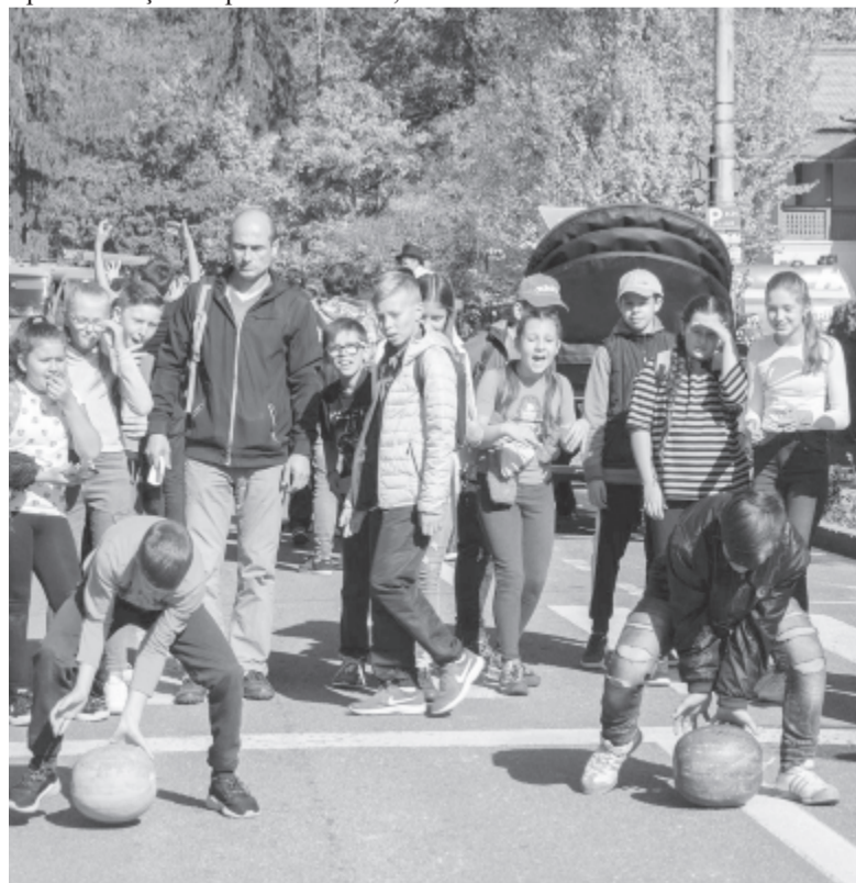
Hatalmas tömeg töltötte be a hétfévégén a fürdőtelepet