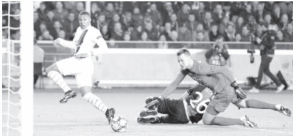
Tizenegy éve nem ért el mesterhármast csereként szerepet kapó játékos, Mbappének Bruges-ban sikerült.

A D csoport esti összecsapásán a Lokomotiv Moszkva a 77. percig meg tudta őrizni egygólos előnyét, Dybala két góljával viszont két perc alatt fordított a Juventus.