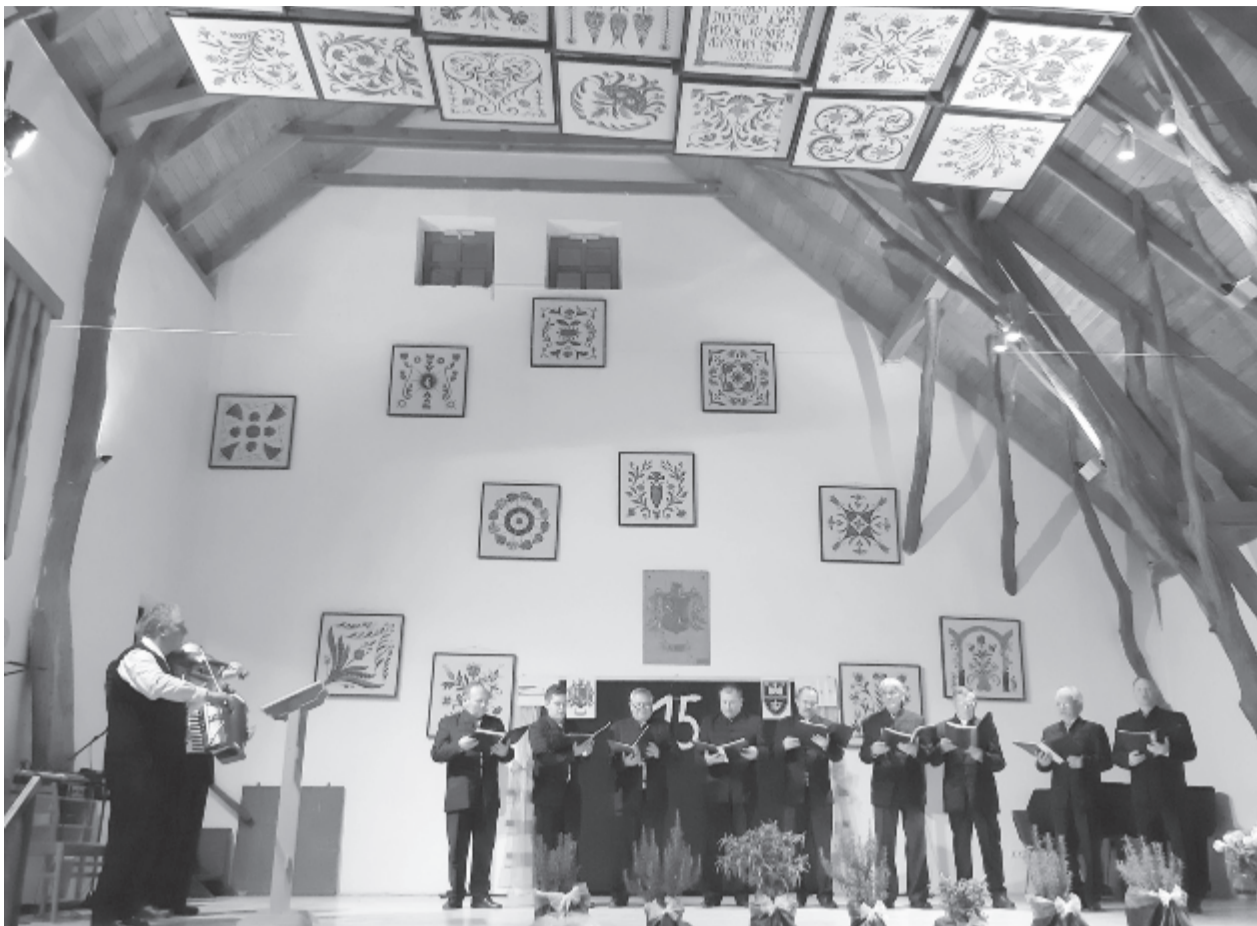
A kakasdi sváb kórus jubileumi ünnepségére meghívást kaptak a jobbágyfalviak is