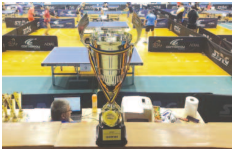
A serleg, amelyért játszottak