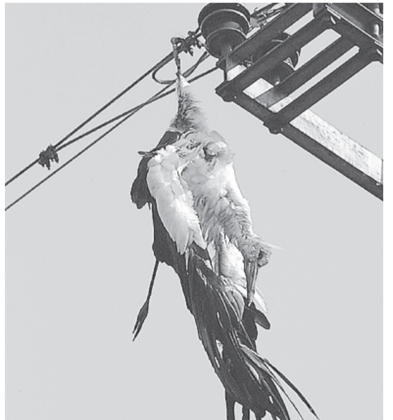
Milvus Csoport Madártani és Természetvédelmi Egyesület