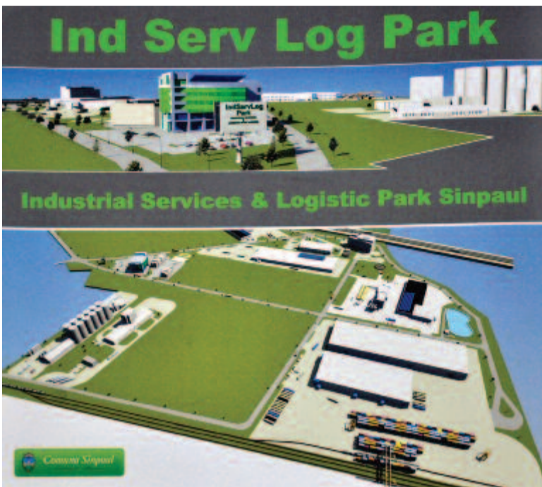
A logisztikai központ látványterve

A rendezvényen 142 ország képviselői vettek részt, a romániai standon 19 cég, társulás, illetve kistérség mutatta be kínálatát. Mint ismeretes, a megyei tanács által koordinált ipari park közelében, Kerelőszentpál község területén 260 hektáros ipari zónát, illetve logisztikai központ megépítésére alkalmas területet határoltak el a község általános területrendezési tervében. A hely erőssége, hogy közvetlenül az autópálya közelében van, megközelíthető vasúton, hiszen a kerelőszentpáli állomás is gyakorlatilag a kijelölt terület mellett van, és alig néhány kilométerre van a repülőtér is. Az önkormányzat közművesítette a területet, és vállalja az épületekig vezető bejárat megépítését. Ezen a helyen épült fel a takarmánymalom. A polgármester szerint a müncheni rendezvényre naponta mintegy 40.000-en látogattak ki. Igen sokan érdeklődtek a romániai lehetőségek felől. Konkrétan a kerelőszentpáli ajánlat iránt egy németországi és egy osztrák autóiipari