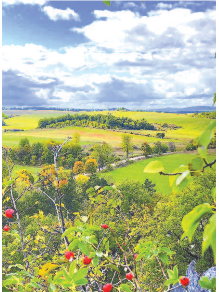
A végtelenből jő a szél

Szilva fő az üstben, lesz már kenyérré, tésztába lekvár.