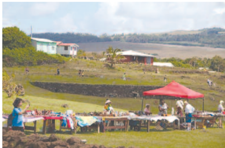
Lakóházak és árusok

Nagyjából körbeutaztuk a szigetet, az utak elég gyengék, de teherforgalom nem létezik, a turistáknak pedig megfelelnek a jelenlegi utak. Egyszer-egyszer hatalmas, sárgás felhő jelzi, ahol egy-egy busz elhaladt, de a legnagyobb forgalmi veszélyt a vadlovak jelentik. Sok van, és nagyon kiszámíthatatlanok.