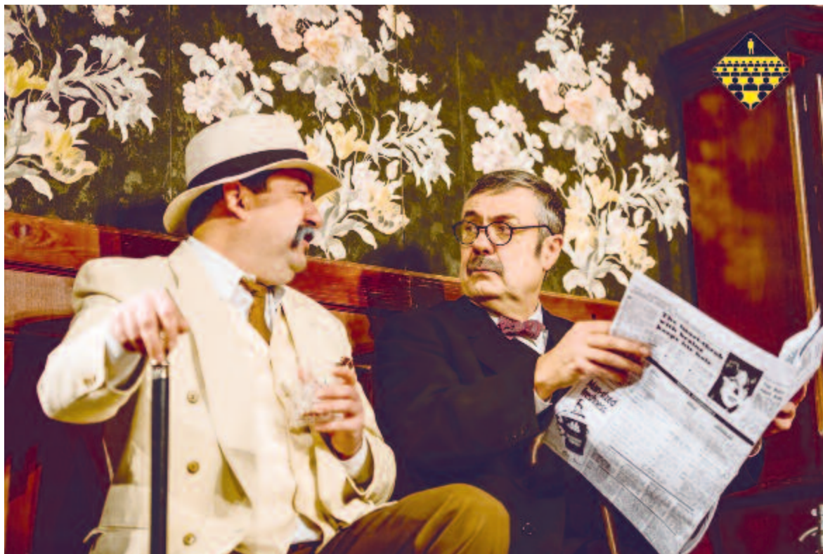
A láthatatlan hóhér „...és már senki sem!”