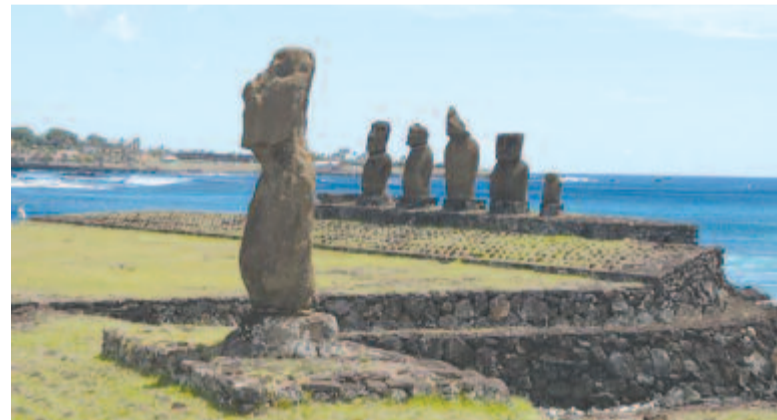
Ahu Vai Uri, Ahu Tahai

A bűnözés szintje alacsony a szigeten, de azért van egy börtön, ami látogatható. Mivel a szigeten a középiskolánál magasabb szintű iskola nem létezik, a helybeliek elnevezték a börtönt egyetemnek. Mert ha valaki megkérdezi, hol van a fiad, jobban hangzik, ha azt monddod, hogy az egyetemen van, mint a börtönben.