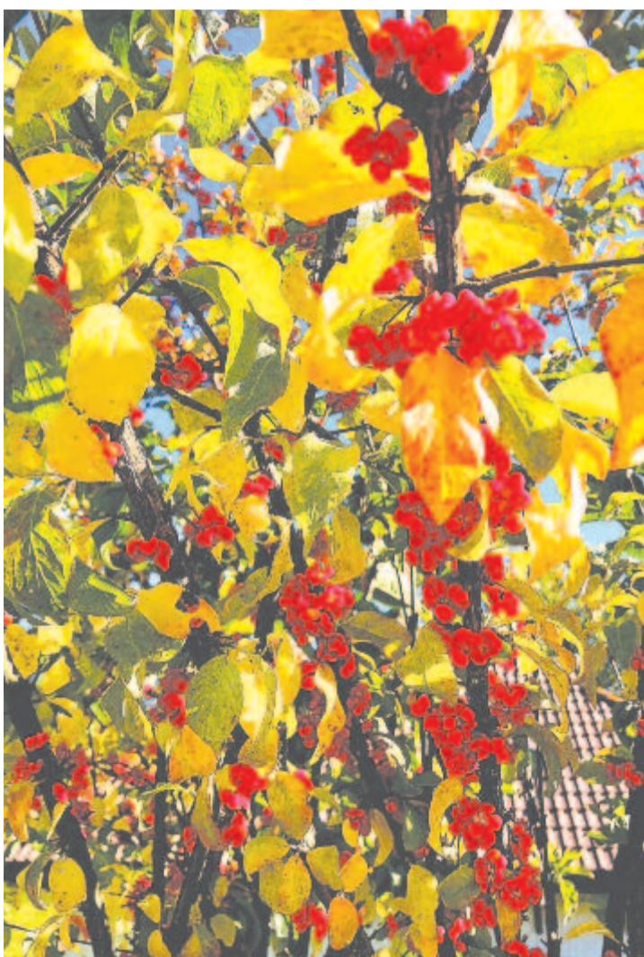
Sárga, piros zászlóit lengeti a cifra ősz a nap fakó tűzére

Kelt 2019-ben, 467 évvel Eger megvédése után