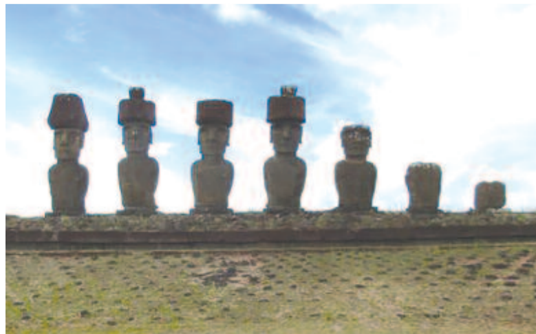
Ahu Nau Nau Anakena