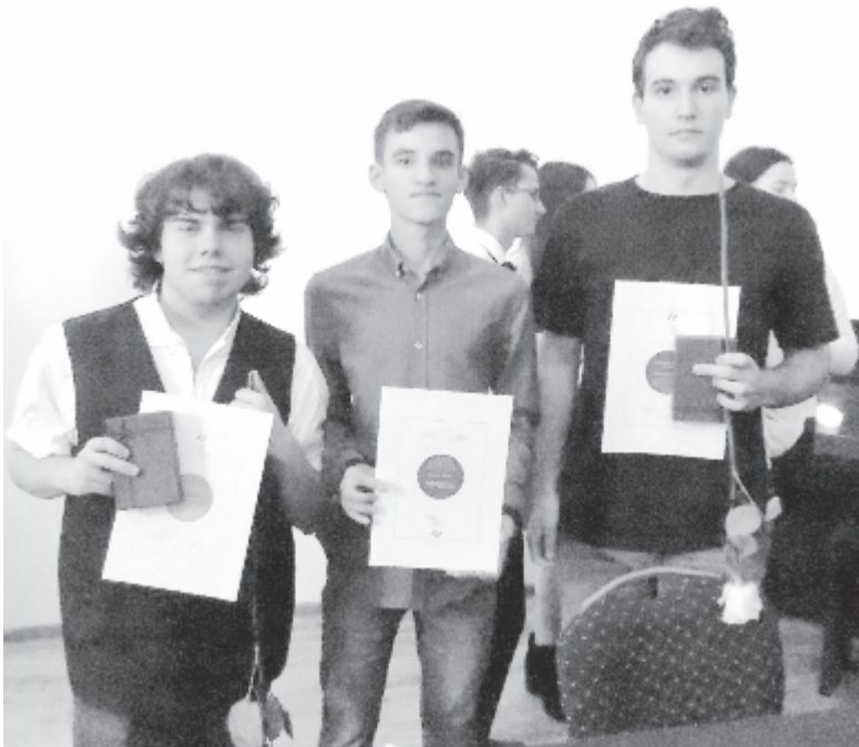
Mákvirág díjas diákok

Az ünnepségen a Mákvirág díjasok zenével, szavalattal, ügyességi és bűvészműtárványokkal szórakoztatták a közönséget. Fellépett a sepsiszentgyörgyi Pro Musica kórus is, amely meglepetésként vett részt karvezetőjük díjazásán. A díjkiosztó nemzeti imánk elnevelésével ért véget.