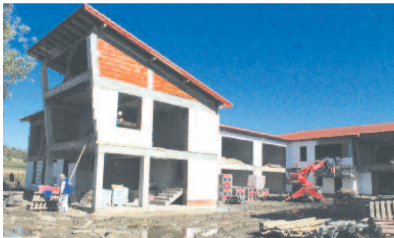
Épül az új ákosfalvi iskola

számoltuk, hogy három-négy év alatt egy ekkora beruházást megbír a község. Ákosfalván van már két strandunk – egy Benedeken és egy a volt téesz udvarán –, ezek mindig tele vannak. Ám Harasztkeréken működik egy lovarda, és emiatt akkora esténként a forgalom, mint egy városban. Úgy gondoltam, ha már amúgy is ennyien járnak ide, a látogatókat és a helyi gyerekeket is képviselve kössük össze az olyan programokat, mint a lovaglás és az úszás. Ez okból a község iskoláiban tanuló diákokat díjmentesen szállítjuk majd oda, és úszótanfolyamokat indítunk nekik, hogy megtanulhassanak úszni. Eddig a mi költségünkön megtanítottuk őket táncolni, most megtanítjuk a következő generációt úszni. Az élményfürdő 80 százalékban elkészült, a vizet egy ötven méter mélységben talált forrás biztosítja, a vízszűrő, -csereleő berendezéseink a legkorszerűbbek, a forrásnak óránként több mint ezerliteres hozama van. A vizet laboratóriumban vizsgálják, és az eddigi eredmények szerint nagy a valószínűsége, hogy gyógyhatása van – 30-40 méteren kékpala-hegyet találtak a medencék alatt, mellett. December 30-a az átadási határidő, reményeink szerint jövőre már a vadonatúj harasztkeréki élményfürdőben fürödhetnek az érdeklődők.