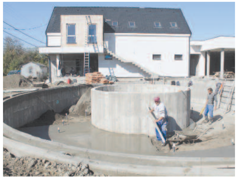
Készülőben a harasztkeréki élményfürdő medencéi