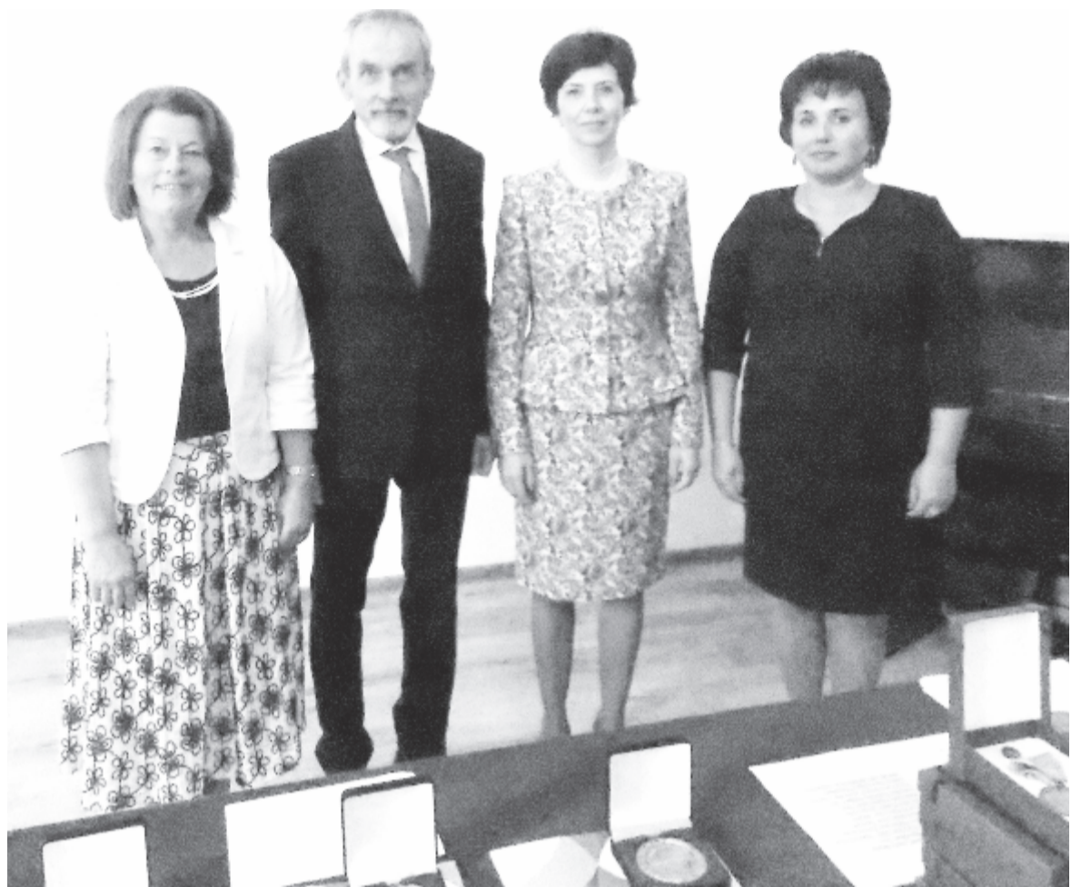
A jelen levő Ezüstgyopár díjasok