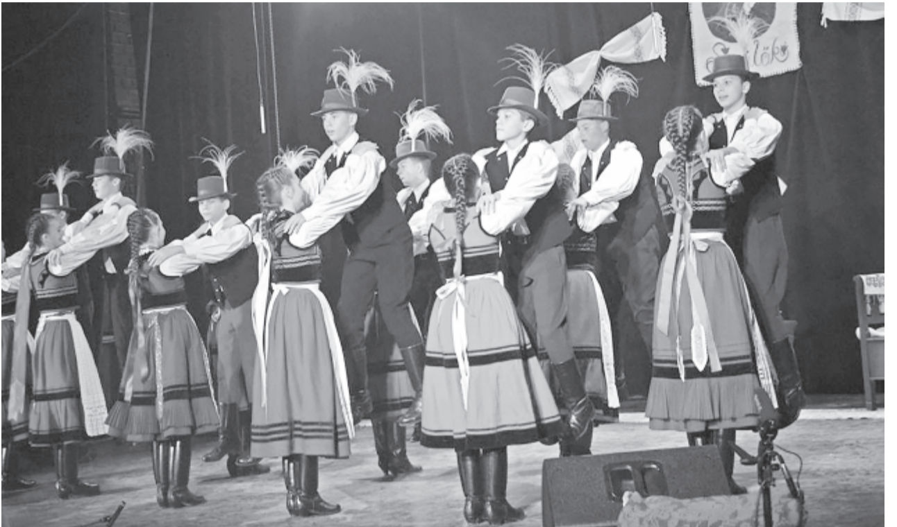
A néptáncgálán hét együttes lépett fel

A rendezvény megvalósulása a Nemzeti Kulturális Alap, a Bethlen Gábor Alap, a Maros Megyei Tanács és Szováta város támogatásának köszönhető. A jogi és logisztikai háttér az Educatio SIL Egyesület és a Bernády Közművelődési Egylet biztosította. (gligor)