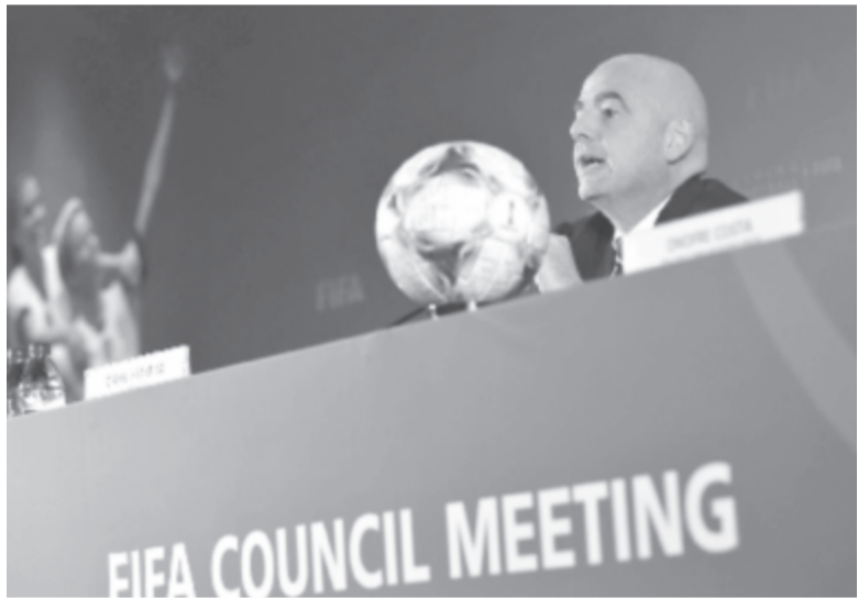
Gianni Infantino elnök szerint a Nemzetközi Labdarúgó-szövetségnek várhatóan egymilliárd dolláros bevétele származik a tornából, és éppen ennyit szándékoznak a női labdarúgás fejlesztésére fordítani az elkövetkezendő négy évben

A testület ülésén döntöttek arról, hogy a FIFA 2024-es kongresszusán szavaznak a 2030-as vb-rendezésről. Az eddig ismert pályázók között szerepel Kína, illetve Dél-Amerikából is intenzíven érdeklődtek egy közös rendezés iránt, miként Anglia is társulna Írországgal, Észak-Írországgal, Skóciával és Walesszel. A 2022-es vb-t Katarban, a 2026-ost pedig az Egyesült Államokban, Kanadában és Mexikóban rendezik.