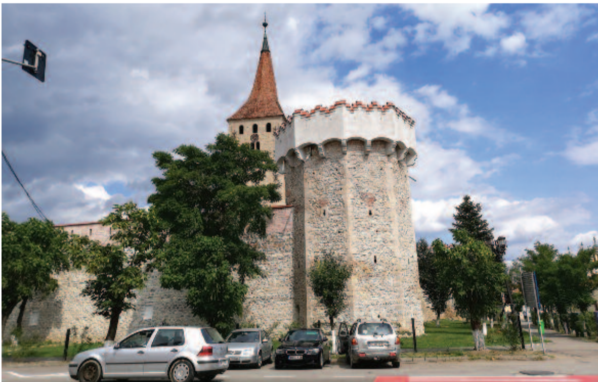
A nagyenyedi vár

A város nagy híru református kollégiumát 1622-ben Bethlen Gábor alapította. 1662-ben helyezték át ide Gyulafehérvárról. Ma a fejedelem nevét viseli. A Bethlen