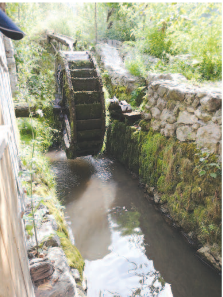
A vízimalom. Udvarán kis házimúzeum látogatható

1514-ben a felkelés idején a parasztsereg elfoglalta a falut. A Rákóczi-szabadságharc idején, 1702. november 17-én Rabutin, 1704. március 15-én pedig Tige(wd) labanc csapatai rabolták ki a települést. Örtornya 1864-ben még ép volt, de 1874-ben már rom, azóta pusztul. A hegy oldalában számos barlang található, ahol a lakosság veszély esetén meghúzódott.