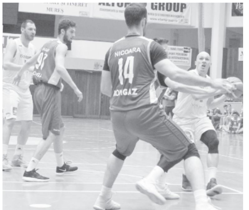
Kilyén (j1) Zsilvásárhelyen, Sánta (b1) Pitești-en folytatja, Marosvásárhelynek pedig 15 év után először nem lesz csapata az ország első osztályú bajnokságában.

Nem hivatalos, de szinte bizonyosra vehető információk szerint – hiszen sem a klub nem kommunikál már hetek óta, de a sportági szövetség sajtó iránti nyitottsága is erősen megkérdőjelezhető – a Marosvásárhelyi CSM férfi-kosárlabdacsapata visszalépett az országos bajnokság B értékcsoportjából, és egy szinte kizárólagosan ifjúsági játékosokból álló együttessel az 1. ligában kíván részt venni, amelyet az idénytől szerveznek meg újra.