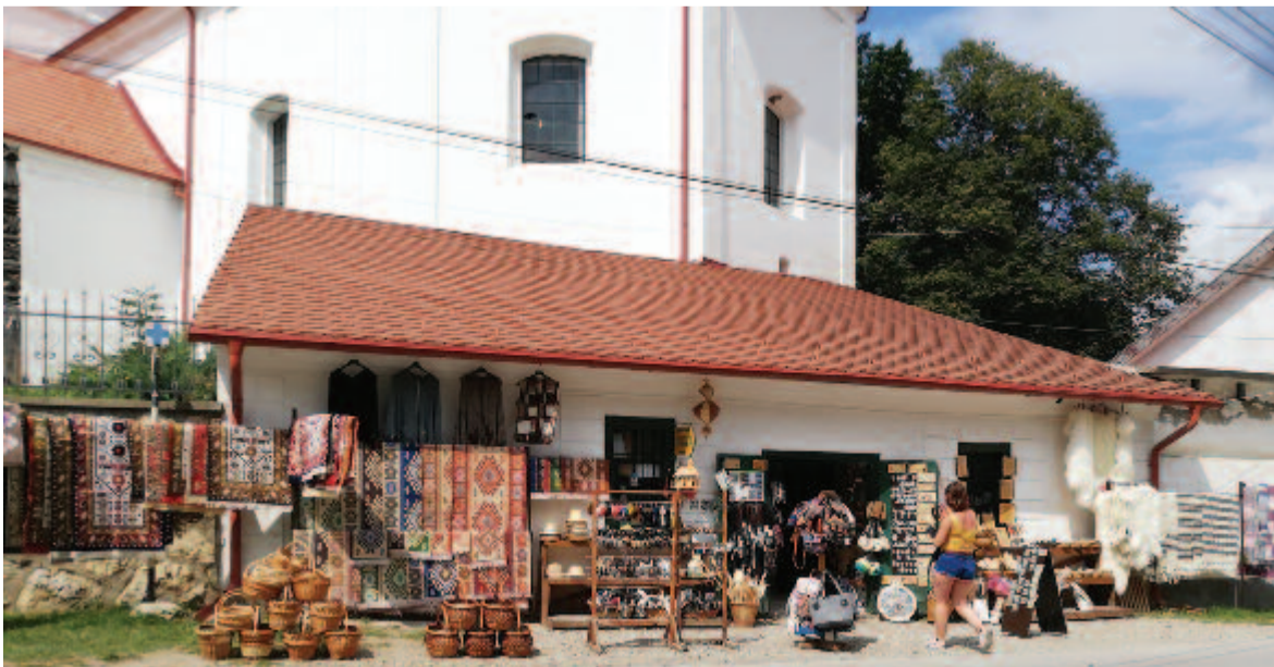
Kézműves-termékek az unitárius templom mellett

A kollégium híres tanárai és diákjai közül a legismertebbek: Apafi Péter, Apáczai Csere János, Aranka György, Áprily Lajos, Sütő András. A lista nagyon hosszú, érdemes elmenni és „élőben” megnézni. A Bethlen Gábor Kollégium legendás nevelőmunkája elismerésképpen 2003-ban Magyar Örökség díjat kapott. (Forrás: Wikipédia)