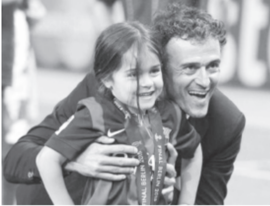
A korábbi spanyol szövetségi kapitány 9 évesen elhunyt kislányára emlékeznek.

Románia ma, csütörtökön 21.45 órától Bukarestben fogadja a spanyol csapatot, majd vasárnap 19 órától Ploiești-en Máltát látja vendégül. Mindkét mérkőzést a Pro TV közvetíti.