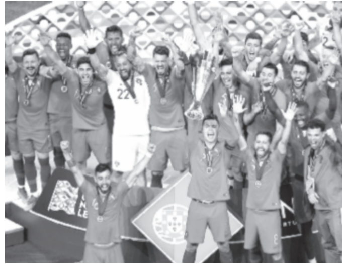
A Nemzetek Ligája-győztes luzitán gárda egyelőre nyeretlen a sorozatban

A hollandok sem állnak jobban, csoportjukban az északírek négy, míg a németek három találkozó után százszázalékosak, így ha az Oranje pénteken kikap Hamburgban, akkor a hátránya hasonlóképpen tetemesé válik. A csoportban hétfőn is rangadót rendeznek, akkor a németek Belfastban lépnek pályára.