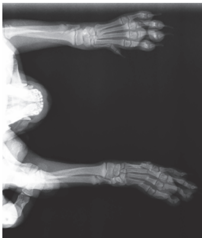
Egyéves kutya mellső lába