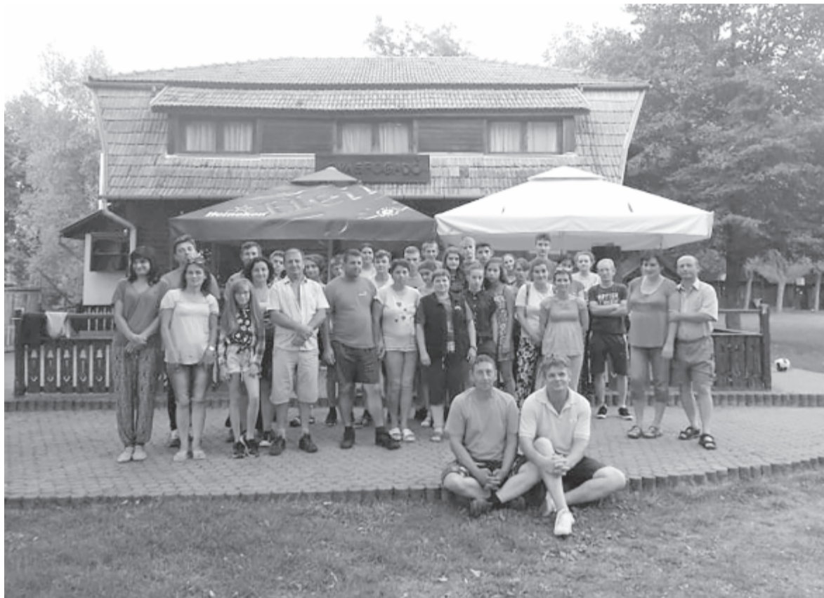
Táborzáró pillanat a Lovasfogadóban

Múlt héten három napig a kölpényi fiatalokkal és néhány önkéntes gyülekezeti taggal a csendes nyáradmenti pihenőhelyre vonultak vissza, ahol a pihenés mellett mozgásra, szórakozásra, éneklésre is alkalmuk volt. Foglalkozásaik programját hármastéma töltötte ki: Isten a teremtésben, Isten a történelemben, Isten az életünkben. Ezek során rávilágítottak, milyen apró lény az ember a világban, és hogy