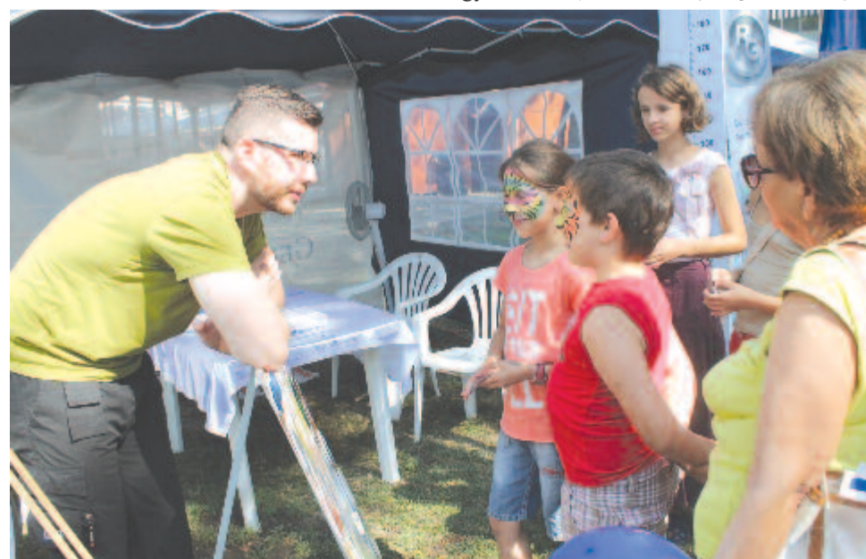
Párbeszéd a helyes táplálkozásról

ták, az volt a benyomásuk, hogy azokat a szülőket, akik a védőoltást ellenző határozott véleménnyel fordultak hozzájuk, a jelek szerint még nem sikerült meggyőzniük.