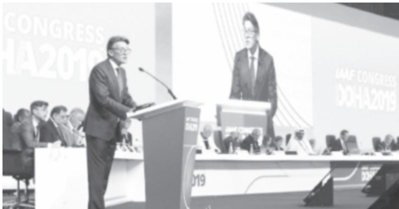
Lord Coe további négy évig lesz az IAAF elnöke

Az NSO szerint az IAAF egységet jelzi, hogy múlt hétfőn 164-30-as többséggel fogadták el azt a