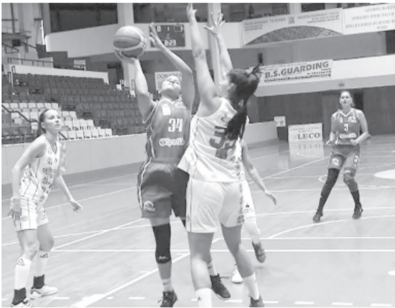
Már csak női kosárlabdában van képviselője a megyeszékhelynek az élvonalban.

Az 1989-es fordulat után volt egy megtorpanás a régi támogatási rendszer elsorvadásának és az új hiányának következtében, de ez az egész országra jellemző volt, és a kétezres évek első évtizedének végére már egyszerre négy marosvásárhelyi csapat játszott az európai kupákban: a férfikosárlabdázók, a női röplabdázók, a teremlabdarúgók (ebben a sportágban is úttörő