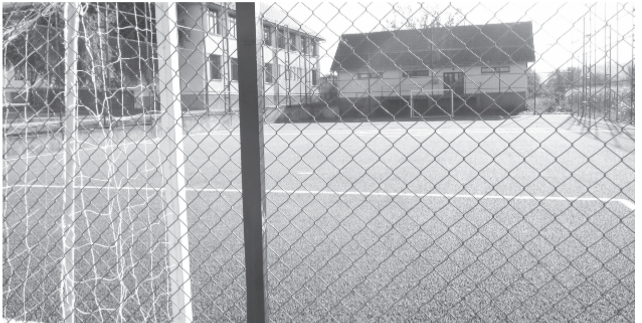
Első látásra kitűnő, a valóságban használatra alkalmatlan a pálya