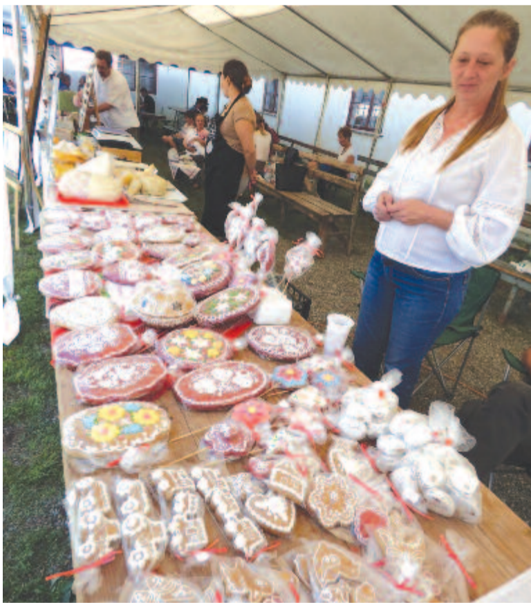
A szakmai programok része a gépképzés és termékvásár is

Eközben az iskolaudvaron helyi termékek vásárán és kiállításon lehetett bámmeszködni és szatyorbakra rakni a szemet-száját ingerlő falokat. Sóváradi kézműves foglyalt, a kebelei Cseh-tanya szörpjei, lekvárjai és italai, a nagyteremi Györfi Árpád zöldségei, a marosvásárhelyi Gödri-méhészet termékei és a mezőcsávási Sunrise Garden bogoyos gyümölcsökből készült lekvárjai, szörpjei, az iklandi Gyarmati Mátyás fekete ribizliből, almából, céklából, murekből préselt levei vagy épp pálinkái éppolyan inycsiklandóak, mint a mezőpaniti Kovács Kinga és Nagy Erna által kínált házi kenyér és friss káposzta, a nyáradszentmártoni Szőke Tímea sajtkülonlegességei, a búzaházi Nagy Erzsébet mézespogácsái vagy a székelyvajai Pécsi-kürtöskalácsok. A kínálatot a mezőkölpenyi szőlészet