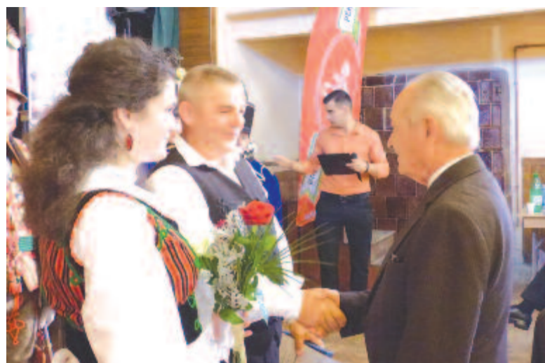
Első ízben adtak át kitüntetéseket, de ezután évente megteszik