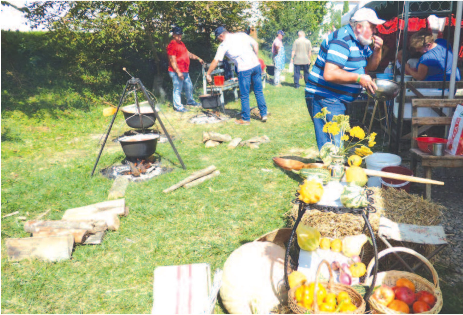
A gazdanap a főzésre, szórakozásra is alkalmat biztosít